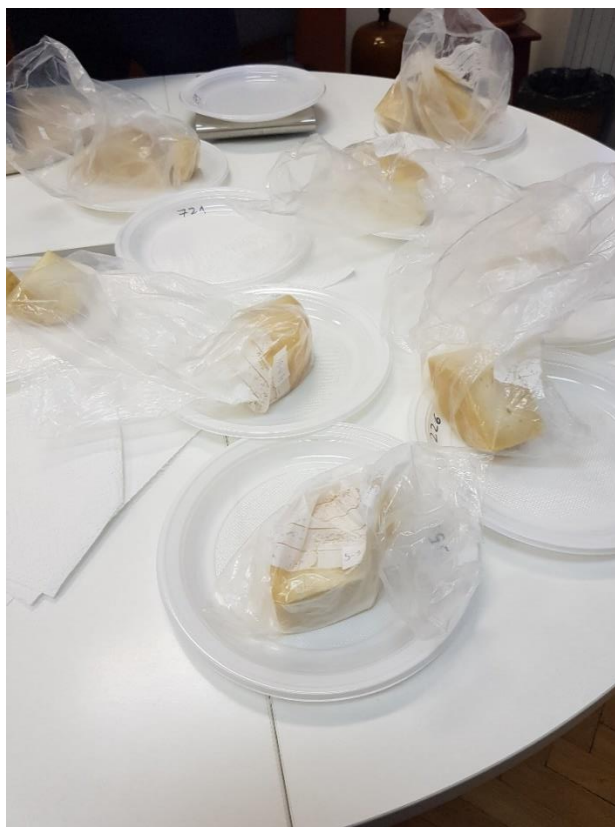
Slika 3.3.2. Šifriranje uzoraka prije ocjenjivanja