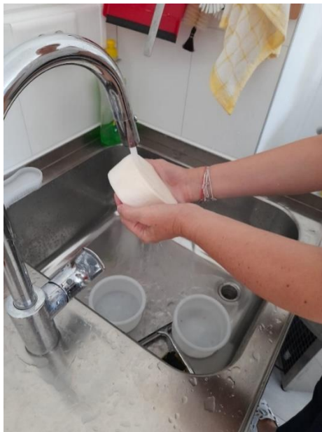
Slika 3.1.11. Pranje sireva po završetku soljenja