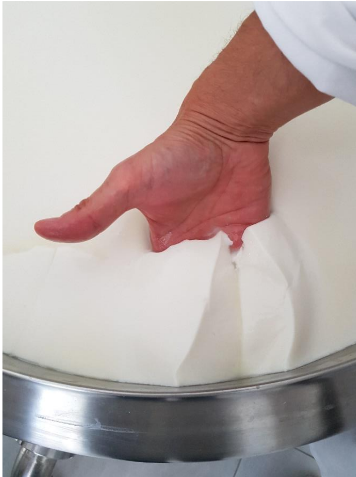
Slika 3.1.3. Provjera čvrstoće gruša i boje sirutke

Sirenje mlijeka završilo je kada je postignuta određena čvrstoća gruša, što je provjereno uranjanjem ruke u grušu i podizanjem gruša, pri čemu on puca, a na mjestu pukotine stjenke gruša su glatke, dok je sirutka bistre zelene-žute boje (Slika 3.1.3.). Sirenje je trajalo 50 - 60 minuta nakon čega je gruša rezan sirarskom harfom (Slika 3.1.4.) do zrna oštih rubova veličine lješnjaka/oraha (Slika 3.1.5.).