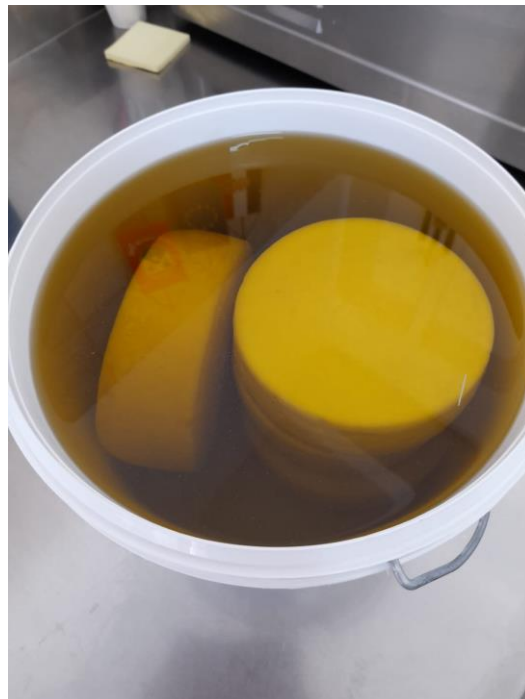
Slika 3.1.13. Zrenje sira u ulju