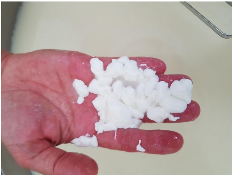
Slika 3.1.5. Sirno zrno