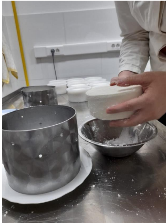
Slika 3.1.10. Soljenje sira

Nakon postizanja navedene pH vrijednosti slijedilo je suho soljenje sireva (s 3,5 % soli), utrljavanjem soli po površini sira (Slika 3.1.10.). Sljedeći dan sirevi su oprani i posloženi na suhu čistu krpu (Slika 3.1.11.).