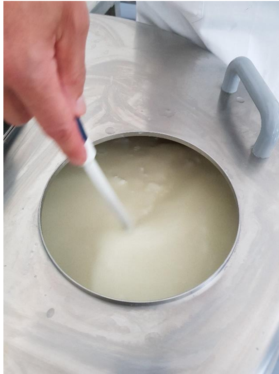
Slika 3.1.6. Sušenje sirnog zrna

Sirno zrno dogrijavalo se do 39° uz stalno miješanje 15 minuta (Slika 3.1.6.). Nakon postizanja temperature 39°C, sirno zrno se sušilo na toj temperaturi 30 minuta uz stalno miješanje. Nakon završetka sušenja sirnog zrna, sadržaj iz sirarskog kotla prebačen je u kalupe s ciljem odvajanja sirutke (Slika 3.1.7.).