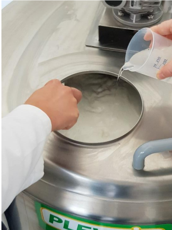
Slika 3.1.2. Dodavanje mljekarskih kultura

U zagrijano (30-31°C), prethodno filtrirano mlijeko (slika 3.1.1.) dodan je lizozim (5 g) koji je prethodno pripremljen otapanjem u 1,5 dcl vode. Nakon 15 minuta dodana je mljekarska kultura (Slika 3.1.2.). 30 minuta nakon dodavanja mljekarske kulture, dodano je prethodno pripremljeno i aktivirano sirilo (4 g sirila otopljeno u 1,5 dcl destilirane vode).