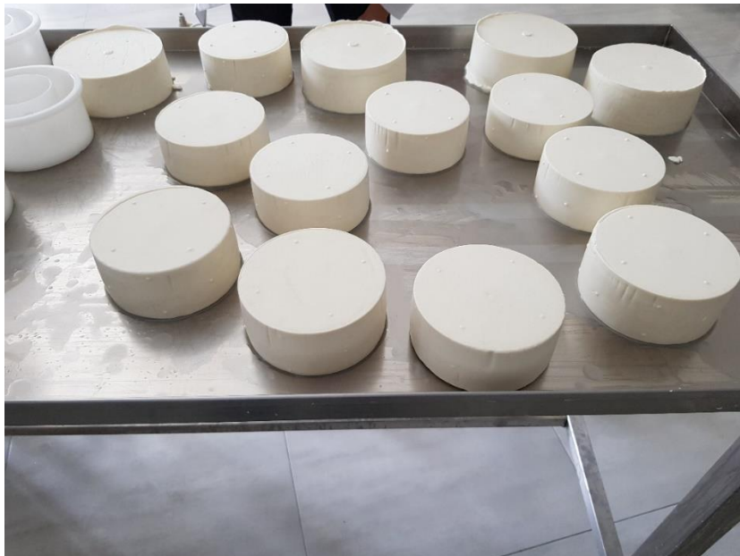
Slika 3.1.9. Sirevi nakon postupka prešanja