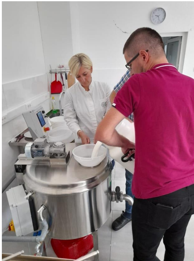
Slika 3.1.1. Odvajanje mehaničkih nečistoća iz kozjeg mlijeka

Za proizvodnju sira koristilo se svježe kozje mlijeko jutarnje i večernje mužnje. Do procesa proizvodnje mlijeko se skladištilo u laktofrizu na 4 °C.