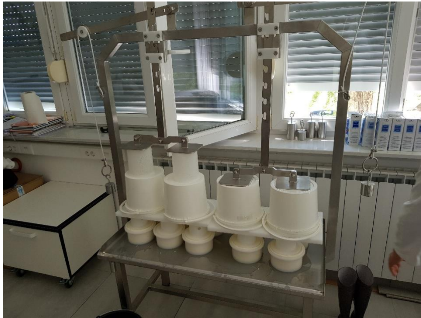
Slika 3.1.8. Prešanje sira