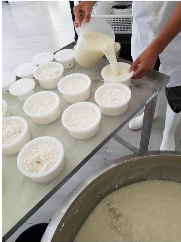
Slika 3.1.7. Prebacivanje sirnog zrna i sirutke u kalupe

Sir je prešan ukupno 2 sata uz okretanje i mijenjanje težine utega: 20 minuta s malim utegom, 30 minuta s velikim utegom, 60 minuta s 2 velika utega, 20 minuta bez mrežice sa malim utegom (Slika 3.1.8.). Nakon prešanja potrebno je okrenuti sireve i pustiti ih u kalupu dok se pH vrijednost ne spusti do 5,4 - 5,5. Slika 3.1.9. prikazuje izgled sireva nakon prešanja.