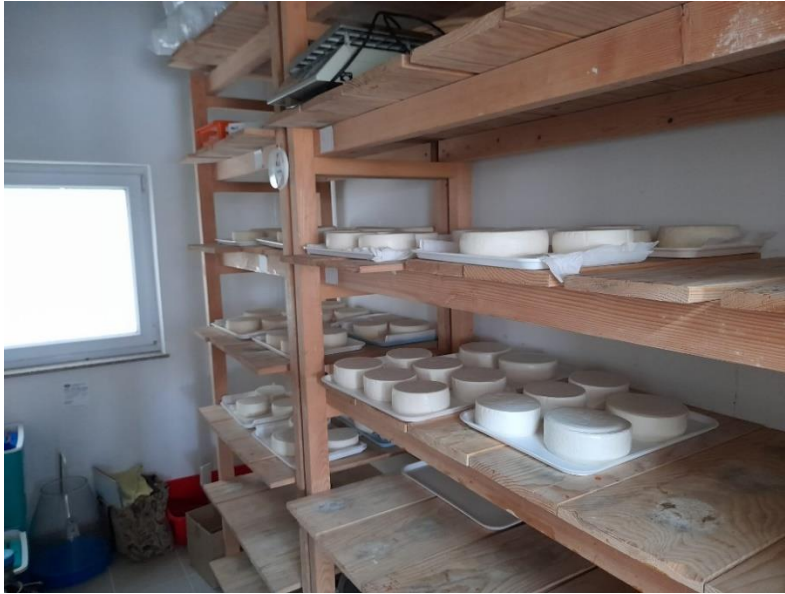
Slika 3.1.12. Zrenje sira na zraku (policama)

Zrenje sira prve grupe sireva, uz njegu sira, trajalo je 60 dana na polici (Slika 3.1.12.), dok se druga skupina nakon 10 dana zrenja na polici položila u mješavinu mljetskog maslinovog i komercijalnog suncokretovog ulja (50:50), te je zrenje u ulju trajalo 50 dana (3.1.13.). Temperatura u zrioni iznosila je 15-17°C, a relativna vlaga zraka 70-80%.