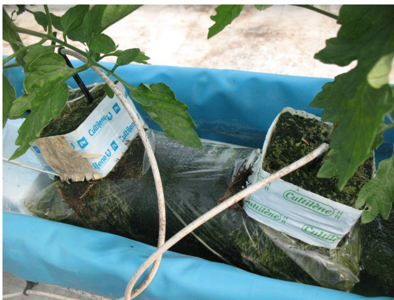
Slika 3. Kocke kamene vune s rajčicom na organskom supstratu

Proizvođač organskog supstrata Herbafertil te miješanog supstrata je domaća tvrtka Herbafarm Magnolija d.o.o. ( http://www.herbafarm-magnolija.hr/ ). Prosječan sastav organskog i miješanog supstrata prema analizi Zavoda za ishranu bilja Agronomskog fakulteta je prikazan u tablici 4. Razlika je u tome što se u miješanom supstratu nalazi i sporo otpuštajuće mineralno gnojivo Osmocote exact 16:9:12+2MgO+ME trajanja 3-4 mjeseca. Biljke su posađene na razmak 120 cm između redova i 33 cm unutar reda, čime je ostvaren sklop od 2,5 biljke po m 2 .