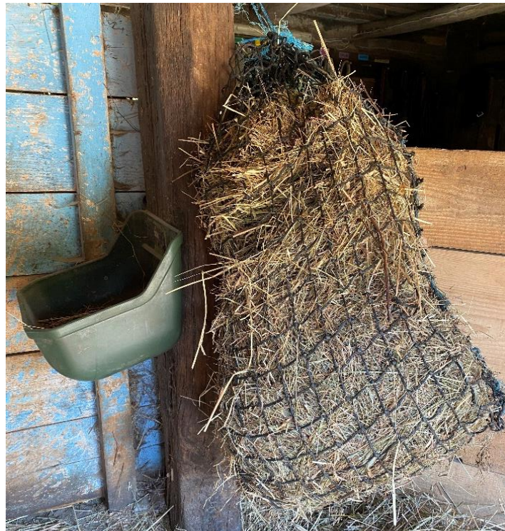
Slika 4.3.2. Prikaz individualne hranidbe sijenom