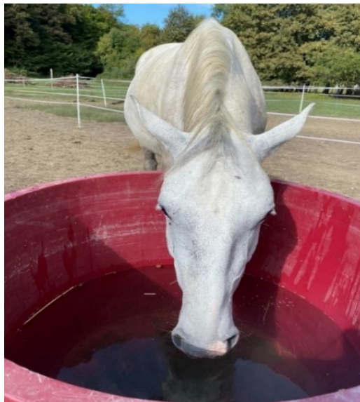
Slika 2.5.1. Tehnika napajanja na ranču „Don Kihot“

Domaćinović i sur. (2015.) navodi da su uzdržne potrebe konja oko 5 L/100 kg TM, dok se u težem radu i laktaciji povećavaju. Ako konj naporno radi, potrebe za vodom mogu se povećati za čak 200 – 300 %. Konzumiranje vode ispod navedene količine može dovesti do dehidracije, gubitka apetita pa čak i do uginuća. Uzimanje vode ovisi o količini pojedene suhe tvari pa se procjenjuje da na svaki kg ST pri štalskom držanju i umjerenom radu konju je potrebno osigurati od 2 do 4 L vode. Također, na potrebe za vodom utječe i temperatura, stoga njeno povišenje uvećava količinu vode na kg ST (5 do 6 L/kg ST) (Šerman 2000.).