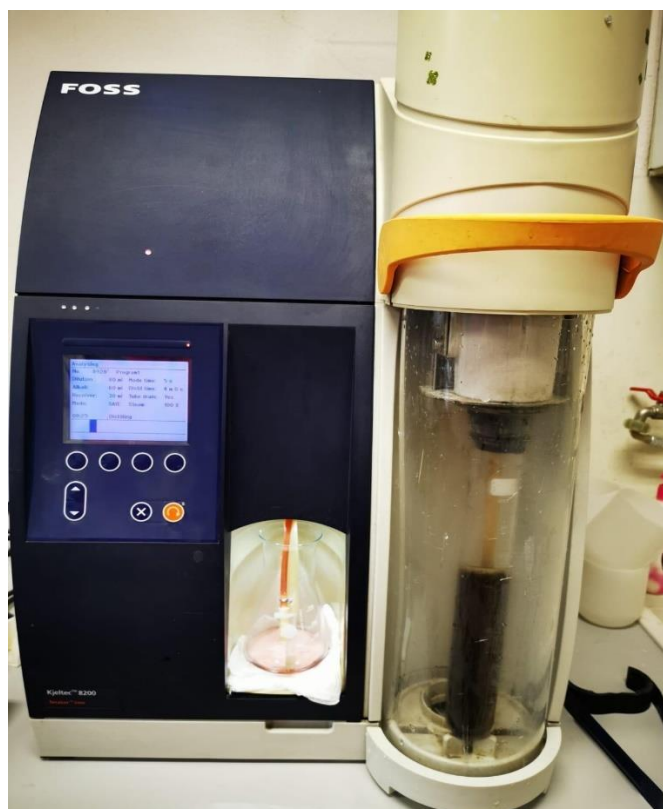
Slika 3.1.4. Destilacija uzorka za analizu sirovih bjelančevina na automatskom destilatoru Kjeltec™ 8200

Sadržaj vlakana, točnije sadržaj neutralnih deterdžent vlakana u uzorcima određen je u skladu s normom HRN ISO 16472:2008 (DZNM, 2008) korištenjem Fibertec™ sustava – aparature za iskuhavanje i hladnu ekstrakciju – Fibertec system 2021 Fiber cap (Foss Tecator, Švedska).