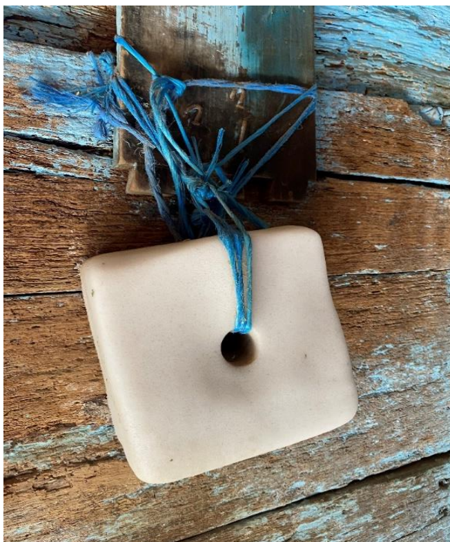
Slika 2.8.1. Mineralni kamen za lizanje

dehidracije životinje. Također, pri intenzivnom radu izlučuju se veće količine želučane kiseline, pada pH, što često dovodi do čira na želudcu, stoga je bitno konje u intenzivnom radu i u stresnim uvjetima izvoditi na pašu. Prije izlaganja radu preporučuje se hranidba pašom u malim količinama. Ukoliko je hranidba bazirana samo na žitaricama smanjuje se dostupnost slobodnih masnih kiselina i povećava unos glukoze u radni mišić, što nije poželjno tijekom dugotrajnog izlaganja radu. S druge strane, sijeno zajedno sa žitaricama dovodi do smanjenja volumena plazme i povećanja tjelesne mase što može loše utjecati na sveukupne performanse konja. U stresnim uvjetima i u radu povećava se i znojenje. Znojenjem organizam gubi važne elektrolite kao što su natrij, kalij i klor, što dovodi do umora i slabosti mišića. Prema Pagan (2005.). konji pri umjerenom radu gube između 5 i 10 L znoja, a time i do 50 g/dan natrija, 83 g/dan klora te 52 g/dan kalija. Gubitci se podmiruju dodatkom soli (Slika 2.8.1.) te je za konje u umjerenom radu potrebno između 60 – 120 g soli/dan.