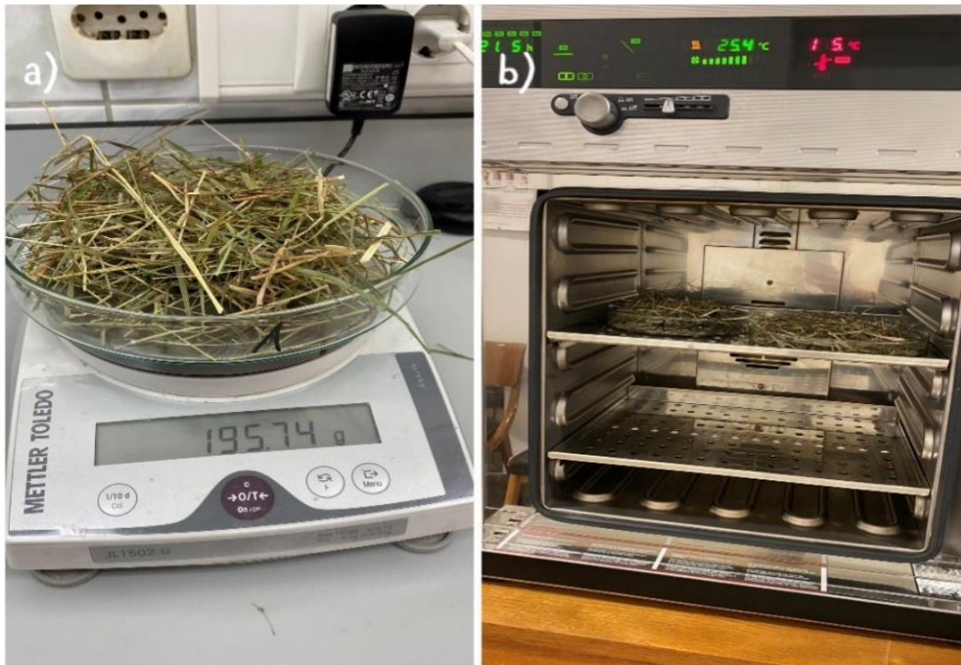
Slika 3.1.2. Vaganje (a) i sušenje (b) sijena za određivanje suhe tvari

Dostavna vlaga zelene mase i sijena određena je metodom HRN ISO 6496:2001 (DZNM 2001.) tako da se izvagalo oko 20 g sijena i zelene mase u paraleli (Slika 3.1.2.,a) te je stavljeno u sušionik na 103 °C kroz 24 sata (Slika 3.1.2.,b). Iz odnosa mase uzorka prije i poslije sušenja izračunat je udio dostavne vlage u uzorku (%). Dostavna suha tvar (ST) izračunata je kao razlika između 100 % i vrijednosti udjela dostavne vlage u uzorku zelene mase i sijena.