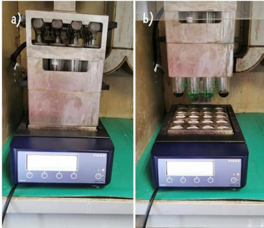
Slika 3.1.3. Spaljivanje uzorka na bloku (a) razgrađeni uzorci prije destilacije (b)

Vrijednost probavljivih bjelančevina (DB) izračunata je na temelju rada Šerman i Mikulec (1995.) za izračun probavljivih bjelančevina za trave i sijena: