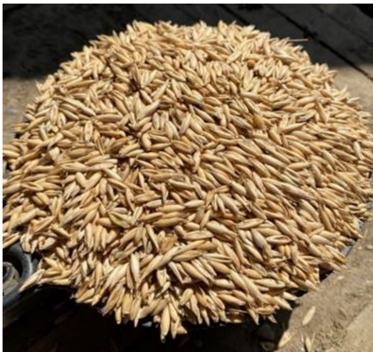
Slika 2.6.2.1. Mjerica zobi

U proteinska krmiva biljnog porijekla ubrajamo zrnje mahunarki, zrnje leguminoza i nusprozvote industrije ulja (pogače i sačme), a u krmiva životinjskog porijekla koja su dozvoljena u hranidbi životinja ubrajamo riblje brašno i obrano mlijeko u prahu. Proteinska krmiva sadrže manje od 18 % sirovih vlakana te više od 20 % sirovih bjelančevina. Od zrnja leguminoza najčešće se koristi soja jer sadrži najveći udio sirovih bjelančevina (35 – 40 %), uz veliki udio sirove masti (15 – 20 %) (Ivanković 2004.). Visoki sadržaj energije imaju pogače i sačme lana koje se često koriste zbog laksativnog učinka, no potrebno ih je davati u manjim količinama kako ne bi uzrokovale probavne tegobe. Osim krmiva biljnog podrijetla u hranidbi konja koristi se i obrano mlijeko u prahu, riblje brašno i svježa kokošja jaja, krmiva koja su sve češći sastojci obroka jer su visokokvalitetan izvor životinjskih bjelančevina (Domaćinović i sur. 2015.). Daju se u malim količinama, najčešće konjima u rekonvalescenciji i pastusima (Šerman 2000.).