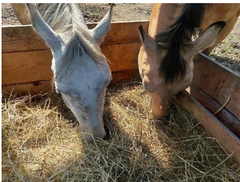
Slika 2.6.1.1. Prikaz konzumacije livadnog sijena u udruzi Don Kihot

Sijeno se može davati i u obliku peleta. Davanje sijena u obliku peleta ima višestruke prednosti kao što su: manje otpada prilikom hranjenja, manji transportni troškovi, manje prašine te lakša razdjela i vaganje. Međutim, vizualno je teško odrediti kakvoću peleta, a može doći i do gušenja ili neželjenih ponašanja kao što su žvakanje drva i mahanje glavom. Iz tog se razloga konjima uz pelete preporuča davanje sijena (0,25 – 0,5 kg/100 kg TM) (Šerman 2000.).