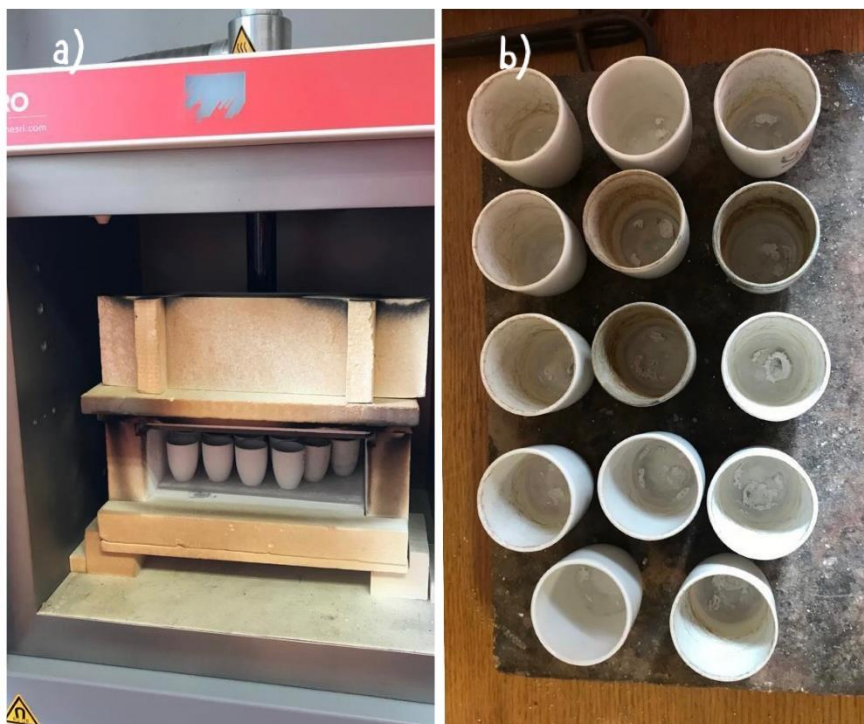
Slika 3.1.5. Analiza NDV s prikazom lončića nakon spaljivanja u mikrovalnoj peći (a) mikrovalna peć s lončićima i kapsulama prije spaljivanja (b)