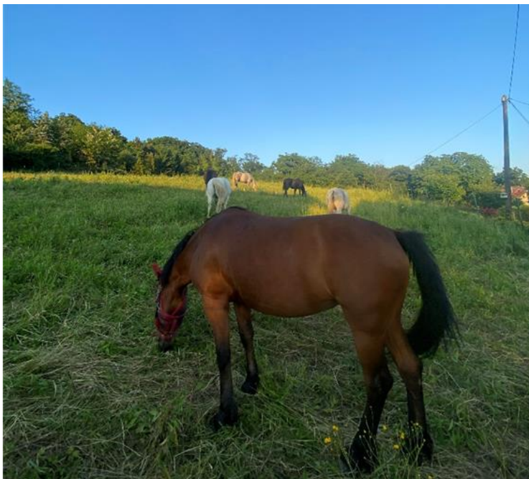
Slika 4.3.1. Prikaz trajnog pašnjaka

Kroz vegetacijski period konji su cijelu noć na ispaši (ako im to vrijeme dopušta) te se ne prihranjuju koncentriranim krmivima. Dok su na pašnjacima, konji imaju stalnu ponudu ispaše, veću od moguće konzumacije, stoga su konzumacija po grlu i mogućnosti biranja veće (Slika 4.3.1.). Konjima je pašni sustav hranidbe poželjan radi njezine izvrsne hranidbene vrijednosti i dobrog utjecaja na zdravlje i kondiciju konja (Šerman 2000.). Poutarad i sur. (2021.) navode da su travnjaci bogati kondenziranim taninima koji imaju anthelmintičko djelovanje protiv nekih gastrointestinalnih nematoda. S druge strane na paši se mogu naći alkaloidi koji su otrovni, stoga je neophodno ukloniti otrovne biljke s pašnjaka. Još jedna od prednosti je veći izbor biljnih vrsta nego na kultiviranim pašnjacima. Tako, Poultarad i sur (2001.) navode da od livadnih trava najveću vrijednost ima engleski ljulj, crvena vlasulja, livadna vlasnjača, liščji repak, klupčasta oštrica, mačji repak te talijanski i francuski ljulj.