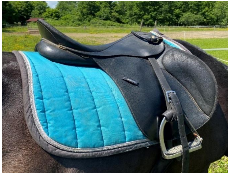
Slika 2.1.2. Englesko sedlo za terapijsko jahanje (vlastiti izvor)

Od sigurnosne opreme obavezna je kaciga, sigurnosni stremeni i ručka za koju se jahač pridržava. Stremeni osiguravaju pravilan položaj stopala tijekom jahanja, dok dodatna površina služi za prijenos težine pa se na taj način povećavaju kretnje u zglobu gležnja. U terapijskom jahanju mogu se koristiti svi tipovi sedala, no najčešće se koriste tri različita tipa engleskog sedla: preponaško, dresurno i višenamjensko. Međutim, pri korištenju opreme nema strogih pravila te se ona prilagođava svakom jahaču (Slika 2.1.2.) (Krpmotić 2003.).