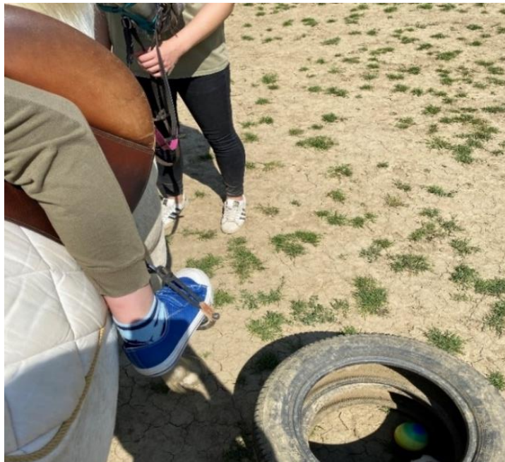
Slika 2.1.1. Izvođenje terapijskog jahanja na ranču „Don Kihot“

Korištenje konja u terapijske svrhe ili terapijsko jahanje podijeljeno je na hipoterapiju, pedagoško jahanje, ergoterapiju, psihoterapiju pomoću konja i sportsko jahanje za osobe s invaliditetom. Različite programe provode specifični profili stručnjaka, stoga hipoterapiju provode licencirani fizioterapeuti, pedagoško jahanje rehabilitatori te stručnjaci sličnog profila, ergoterapiju radni terapeuti, a psihoterapiju pomoću konja psiholozi (Drempetić 2013.). Terapijsko jahanje u svijetu se prepoznaje pod nazivima terapija pomoću konja (Equine Assisted Therapy) i terapija uz konja (Equine Facilitated Therapy). Često dolazi do miješanja pojmova hipoterapije i terapijskog jahanja, stoga je važno objasniti u čemu se razlikuju. Cilj terapijskog jahanja je opuštanje mišića, jačanje slabijih mišića, vježbanje koordinacije, održavanje ravnoteže kao i kroz razne igre poticanje motoričke i kognitivne vještine kod klijenata (Slika 2.1.1.) (Kendall i sur. 2013.).