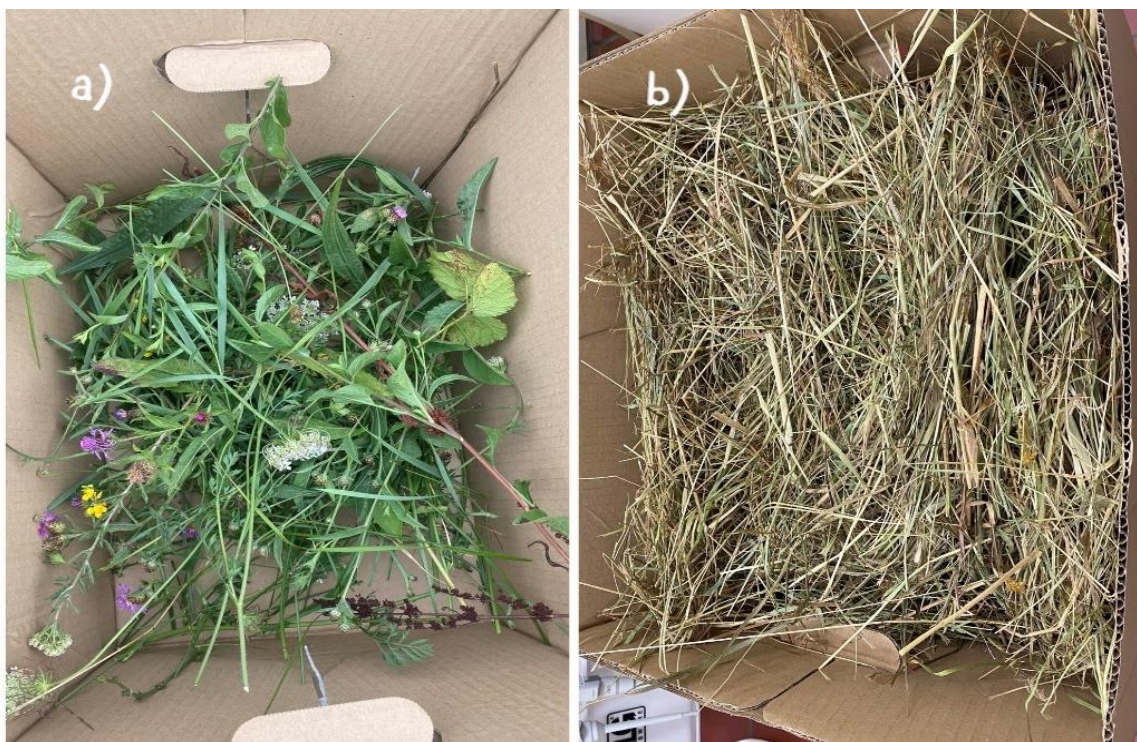
Slika 3.1.1. a) uzorak zelene mase i b) uzorak sijena

Uzorci sijena i zelene mase livade pri dostavi (Slika 3.1.1., a i b) podijeljeni su na dva dijela. Prvi je dio korišten za određivanje dostavne vlage, dok je drugi dio uzorka sijena i zelene mase prosušen sušenjem 24 sata na 40°C i samljeven na mlinu Cyclotec (Tecator, Švedska) sa sitom promjera 1 mm. To je učinjeno kako bi se pripremio laboratorijski uzorak u kojem se odredio sadržaj sirovih bjelančevina i neutralnih deterđent vlakana. Sve analize uzorka sijena i zelene mase livade provedene su u duplikatu, a kao rezultat uzeta je srednja vrijednost.