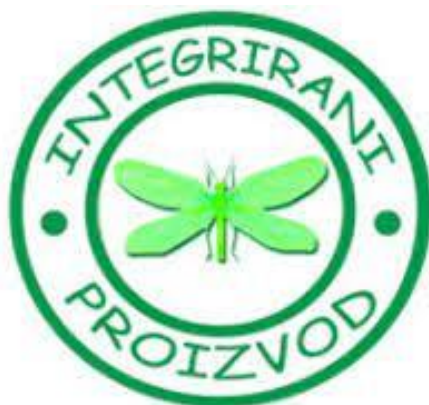
Slika 2. Znak kojim se označava integrirani proizvod