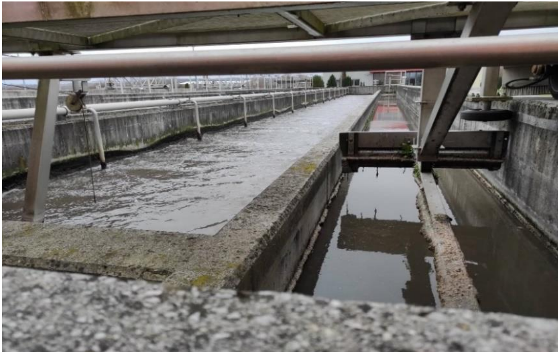
Slika 2.4.1.1. Retencijski bazen

Kupu, a drugi za odvod na UPOV-a. Preljevne mješovite vode iz retencijskog bazena se gravitacijski odvođe pri niskim i srednjim razinama vode u rijeku Kupu, a pri višim razinama se prepumpavaju (UPOV - Interna skripta, 2022).