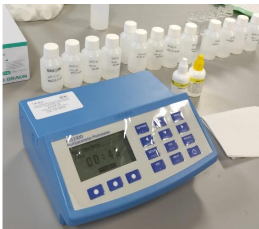
Slika 3.4.2.1. Određivanje koncentracija iona

Za mjerenje koncentracija amonijačnih iona u uzorcima vode iz rijeke Kupe korišten je fotometar s uskopojasnim interferencijskim filterom 420 nm (Hanna Instruments; slika 3.4.2.1) te je korištena D1426 Nesslerova metoda kako je prikazano na slici 3.4.2.2.