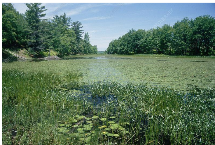
Slika 2.3.2.1. Primjer eutrofikacije jezera Superior u New York-u

Hranjive soli nastaju kao produkti procesa razgradnje organske tvari. Najvažnije soli u otpadnim vodama su dušične i fosforne. Nitrati su kemijski spojevi, soli dušične kiseline, lako topivi u vodi, a koriste se u poljoprivredi, prehrambenoj industriji, proizvodnji lijekova, plastike i boja. Nitrata nalazimo u tlu, hrani i vodi. Biljke korijenom usvajaju dušiku obliku nitrata i amonija iz otopine tla. Nitriti su kemijski spojevi, soli ili esteri dušične kiseline, imaju baktericidno djelovanje pa se koriste u mesnoj i ribljoj industriji. Nitrati su opasni za ljudsko zdravlje jer izravno oštećuju stanične strukture organa i različitih sustava u tijelu (ovisno o koncentraciji). Soli fosforne kiseline nazivaju se fosfati ( \text{PO}_4^{3-} ), hidrogenfosfati ( \text{HPO}_4^{2-} ) i dihidrogenfosfati ( \text{H}_2\text{PO}_4^- ). Fosfati se dijele na ortofosfate ( \text{PO}_3^- -P), organski vezane fosfate i kondenzirane fosfate. Nalazimo ih u raznim vodenim otopinama, akvatičnim organizmima, česticama detritusa. Velika količina spomenutih soli u vodama uzrokuje razvoj algi, planktona jer su one odgovorne za sitnezu bjelančevina. Zbog povećanja koncentracija hranjivih soli u vodenim sustavima akumulacija i jezera (koji imaju slabiju izmjenu vode) može doći do procesa eutrofikacije, prikazanog na slici 2.3.2.1. Možemo reći da dolazi do starenja vodenih sustava i postupnog umiranja životinjskih organizama zbog smanjene količine kisika.