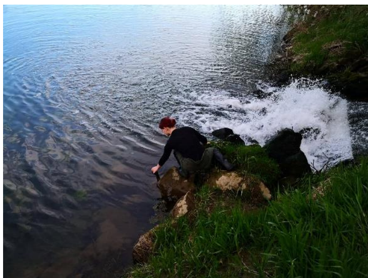
Slika 3.3.4. Uzimanje uzoraka vode iz rijeke Kupe 1 m nizvodno od ispusta uređaja za pročišćavanje otpadnih voda.