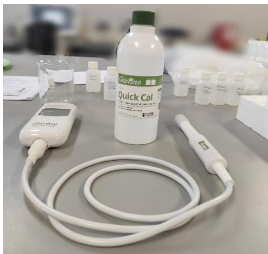
Slika 3.4.1.1. Groline HI9814 (Hanna instruments) uređaj za određivanje vrijednosti pH i električne vodljivosti u uzorcima vode.

Nakon filtracije uzoraka vode iz rijeke Kupe, koristeći uređaj "Groline HI9814" (Hanna instruments) izmjerene su vrijednosti pH i električne vodljivosti (E.C.), kako je prikazano na slici 3.4.1.1.