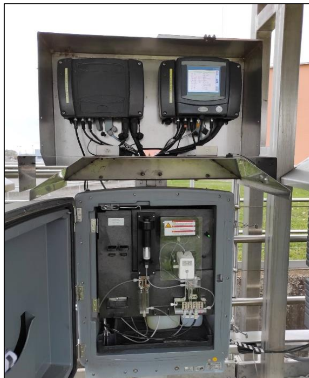
Slika 2.4.2.4. Mjerna stanica

Mjerni kanal i crpna stanica na izlazu pročišćene vode s oknom za mjerenje parametara kakvoće efluenta služe za odvođenje pročišćene otpadne vode prema odvodnom i mjernom kanalu tipa Kafagi – Venturi, kako je prikazano na slici 2.4.2.4. Nakon prijelaza mjernog profila, pročišćena voda se ispušta gravitacijski u rijeku Kupu. U slučaju visokih vodostaja Kupe, neophodno je pumpanje pročišćene vode u rijeku. U tu svrhu, nizvodno od mjerača protoka, predviđena je crpna stanica s crpkama u mokroj izvedbi, tri radne i jednom rezervnom crpkom. U periodima kada rad crpne stanice nije potreban za prolaz pročišćene vode koristi se mimovod. Na početnoj sekciji odvodnog i mjernog kanala predviđena su dva zahvata pročišćene vode. Jedan je za odvod vode ka umjetnom jezeru, koje nije direktno povezano s tehnološkim procesom, a drugi ka crpnoj stanici tehnološke (procesne) vode. Crpna stanica tehnološke (procesne) vode smještena je u pogonskoj građevini digestije mulja i namijenjena opskrbi tehnološkom vodom mreže za pranje opreme (fine rešetke, stanica za prihvata sadržaja iz septičkih jama, oprema za dehidraciju mulja). Odvod pročišćene vode prema umjetnom jezeru regulira se zidnom tablastom zapornicom (UPOV - Interna skripta, 2022).