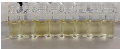
Slika 3.4.2.2. Uzorci vode iz rijeke Kupe s dodanim reagensima i u kivetama nakon očitavanja koncentracija amonijačnih iona na fotometru (Hanna Instruments).