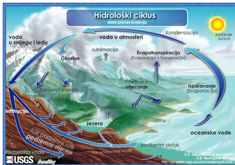
Slika 2.1.1.1. Hidrološki ciklus vode