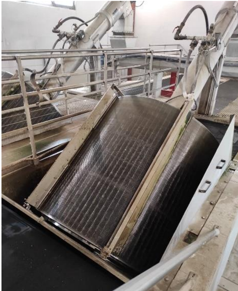
Slika 2.4.1.4. Fina rešetka