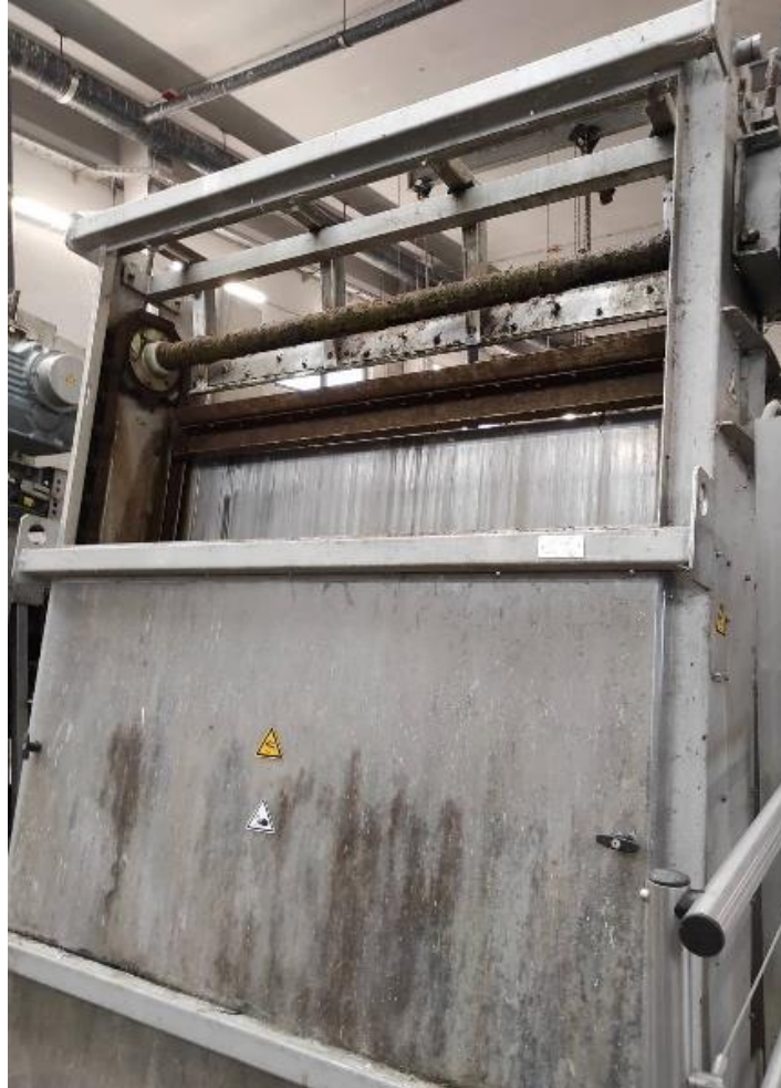
Slika 2.4.1.3. Gruba rešetka