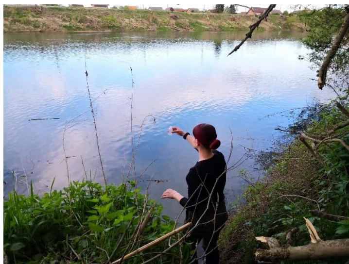
Slika 3.3.2. Uzimanje uzoraka vode iz rijeke Kupe 100 m uzvodno od ispusta uređaja za pročišćavanje otpadnih voda.