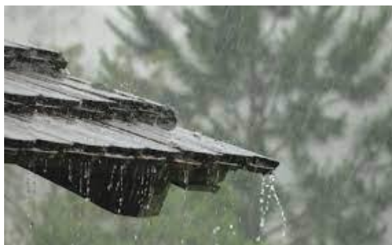
Slika 2.1.1. Kišnica

Atmosferske vode nazivaju se još i padalinske ili oborinske vode (Slika 2.1.1.). Nastaju od svih oborina koje padaju na zemlji (snijeg, kiša, tuča). Vode nastale prolazeći kroz atmosferu sadrže mnoge nečistoće (prašina, krute čestice, različiti mikroorganizmi, aerosoli, plinove koji su apsorbirani iz atmosfere). U industrijaliziranim područjima, zbog ispušnih plinova različitih vozila i ispuštanja tvorničkih plinova događa se onečišćenje atmosferskih voda. Iz tog razloga nastaju velike količine ugljičnog dioksida ( \text{CO}_2 ) koji šteti vodama, ali i ekosustavu u kojem se nalazi. Otopljene minerale ne nalazimo u atmosferskoj vodi pa iz tog razloga ona nema okus (Tušar, 2009).