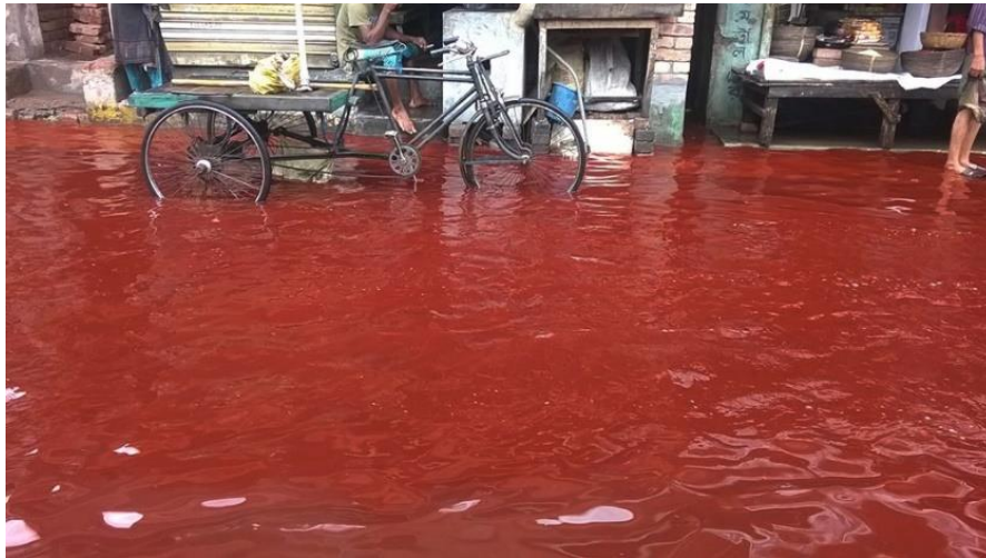
Slika 2.2.1.1. Crvena kiša

(Izvor: https://baartalaap.in/2021/09/08/red-rain-in-kerala-idukki/ ) – pristup 06.06.2022.