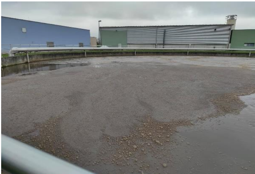
Slika 2.4.2.1 Bioeracijski bazen

U bioeracijskim bazenima se, kako je prikazano na slici 2.4.2.1., odvija biološko pročišćavanje otpadne vode, i to unutar dva paralelna bioeracijska bazena. Pored mehaničkog pročišćavanja, aktivni mulj s bakterijama i jednostaničnim organizmima (kao nosiocima biološkog pročišćavanja) je od iznimne važnosti za učinkovitost pročišćavanja uređaja. Aktivni mulj iz sekundarnog taložnika odvodi se natrag u bioeracijski bazen kao povratni mulj, preko prethodno spomenutih anaerobnih bazena. Aeracijskim sustavom ubacuje se kisik u bioeracijski bazen u cilju opskrbe aerobnih organizama. Organska tvar u otpadnoj vodi je apsorbirana i oksidirana od strane aktivnog mulja ili transformirana u stanice organizama.