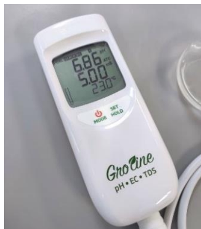
Slika 3.4.1.2. Očitavanje vrijednosti pH i električne vodljivosti (E.C.) u uzorcima vode iz rijeke Kupe na Groline HI9814 (Hanna instruments) uređaju.

Postupak mjerenja pH i električne vodljivosti (E.C.) u uzorcima vode je sljedeći: sonda se uroni u uzrak do točno određene razine, uređaj se stabilizira i nakon nekoliko sekundi očitavaju se dobivene vrijednosti (slika 3.4.1.2.). Nakon svakog očitavanja, sonda se ispiru destiliranom vodom i postupak se ponavlja.