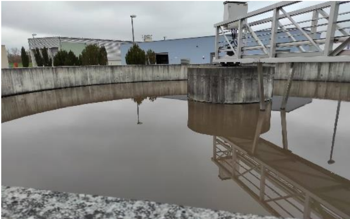
Slika 2.4.1.8. Primarni taložnik