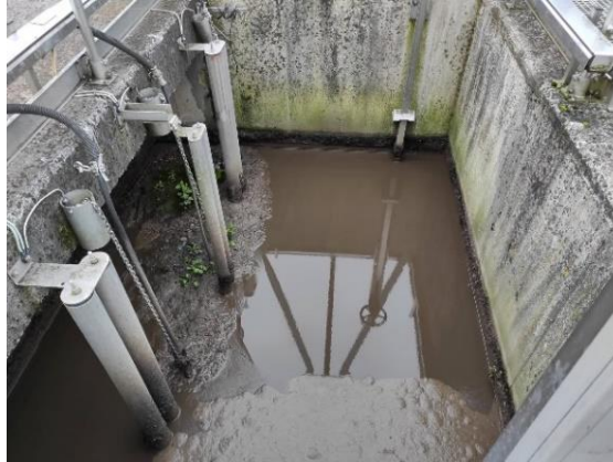
Slika 2.4.2.2 Aeracijski sustav