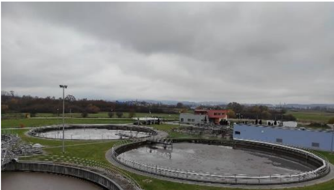
Slika 2.4.2.3. Sekundarni taložnici

U sekundarnim taložnicima, kako je prikazano na slici 2.4.2.3., pročišćena voda se odvaja od aktivnog mulja. Istaloženi mulj se zgrče zgrtačom po dnu bazena u ljevak za mulj. Plivajući mulj se površinskim zgrtačem (montiranim na most zgrtača) odvaja u sabirnu komoru i potom odvodi u malu crpnu stanicu, a putem nje na liniju mulja. Kontinuirano funkcioniranje zgrtača od ključne je važnosti za ispravno funkcioniranje sekundarnog taložnika, što osigurava kontinuirano odstranjivanje mulja iz bazena. Dimenzije bazena su projektirane za proračunsko vrijeme taloženja neophodno za odvajanje čvrstih čestica od fluida. Svaki sekundarni taložnik može biti isključen iz pogona neovisno o drugome u slučaju potrebe za revizijom i održavanjem (UPOV - Interna skripta, 2022).