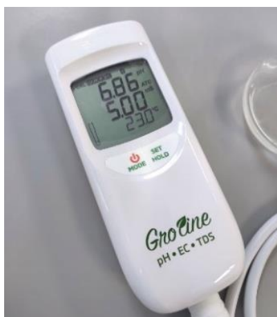
Slika 3.4.1.2. Očitavanje vrijednosti pH i električne vodljivosti (E.C.) u uzorcima vode iz rijeke Kupe na Groline HI9814 (Hanna instruments) uređaju.

Postupak mjerenja pH i električne vodljivosti (E.C.) u uzorcima vode je sljedeći: sonda se uroni u uzrak do točno određene razine, uređaj se stabilizira i nakon nekoliko sekundi očitavaju se dobivene vrijednosti (slika 3.4.1.2.). Nakon svakog očitavanja, sonda se ispiru destiliranom vodom i postupak se ponavlja.