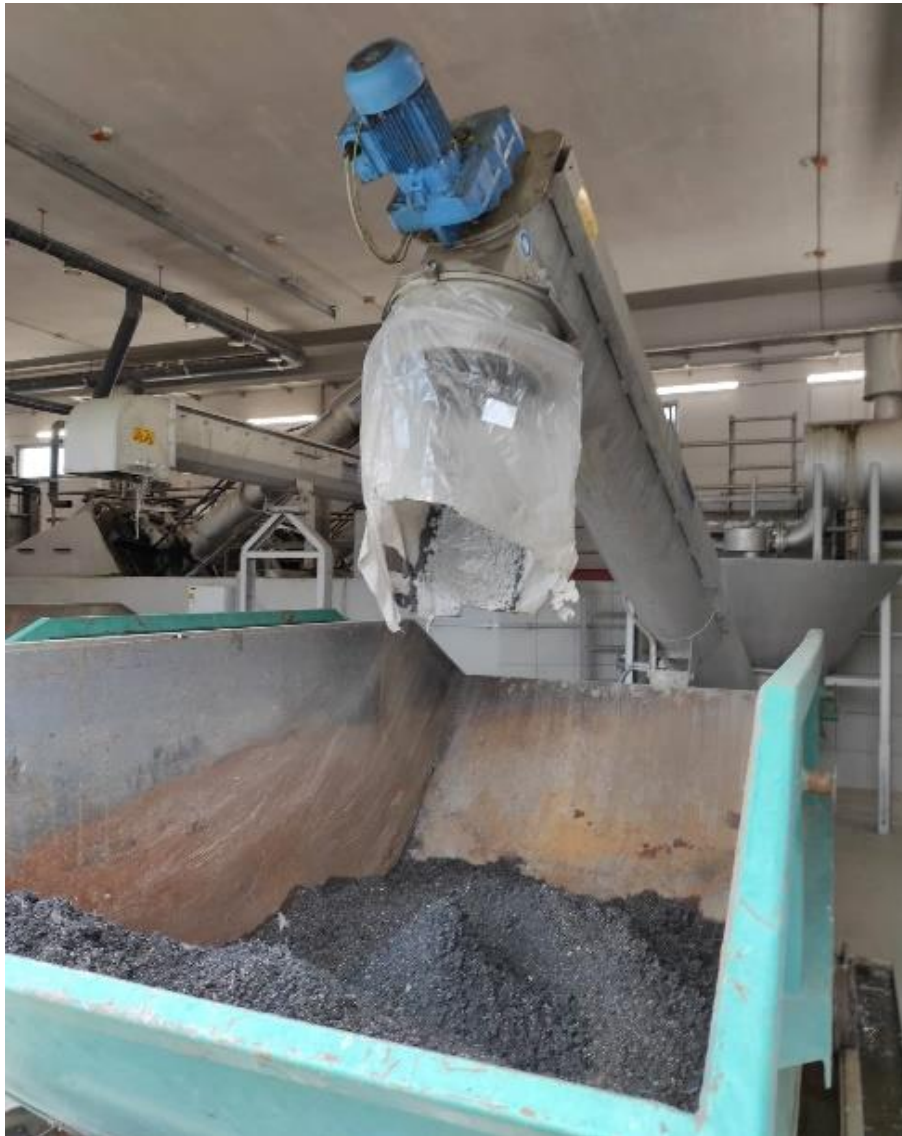
Slika 2.4.1.5. Odvajanje otpada do transportera