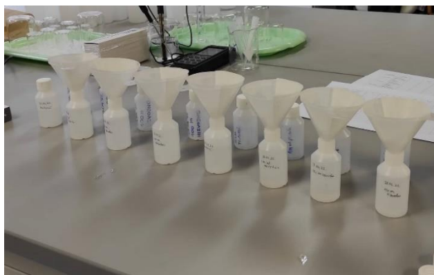
Slika 3.4.1. Filtracija uzoraka vode uzetih iz rijeke Kupe.

Potom je slijedila filtracija uzoraka vode kroz filter papir „color code – bijela“, odnosno takozvana „bijela vrpca“, s karakteristikama zadržavanja čestica veličine 8 - 12 \mu\text{m} i brzine filtracije od 20 sek/100 mL (Slika 3.4.1).