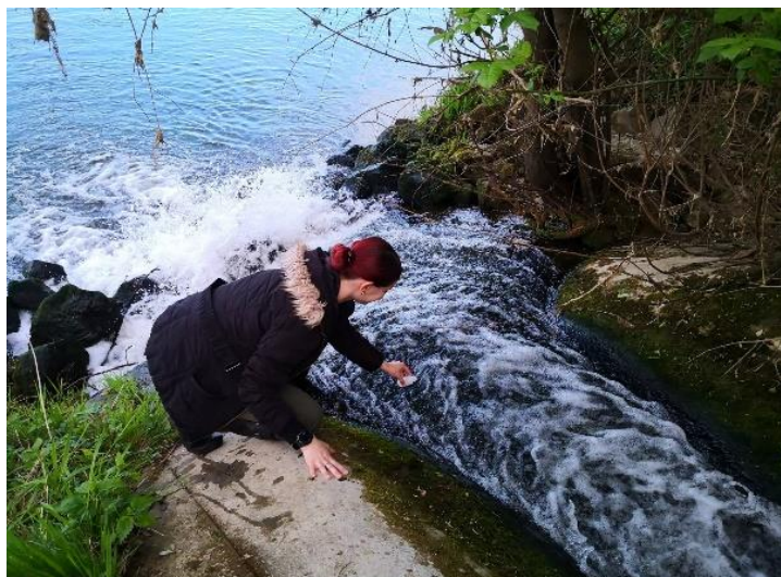
Slika 3.3.3. Uzimanje uzoraka vode iz rijeke Kupe na lokaciji ispusta uređaja za pročišćavanje otpadnih voda.