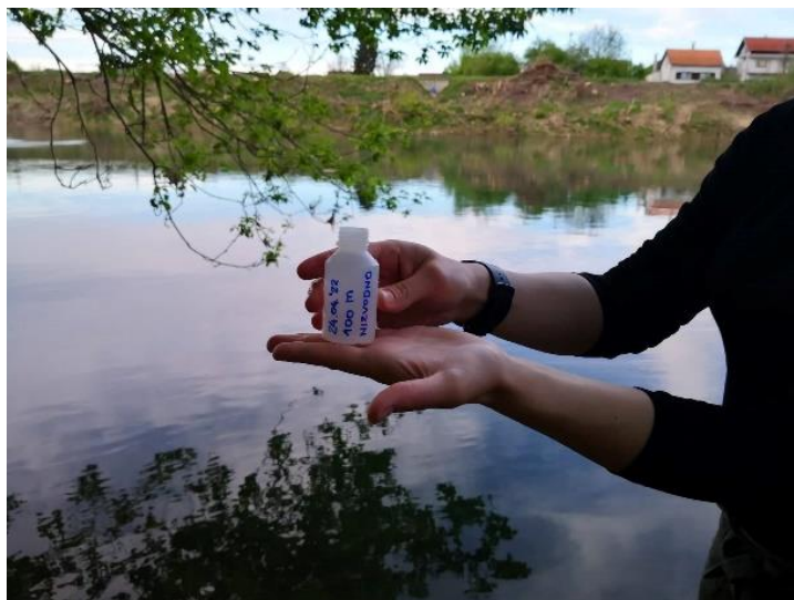
Slika 3.3.5. Uzimanje uzoraka vode iz rijeke Kupe 1 m nizvodno od ispusta uređaja za pročišćavanje otpadnih voda.