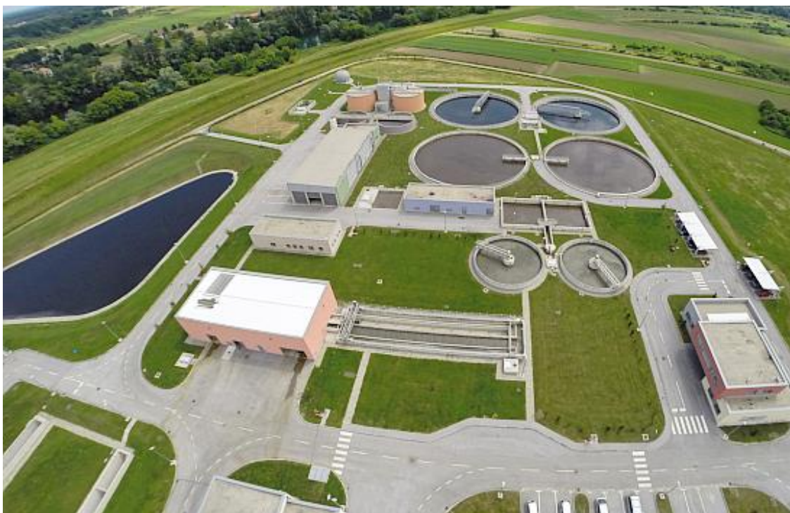
Slika 2.4.1. UPOV iz zraka