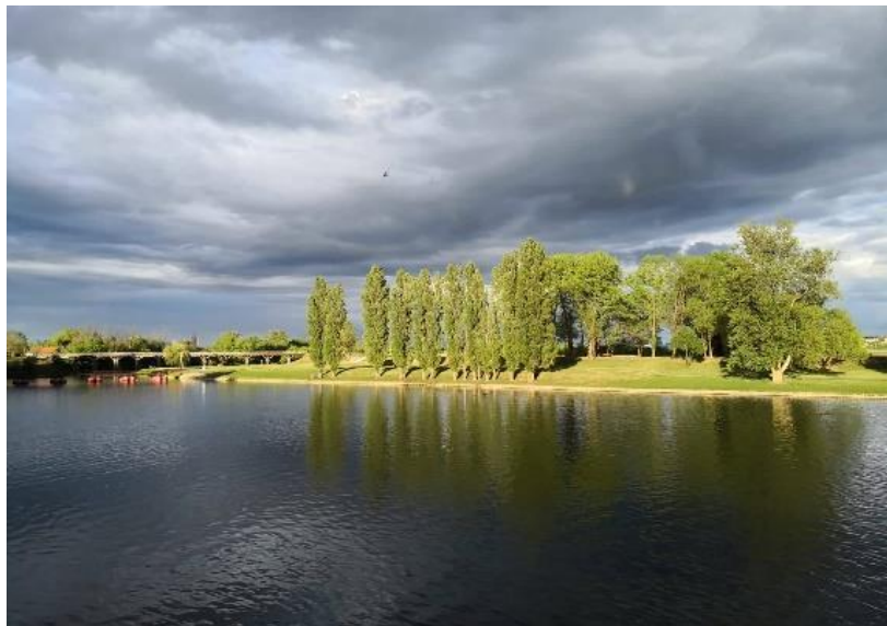
Slika 2.1.3 Rijeka Korana