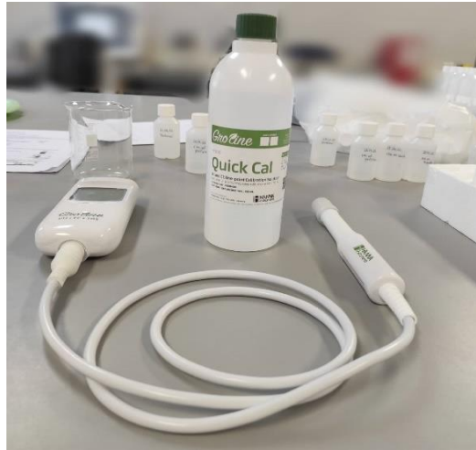
Slika 3.4.1.1. Groline HI9814 (Hanna instruments) uređaj za određivanje vrijednosti pH i električne vodljivosti u uzorcima vode.

Nakon filtracije uzoraka vode iz rijeke Kupe, koristeći uređaj "Groline HI9814" (Hanna instruments) izmjerene su vrijednosti pH i električne vodljivosti (E.C.), kako je prikazano na slici 3.4.1.1.