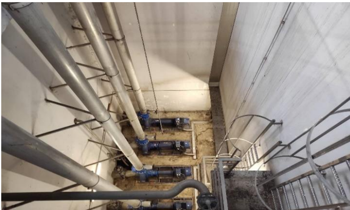
Slika 2.4.1.2. Crpna stanica