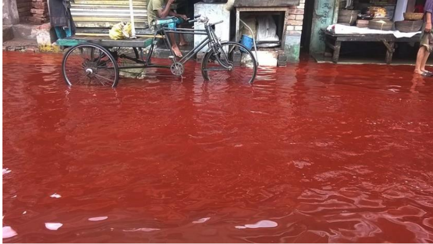
Slika 2.2.1.1. Crvena kiša