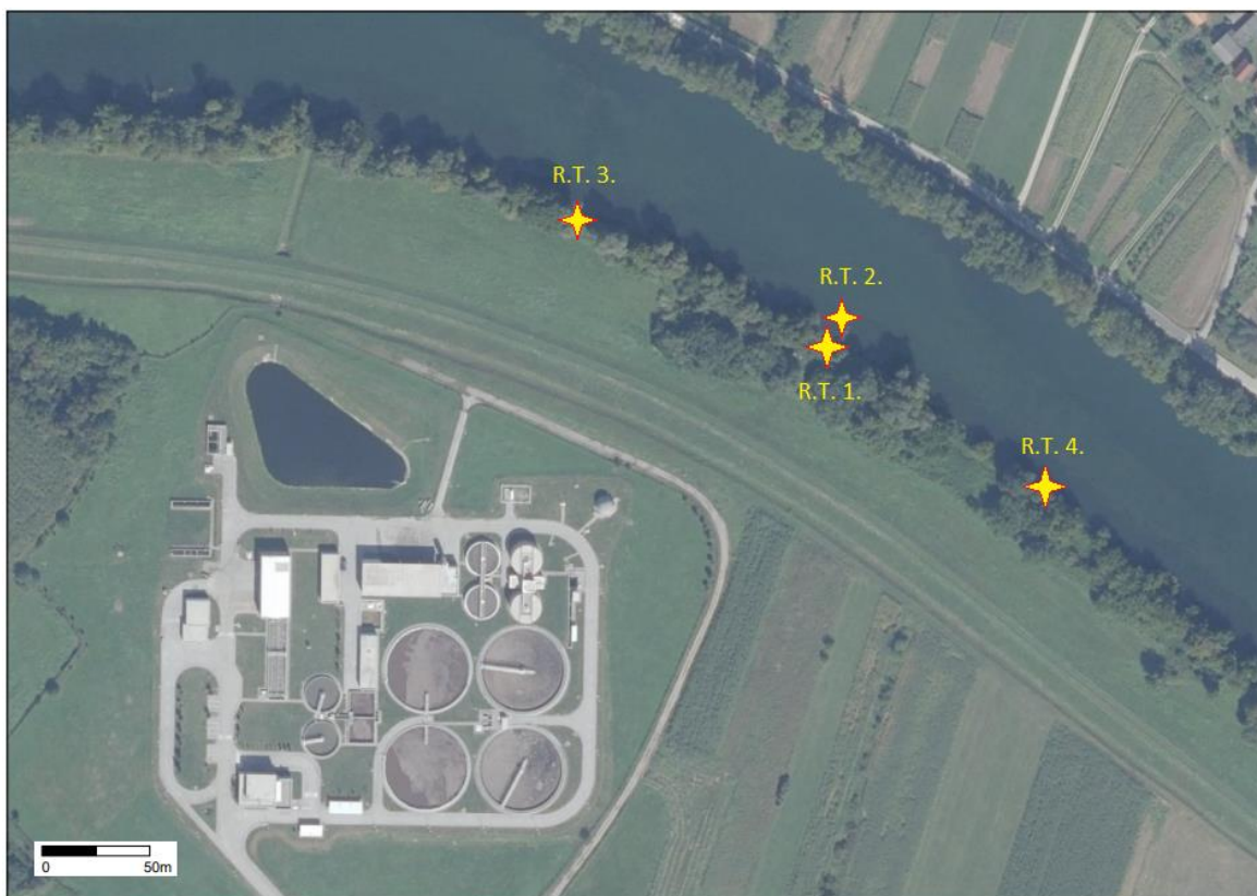
Slika 3.3.1. Lokacije uzorkovanja vode iz Rijeke Kupe gdje: R.T.1. (radna točka 1) prikazuje prikupljanje uzoraka na ispustu uređaja za pročišćavanje otpadnih voda, R.T.2. – 1 m nizvodno od ispusta, R.T.3. – 100 m uzvodno, a R.T.4. – 100 m nizvodno od ispusta uređaja za pročišćavanje otpadnih voda.