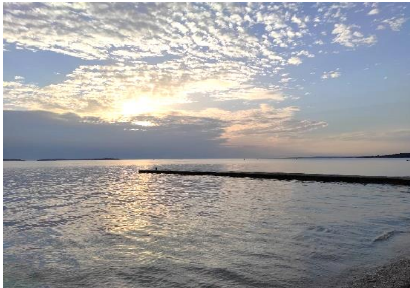
Slika 2.1.2. More-Pula