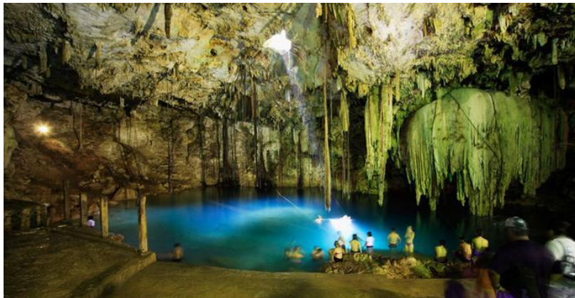
Slika 2.1.4. Podzemna spilja Sac Actun u Mexicu

Vode temeljnice nalaze se na većim dubinama, u vodosnim slojevima (slojevi propusnog materijala) koji se sastoje od kamenja, ilovače, lapora, gline ili smjese svega navedenog. Kreću se puno sporije od pukotinskih kraških voda, kroz vodonosni sloj, što omogućava biološko i mehaničko čišćenje. Postoje tri vrste voda temeljnica, a to su ljekovite, mineralne i arteške vode (Štrkalj, 2014).