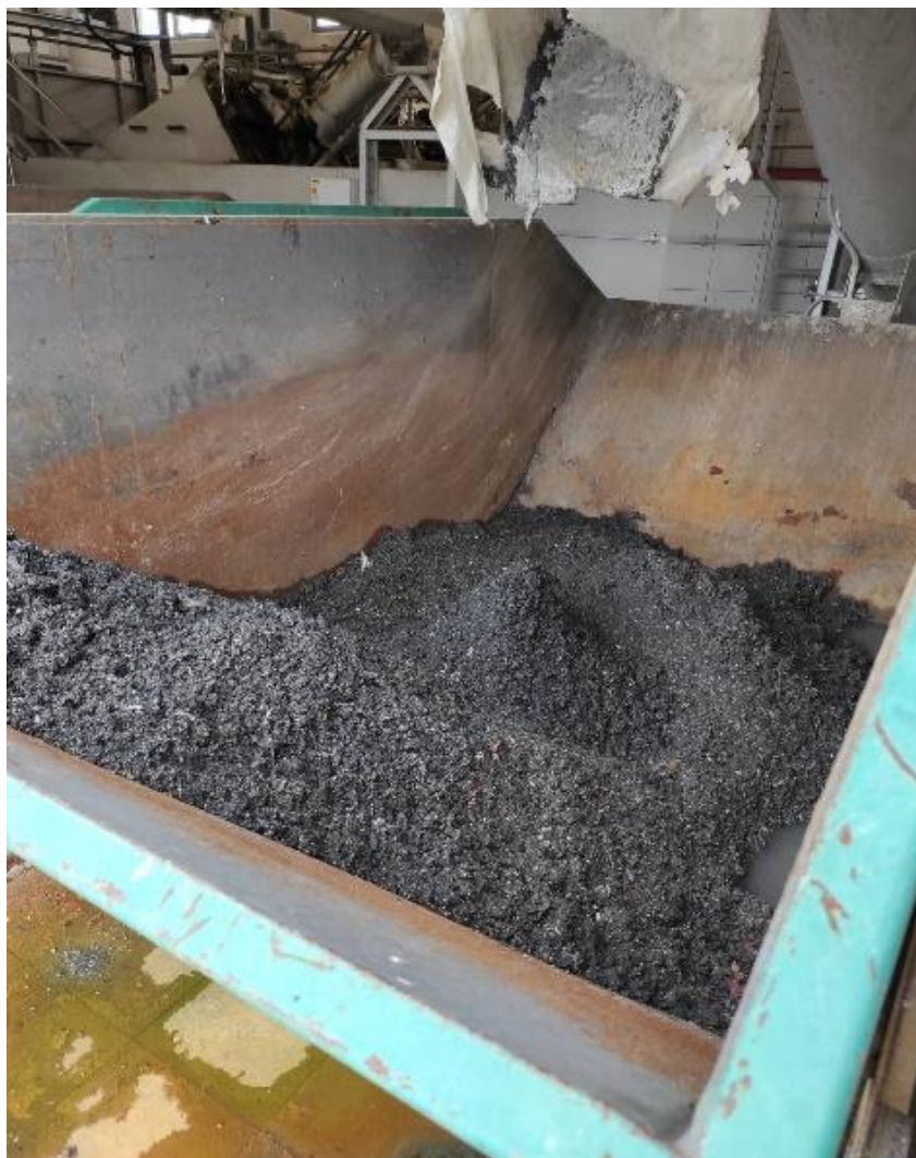
Slika 2.4.1.6. Odvojeni otpad s rešetki