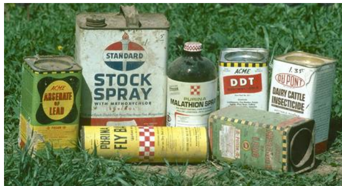
Slika 2.3.5.1. DDT

izravnih šteta pesticida na drugu vrstu, a u nekoj su vrsti interakcije, najčešće putem hranidbenog lanac (Schafer i sur., 2011; Zhao i sur., 2020). Pesticidi koji pripadaju skupini kloriranih ugljikovodika smatraju se najopasnijim pesticidima jer su slabo razgradivi i mogu se akumulirati u adipoznom (masnom) tkivu životinja (Bošnjir i sur., 2007). Primjer je diklor-difenil-trikloretoan (DDT) prikazan na slici 2.3.5.1., čije su posljedice primjene u prošlosti vidljive i danas. Prema Schafer i sur. (2011), DDT je toliko postojan i atmosferski deponiran da je čak zabilježen u polarnim krajevima gdje nikada nije bio korišten. DDT i njegovi metaboliti otporni su na potpunu razgradnju mikroorganizmima. Uporaba DDT-a je ograničena ili zabranjena u većini zemalja, iako, u nekim zemljama se još uvijek koristi (kontrola vektora koji prenose žutu groznicu, tifus, malariju).