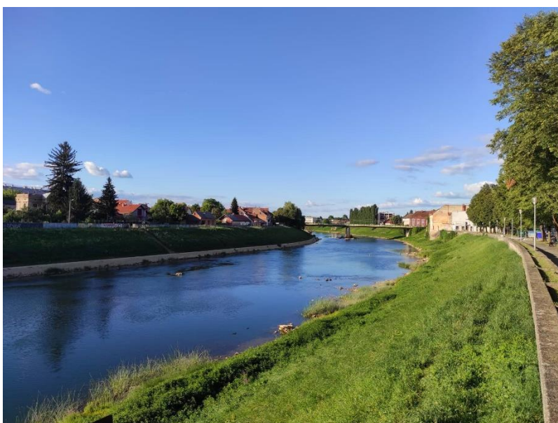
Slika 2.5.1. Rijeka Kupa Fotografirala: Katarina Matan, 2022.

U gradu Karlovcu, rijeka Kupa je od sredine 18. stoljeća imala izniman značaj jer je bila plovna i njome su se prevozili važni resursi. Također, krajem 18. stoljeća grad Karlovac se krenuo snažnije razvijati u gospodarskom smislu, pa je tako lađarstvo na rijeci Kupu obilježilo ovo razdoblje. Kupa je bila važna i za druge gradove poput Ozlja, Petrinje i Siska, a godine 1908. u Ozlju je izgrađena jedna od prvih hidroelektrana upravo na rijeci Kupu, koja danas predstavlja spomenik kulture.