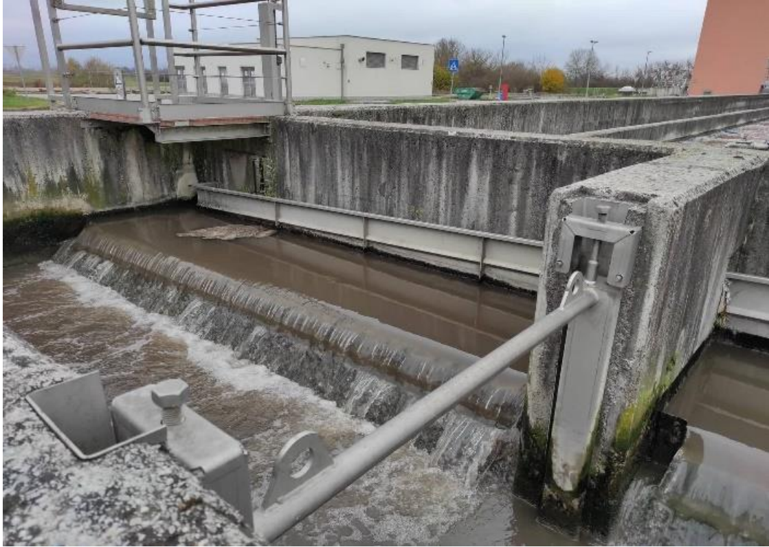
Slika 2.4.1.7. Aerirani pjeskolov-mastolov

klasirer i statičkog cijedenja, transportira pužnim transporterom koji je montiran pod kutom i odlaže se u zasebni kontejner. Klasirer pijeska smješten je u građevini ulazne crpne stanice i rešetki (UPOV - Interna skripta, 2022).