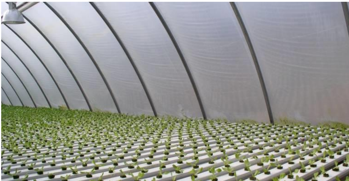
Slika 2.4.1. Hidroponski uzgoj salate u zaštićenom prostoru