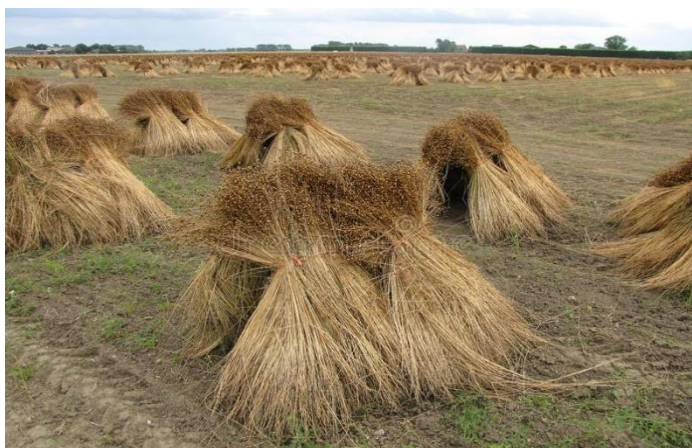
Slika 10. Sušenja lana u zbojevima na polju