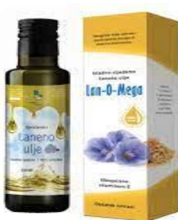
Slika 19. Lan u bočici