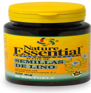
Slika 18. Lan za ljekovite svrhe.

Laneno ulje se u ljekovite svrhe najčešće prodaje u kapsulama (slika 18.). Kapsule se nalaze unutar tamne staklene bočice kako bi se smanjio utjecaj svjetlosti i temperature na svojstva lanenog ulja.