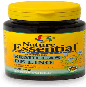
Slika 18. Lan za ljekovite svrhe.

Laneno ulje se u ljekovite svrhe najčešće prodaje u kapsulama (slika 18.). Kapsule se nalaze unutar tamne staklene bočice kako bi se smanjio utjecaj svjetlosti i temperature na svojstva lanenog ulja.