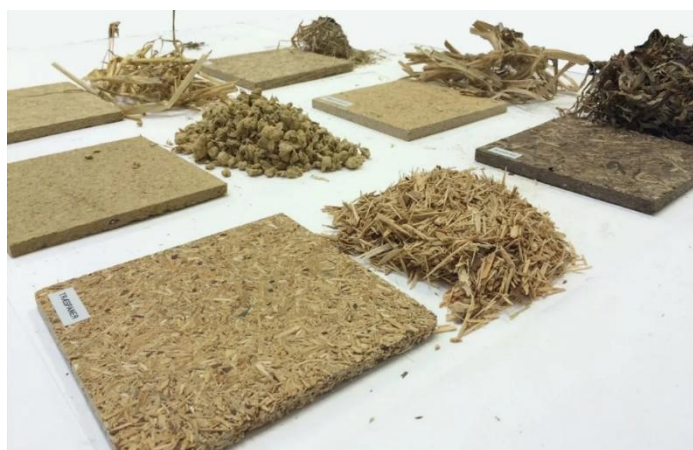
Slika 14. Različite vrste biokompozita.

Prema Konjevod (2018.) u vlaknima ojačanim kompozitima vlakna služe kao ojačala. Vlakno je oblik tvari kod kojeg je poprečni presjek puno manji od duljine. Ta razlika mora biti najmanje 1:100. Vlakna zauzimaju najveći volumni udio VOK-a i nositelji su glavine opterećenja. Vrsta korištenih vlakana, njihova duljina, volumni udio i orijentacija odredit će svojstva kompozita kao što su gustoća VOK-a, vlačna čvrstoća, savojna čvrstoća, modul elastičnosti, zamor materijala, tvrdoća, vodljivost i cijena. Najčešće se koriste vlakna visokih mehaničkih svojstava i finoće kao što su ugljikova, aramidna, staklena, politetrafluoretilenska (PTFE) i druga vlakna, a u novije vrijeme i prirodna vlakna.