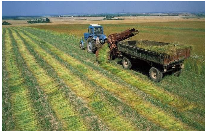
Slika 5. Berba lana nakon čupanja

Počupana masa lana ostaje u zbojevima na tlu 2-4 dana radi sušenja. Osušeni lan se potom mehanizirano veže u snopove ili balira. Postoje i posebno konstruirani podizači zboja počupanog lana (slika 5.), koji podižu zbijenu masu od tla. Osobito nakon kiše, čime se omogućuje bolje prozračivanje i sušenje. Takvi strojevi obično zahvaćaju dva počupana zboja lana, te se tako broj prohoda na tabli smanji u pola, a time i učinak poveća u usporedbi s radom stroja koji okreće zboj (Šimetić, 1995.).