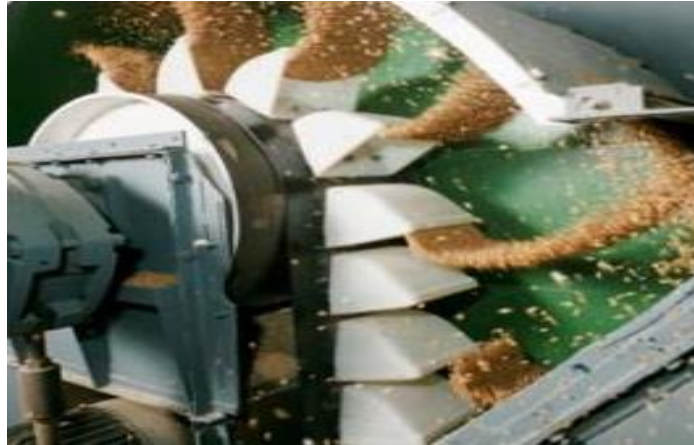
Slika 7. Elevator za sjeme