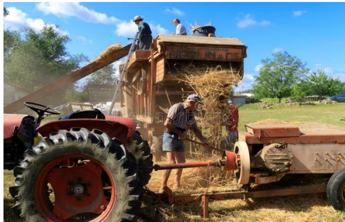
Slika 11. Rad stroja za vršidbu starije izvedbe