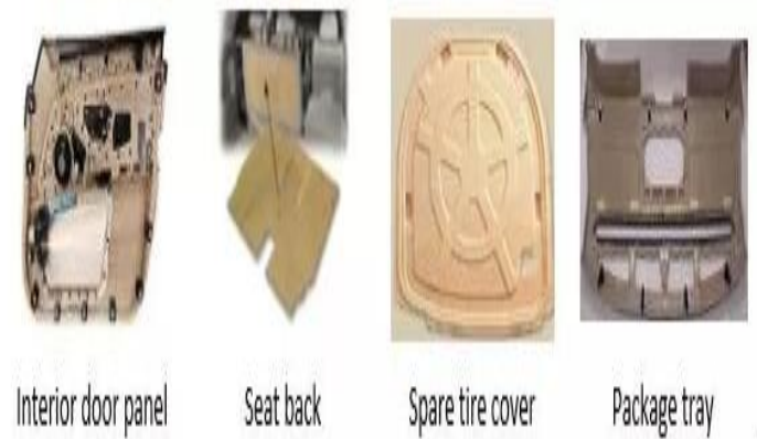
Slika 15. Upotreba biokompozita u autoindustriji.

postupak proizvodnje karoserije komercijalnih automobila manjih serija kao što je Dodge Viper.. Naglasak se stavlja u prvom redu na dobit, ali i na zaštitu okoliša. Stoga se provode brojna istraživanja i sve više raste upotreba biomaterijala u kompozitima (slika 15.). Za modele kod kojih cijena nije ograničavajući faktor upotrebljavaju se kompoziti od epoksidne duromerne matrice i ugljikovih vlakana. Osim razvoja lakših kompozita s boljim mehaničkim svojstvima radi se na razvoju uporabe svih komponenata u kompozitu (Milardović, 2011.).