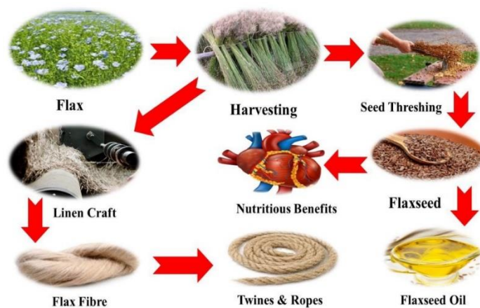
Slika 6. Dodana vrijednost lana

Prerada nakon žetve usmjerena je na očuvanje, preradu i dodavanje vrijednosti materijalu (slika 6.) koji je lakše upotrebljiv i ekonomski isplativ. Tehnologija nakon žetve dobiva na važnosti za povećanje poljoprivredne produktivnosti koja se primjenjuje na poljoprivredne proizvode nakon berbe za njihovu proizvodnju, skladištenje, konzerviranje, preradu, pakiranje, distribuciju i stavljanje u promet. Uključuje sve tretmane ili procese koji se odvijaju od trenutka berbe do krajnjeg proizvoda i samim time do krajnjeg potrošača. Učinkovite tehnike berbe, transporta, rukovanja, skladištenja, prerade/konzerviranja, pakiranja, marketinga i upotrebe komponente su posliježetvene tehnologije koja se odvija nakon žetve (Hasanzuman, 2014.).