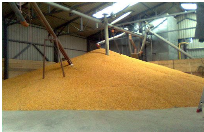
Slika 14. Podno skladište

Hamel (2014.) govori kako kod podnih skladišta (slika 13.) unutarnji zidovi moraju biti zaglađeni jer pore/otvori u zidovima postaju dobro sklonište za skladišne kukce, a veći otvori omogućuju sklanjanje glodavaca. Poželjno je koristiti premaze za zidove i podove koji omogućuju jednostavno održavanje pranjem. Bojenje zidova ili premazivanje vapnom prije unošenja nove sirovine pridonosi boljim uvjetima čuvanja. Budući da su metalni silosi izgrađeni od valovitog lima teško se čiste na unutarnjim stranama gdje se zadržava prašina i ostaci sirovine koja postaju podloga za razvoj i preživljavanje kukaca i gljiva i u praznom skladištu. Zaglađene i premazima zaštićene površine omogućuju lagano održavanje čistoće.