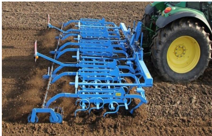
Slika 4. Rad sjetvospremača

Nepovoljno reagira na loše obrađeno tlo. Nakon žetve žitarica obvezno je obaviti prašenje strništa ili plitko oranje do dubine od 12 do 15 cm odnosno do 20 cm. Na proljeće (početak ožujka) prije same sjetve sjetvo spremačem ili rotacijskom drljačom treba se pripremiti sjetveni sloj (slika 4.). Tlo se u površinskom sloju ne smije previše usitniti da se ne bi stvorila pokorica. Postoji negativna korelacija između dubine korijena i visine stabljike, što se rješava plićim oranjem. O kvaliteti pripreme tla ovisit će i kvaliteta sjetve, kao i kvaliteta čupanja lana (rad čupača). Herbicidi su učinkoviti samo na dobro obrađenom tlu (Butorac, 2009).