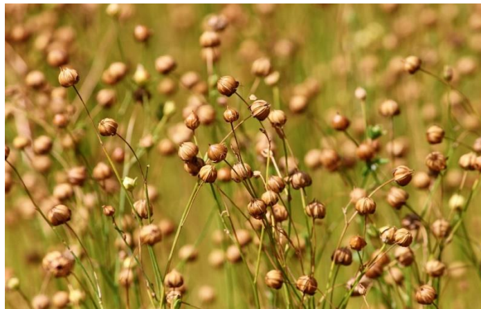
Slika 1. Stabljike lana

Prelazni se lan upotrebljava za vlakno i dobivanje ulja. Naraste do 60 cm i manje se grana od uljanoga lana. Udio vlakna u stabljici prelaznog lana je između 16 i 18%.