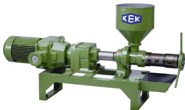
Slika 17. Preša KEK-P0020