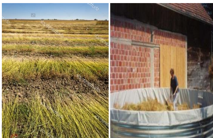
Slika 8. Rošenje lana u polju i močenje lana u bazenima

Kvaliteta vlakana koja su dobivena močenjem općenito je niža u usporedbi s vlaknima dobivenim močenjem u bazenu, ali se troškovi i zagađenje vode značajno smanjuju dok se postiže veći prinos vlakana. Nažalost, učinkovitost ovisi o zemljopisnim uvjetima. Regije s odgovarajućim vlažnim i temperaturnim uvjetima bitne su za dobar rast mikroorganizama. Ovisnost o vremenu prema regijama rezultira varijabilnošću kemijskih i mehaničkih svojstava lanenih vlakana, a time i nedosljednošću kvalitete vlakana, što zahtijeva da industrija lana miješa vlakna kako bi ublažila te varijacije (De Prez i sur., 2018.).