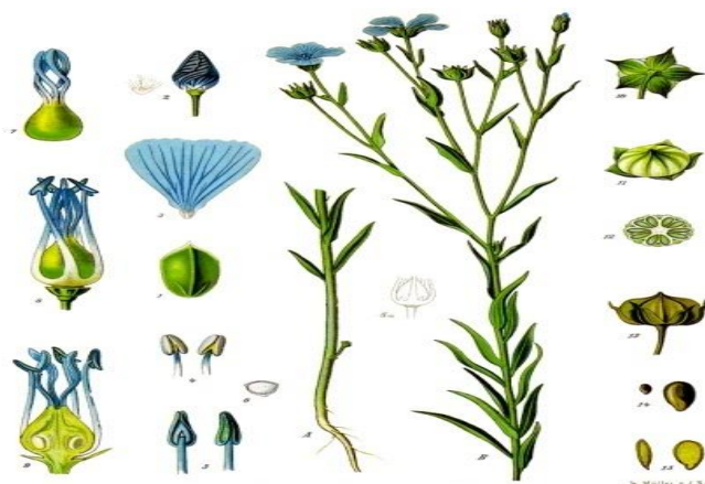
Slika 3. Dijelovi stabljike lana

Plod lana je tobolac najčešće je okruglog oblika, na vrhu zašiljen. Može biti različite veličine. Kod uljnog lana dug je od 8 do 15 mm i širok od 8 do 11 mm, a u predivog lana dužina i širina su mu od 5 do 8 mm. Podijeljen je na pet dijelova, a u svakom bi se dijelu trebale nalaziti dvije sjemenke (Butorac, 2009.).