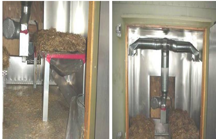
Slika 9. Postupak enzimskog močenja

U tretiranju enzimima (slika 9.) lanene stabljike se presavijaju kako bi se fizički poremetile zaštitne barijere biljke, a zatim se prskaju formulacijom enzima dok se ne namoče ili se nakratko urone. Lan se zatim inkubira na temperaturama optimalnim za aktivnost enzima, opere i osuši. Ispitivanja su pokazala da ova metoda učinkovito utječe na svojstva i količinu lanenih vlakana. Na prinos, čvrstoću i finoću vlakana značajno su utjecale varijacije u količinama enzimatskih kelatora (Akin i sur. 2003.).