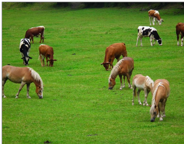
Slika 2.1. Konji na paši s govedima

(Slika 2.1.). Životinje pasu u odvojenim skupinama i međusobno se ne uznemiravaju. Najpovoljniji odnos broja konja spram broja goveda je 1:1-3. Zajedničko napasivanje konja i ovaca također je prisutno jer ove dvije vrste nisu konkurencija jedna drugoj u pogledu hranidbe (Dobranić 2009.).