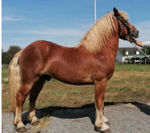
Slika 2.2. Hrvatski posavac

prirode Lonjsko polje i na području Slovenije (u području sliva rijeke Save). Danas je veći dio uzgoja namijenjen proizvodnji mlade ždrijebadi za tržište Italije. Prema zadnjim podacima Hrvatske agencije za poljoprivredu i hranu (2020.) u Hrvatskoj je evidentirano 5.856 grla pasmine hrvatski posavac.