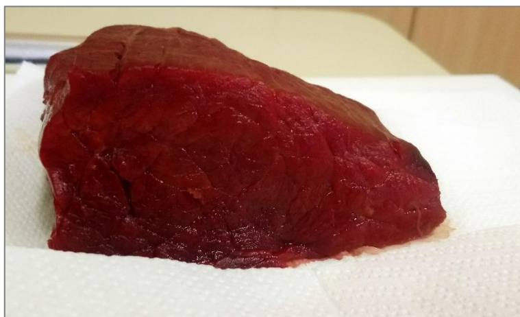
Slika 4.1. Rez mesa konja

Jedno od najupečatljivijih svojstava konjskog mesa je tamno crvena boja, bez masnog tkiva (Slika 4.1.). Meso je bogato mioglobinom koji u reakciji s kisikom smanjuje stabilnost crvene boje svježeg mesa te svijetlo crveni oksimioglobin prelazi u smeđi metmioglobin (Badiani i Manfredini 1994.). Boja mesa ovisi o mnogim čimbenicima od kojih su najvažniji: dob jedinke, temperament, spol i anatomska pozicioniranost mišića. Boja mesa ždrijebadi nježne je ružičaste boje zbog niskog sadržaja željeza, dok mladi konji u dobi od 18 mjeseci imaju meso bogato mioglobinom te je ono tamnije boje.