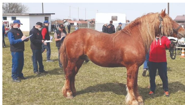
Slika: 2.3 Hrvatski hladokrvnjak

U Hrvatskoj je 2020. godine evidentirano 8.058 grla pasmine hrvatski hladnokrvnjak (HAPIH 2020.).