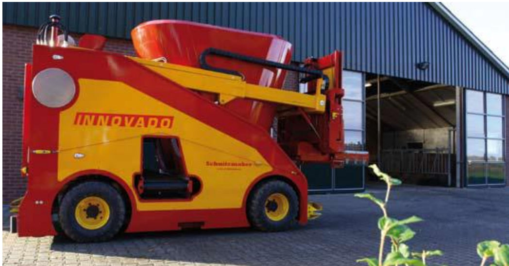
Slika 4.21. Robotizirani stroj Schuitmaker Innovado

Komunikacija sa strojem se može ostvarivati i bežično. Prilagođavanja obroka te vaganje silaže odvija se preko računala. Prilikom kretanja stroja kroz staju laseri prepoznaju prepreke ako se nalaze na putu njegovog kretanja. Ako se ljudi ili životinje približe stroju, on se automatski zaustavlja. Laser nakon nekoliko sekundi provjerava okruženje te ako je i dalje ometano, odmah šalje signal poljoprivredniku kako bi se prepreka otklonila. Osim lasera stroj je opremljen i gumbom za potpuno zaustavljanje koje se može upotrijebiti u bilo kojem trenutku.