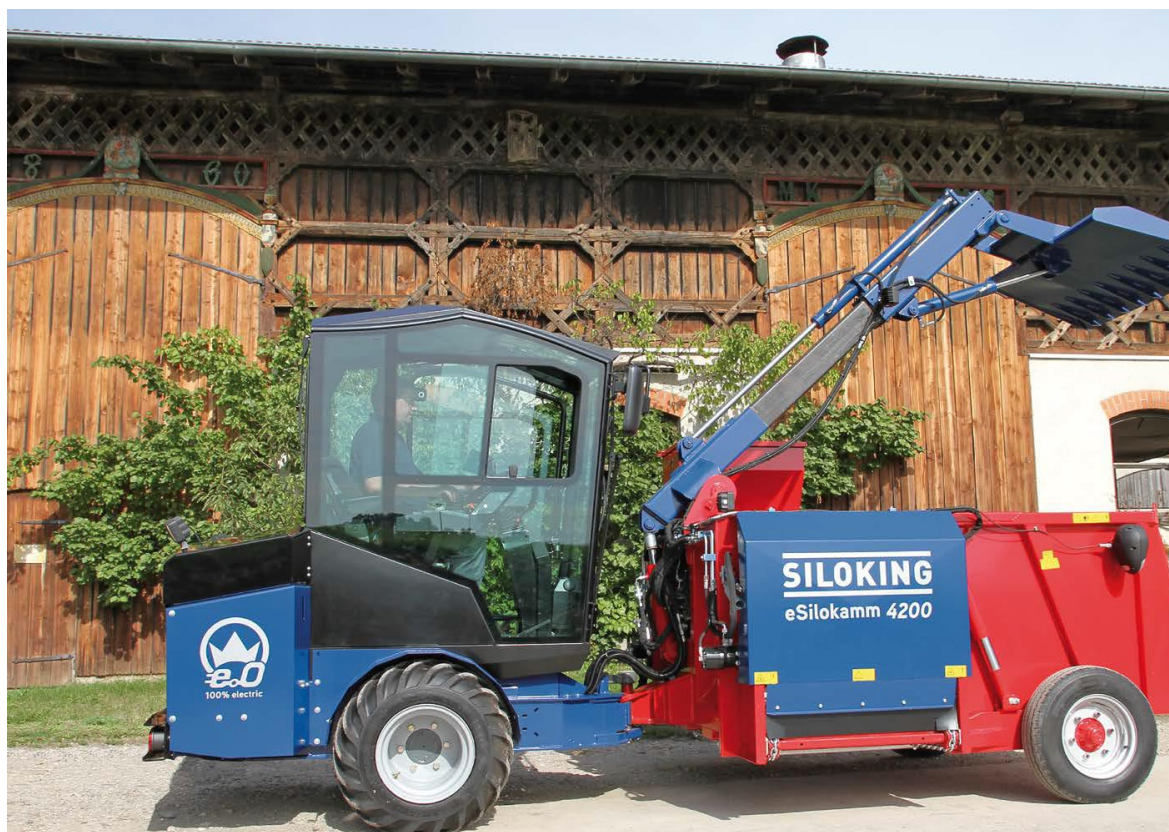
Slika 4.25. Električni samokretni stroj Siloking E-Silokamm 4200