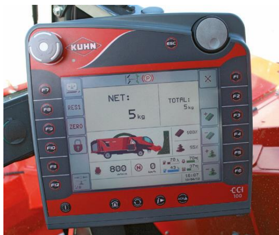
Slika 4.8. Zaslون samokretnog stroja za izuzimanje, miješanje i raspodjelu silaže Kuhn

Nizozemska tvrtka Trioliet ima u ponudi nudi već duže vrijeme samokretne strojeve za izuzimanje, miješanje i raspodjelu silaže. Novi model ovog proizvođača “Triotrac” dolazi u izradi s teleskopskom glodalicom koja omogućava izuzimanje silaže do 6 metara visine, a zahvat glodalice iznosi 1,85 metara. Zbog teleskopske glodalice i bolje preglednosti vozača, kabina je podesiva po visini, za razliku od drugih proizvođača kod kojih je fiksna. Unutar kabine ima prikaz kamere za vožnju unatrag. Triotrac-ov sustav za izuzimanje može se koristiti za izuzimanje skladištene silaže kao i za valjkaste ili četvrtaste bale. Spremnik za miješanje ovog proizvođača je zapremine 10 m 3 do 24 m 3 te se u njemu nalaze dvije vertikalne pužnice pogonjene hidrauličim motorom i promjenjive brzine. Pražnjenje je moguće obaviti na prednjem ili stražnjem dijelu spremnika na bočnoj strani.