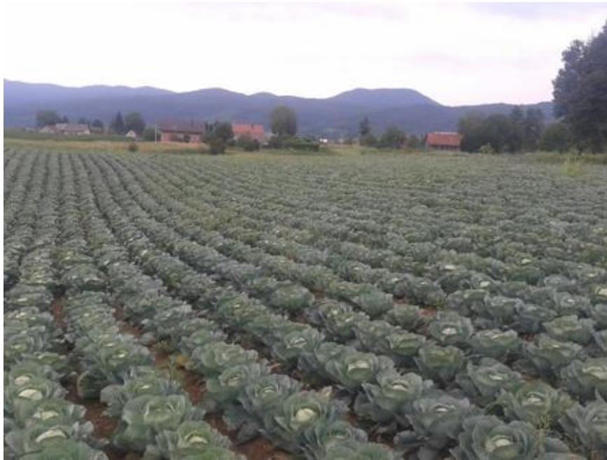
Slika 2.2. Polje 'Ogulinskog' kupusa u Ogulinu

tom području očuvalo tradiciju uzgoja. Tradiciju uzgoja se očuvala zahvaljujući 70-tak proizvođača vrlo kvalitetnog sjemena sorte kupusa 'Ogulinski' (Kosanić, 2008).