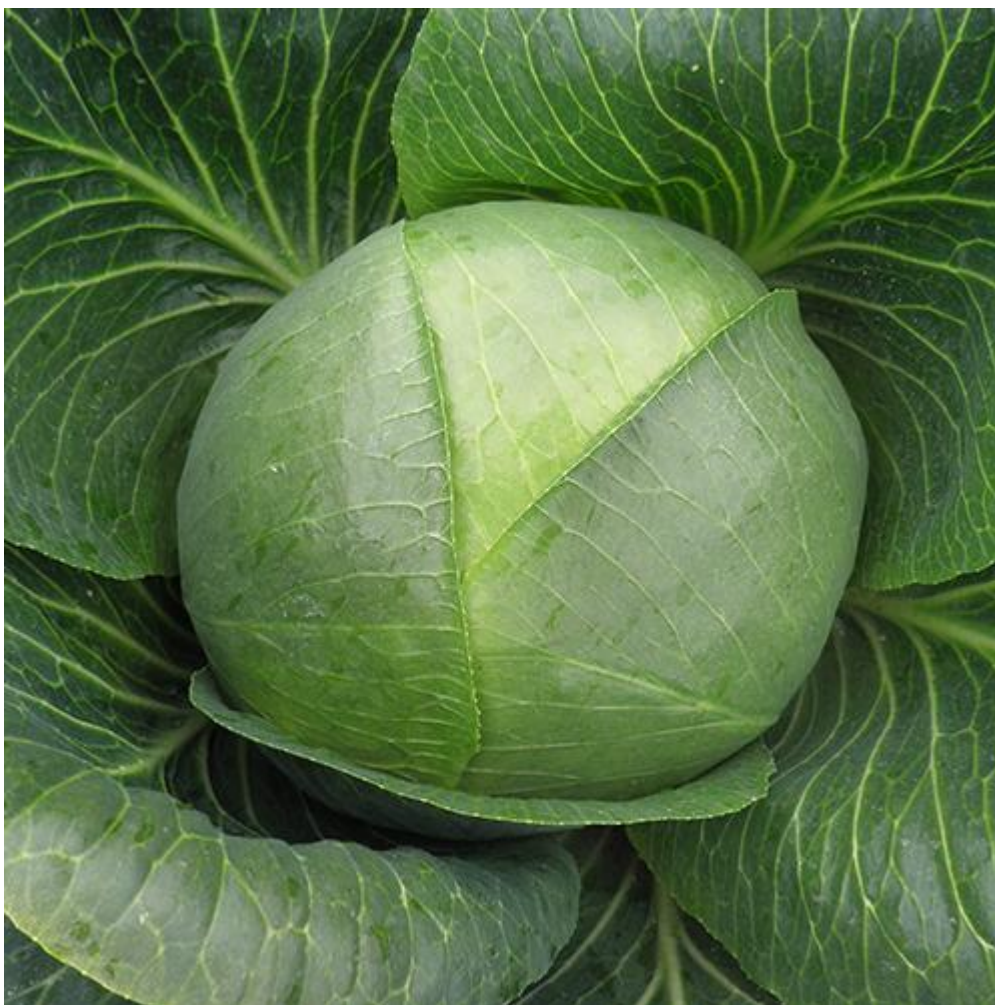
Slika 2.1. 'Varaždinski' kupus (Glavica)

Preuzeto sa web stranice gospodarski list https://gospodarski.hr/rubrike/agroekonomika/kupus-proizvodnja-i-prerada/ - pristup 6.11.2020.