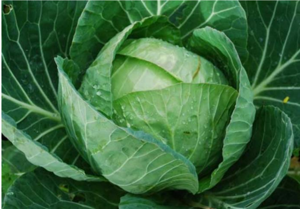
Slika 2.3. Čepinski kupus (glavica)