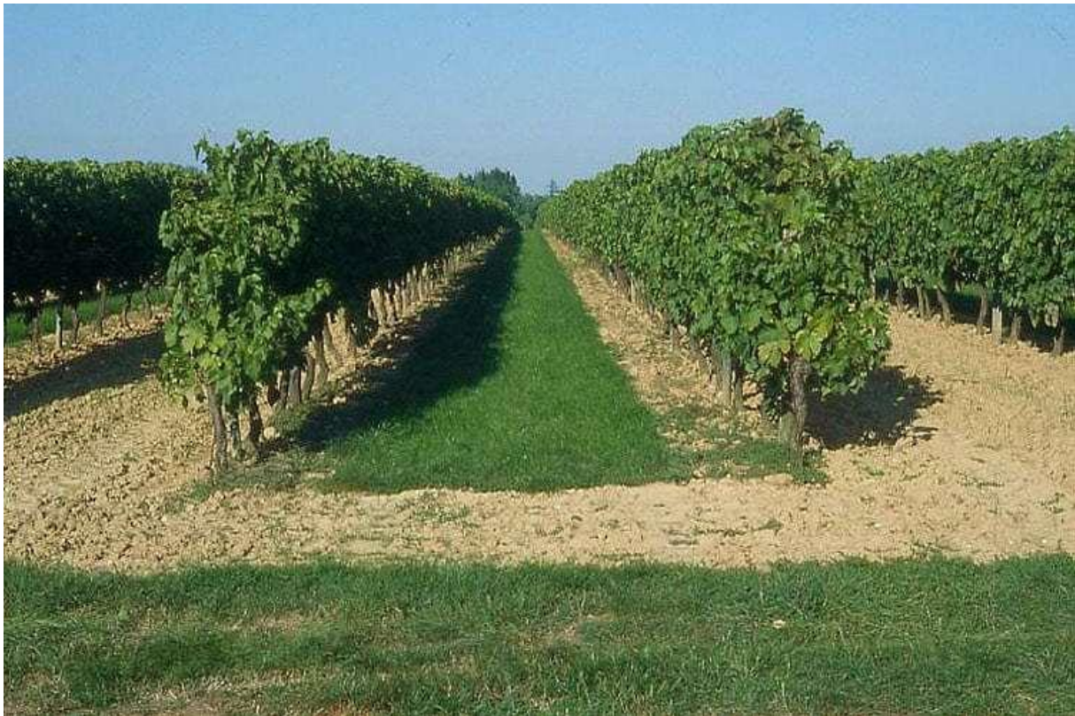
Slika 2.1.2. Zatravljanje vinograda