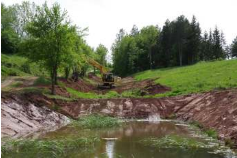
Slika 9 Ravnanje donjeg dijela terena