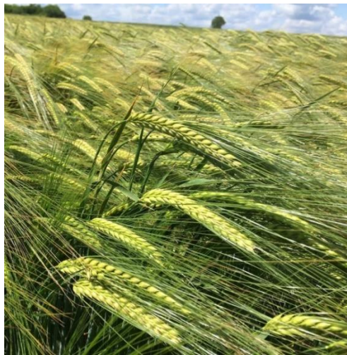
Slika 7. Sorta pivarskog ječma Quench

Istraživanje se provodilo na Sveučilištu u Zagrebu Agronomskom fakultetu u Zavodu za poljoprivrednu tehnologiju, skladištenje i transport. U istraživanju su se koristile dvije jare sorte pivarskog ječma (Quench i Planet) i tri ozime sorte pivarskog ječma (Lukas, Casanova i Teppe) (slike od 7. do 11.). Uzorci su uzimani odmah nakon žetve kombajnom slučajnim odabirom.