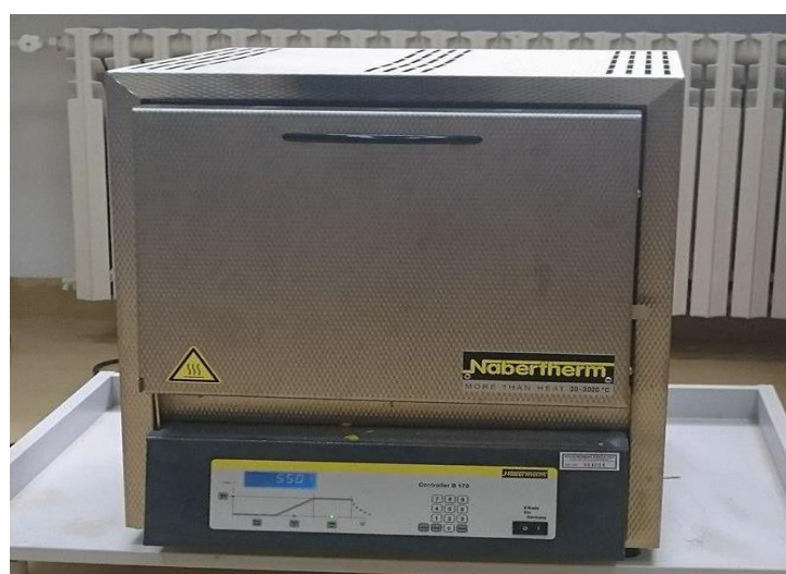
Slika 13. Mufolna pećnica

Pepeo se određuje prema protokolu (CEN/TS 14775:2004) spaljivanjem uzorka u mufolnoj peći. U prethodno izvaganu porculansku posudicu se odvaži oko 2 g uzorka i uzorak se stavlja u peć na temperaturu od 550°C na 6 sati. Za vrijeme spaljivanja u peći sagorijevaju organske tvari iz uzorka, a u porculanskoj posudici zaostaje pepeo koji se važe (slika 13.).