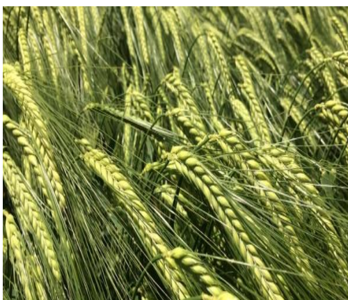
Slika 11. Sorta pivarskog ječma Teppe