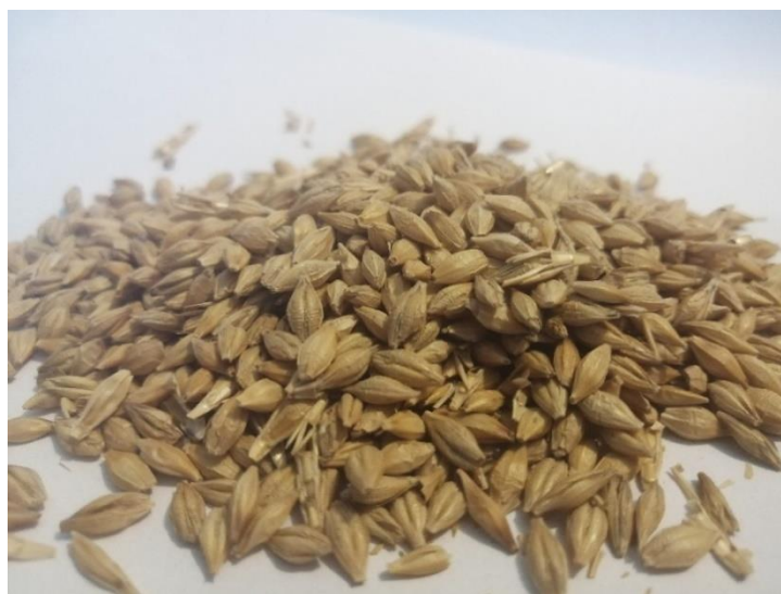
Slika 4. Zrno ječma

Plod ječma je zrno (slika 4.) koje je zaobljeno s gornje strane, dok s donje ima brazdu po sredini. Zrno je sraslo s pljevicama, ali postoje varijeteti kod kojih je zrno golo. Zrno ječma na bazi suhe tvari sadrži 9-17% bjelančevina, 59-68% nedušičnih ekstraktivnih tvari, 1,9-3,9% masti, 12,6-22,6% sirovih vlakana i 2,3-3,0% pepela (Pospišil i sur., 2014). Gagro (1997.) navodi da plod ječma sadrži 10-15% bjelančevina, 70-75% ugljikohidrata, 4-5% celuloze, oko 2,5% ulja i 2,5-3% mineralnih tvari.