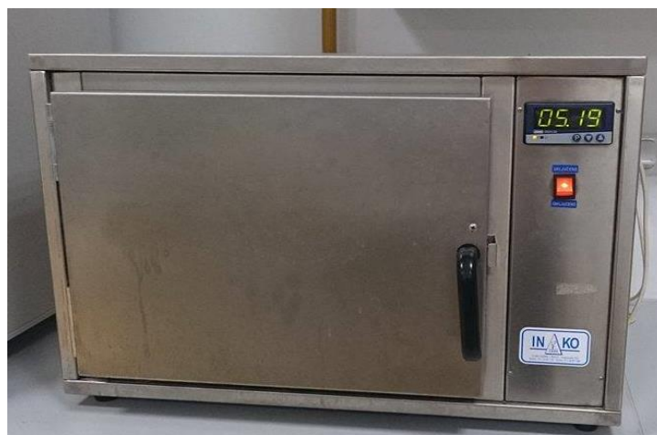
Slika 12. Laboratorijska sušnica