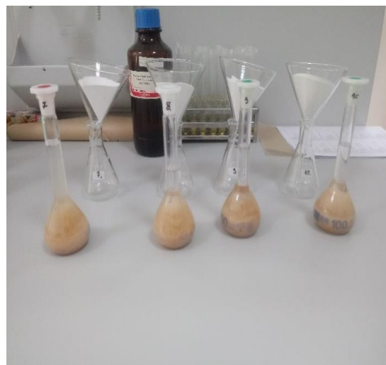
Slika 15. Filtriranje uzoraka