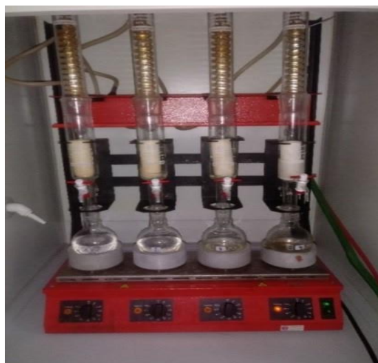
Slika 17. Soxhlet R 304

Određivanje udjela sirovih masti provodi se prema protokolu (HRN ISO 6492:2001) u ekstraktoru Soxhlet R 304 (Behr Labortechnik GmbH, Njemačka). Najprije se tikvica po Soxhletu s nekoliko staklenih kuglica za vrenje mora sušiti na 105°C, zatim se hladi u eksikatoru 30 minuta i važe na analitičkoj vagi. U celulozni tuljac za ekstrakciju odvaži se oko 5 do 10 g uzorka i pokrije slojem suhe vate, te se zatim stavi u eksikator i doda oko 250 ml petroletera. Postupak ekstrakcije traje oko 6 sati. Nakon ekstrakcije tikvica se suši na 105°C jedan sat, zatim se hladi u eksikatoru 30 minuta te važe na analitičkoj vagi (slika 17.).