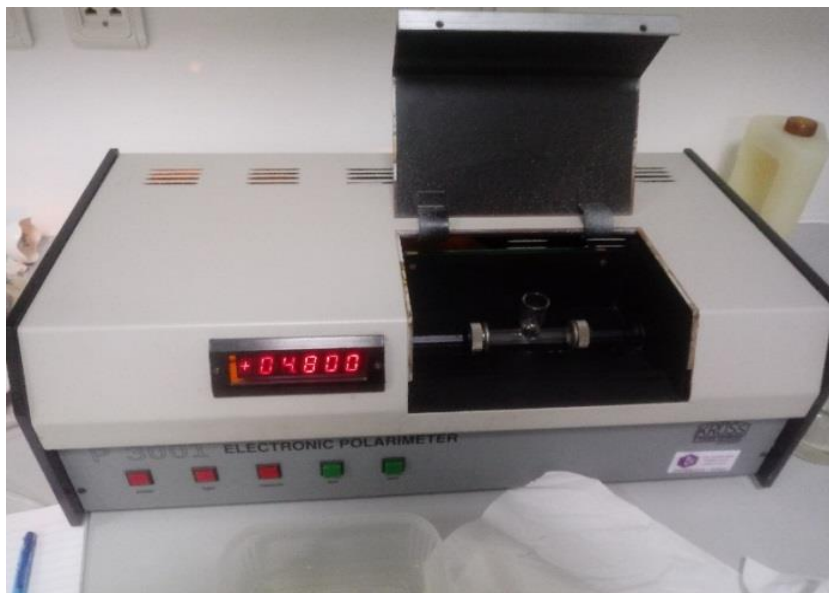
Slika 16. KRÜSS, P3001, Njemačka