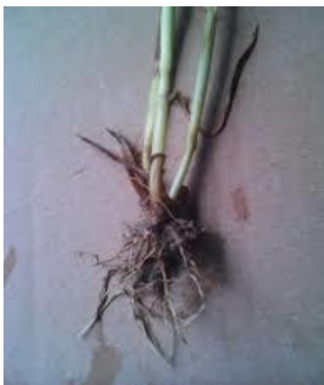
Slika 2. Korijen ječma

Korijen ječma je najslabije razvijen od svih strnih žitarica i ima manju sposobnost usvajanja hranjiva (slika 2.). Ječam ima dvije vrste korijenja: primarno ili seminalno korijenje i sekundarno ili adventivno korijenje.