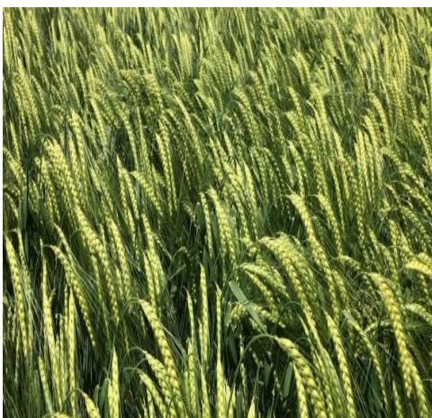
Slika 10. Sorta pivarskog ječma Casanova