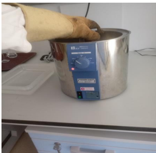
Slika 14. Vodena kupelj

Za određivanje sadržaja škroba u uzorcima primjenjuje se polarimetrijska metoda (HRN ISO 6493:2001) po Ewersu. Škrob pokazuje visoku optičku aktivnost te se na osnovi toga može odrediti polarimetrijski, nakon što se prethodno prevede u otopinu hidrolizom s kiselinom. Najprije je potrebno pripremiti otopine kiselina, 4% fosfor-volframatnu kiselinu i 1,124 HCL. U odmjernu tikvicu od 100 ml odvaže se 5 g uzorka ( \pm 0,01 ), zatim se u menzuru odmjeri 50 ml 1,124% HCL, te se pola pažljivo prelije direktno na uzorak da se ne stvori talog te se promiješa da se dobije lijepa jednolična smjesa i zatim se doda ostatak otopine kiseline i promiješa. Tikvice se zatim drže 15 minuta u kipućoj vodenoj kupelji na temperaturi od 95°C, pri čemu je prve tri minute potrebno neprestano miješanje tikvica u vodenoj kupelji uz pridržavanje čepova, dok se ostalih 12 minuta samo pridržavaju da ne izlete čepovi ili da se tikvice ne prevagnu (slika 14.). Nakon 15 minuta tikvice se izvade iz vodene kupelji i odmah se doda 20ml hladne destilirane vode. Sadržaj tikvica se potom hladi na temperaturu od 20°C uz pomoć mlaza hladne vode. Kada se sadržaj tikvica ohladi u tikvice se doda 10 ml 4%-tne fosfor-volframatne kiseline (da bi se istaložile otopljene bjelančevine) i tikvice se do oznaka nadopune destiliranom vodom te ostave nekoliko minuta da se sadržaj slegne. Nakon toga sadržaj tikvica profiltrira se kroz filter papir (slika 15.).