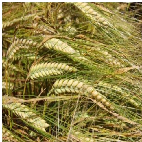
Slika 8. Sorta pivarskog ječma Planet