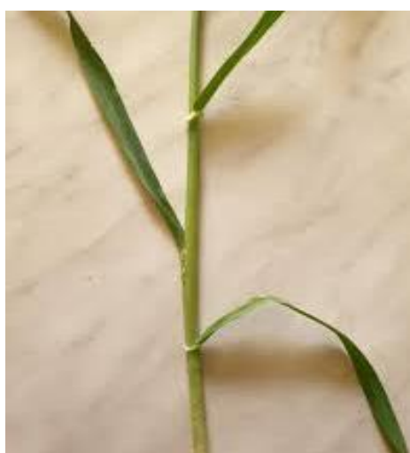
Slika 3. Stabljika ječma

Stabljika ječma sastoji se od 5 do 7 koljenaca i međukoljenaca, šuplja je, s manje građevnih elemenata, pa je zato nježnija i sklona polijeganju (slika 3.).