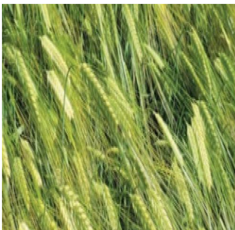
Slika 9. Sorta pivarskog ječma Lukas