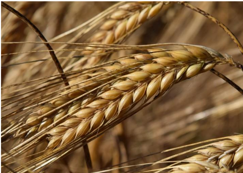
Slika 1. Ječam