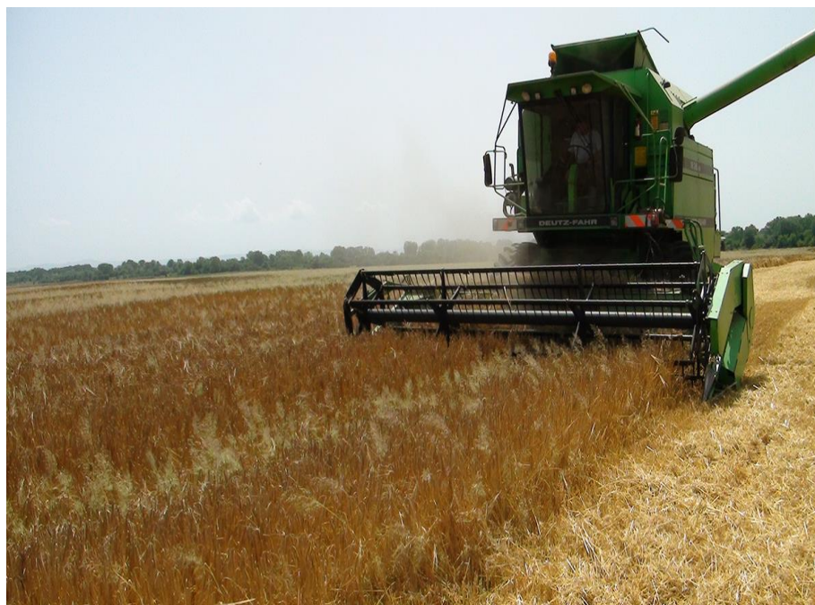
Slika 5. Žetva ječma

Ječam dozrijeva jednakomjerno, ali je sklon samoosipanju i lomu klasnog vretena (Zimmer i sur. 2009.). Žetva pivarskog ječma obavlja se žitnim kombajnom u punoj zriobi, a žetva stočnog ječma u drugoj polovini voštane zriobe (slika 5.). Najbolje je žetvu provoditi kada je vlaga zrna 14% kako bi se izbjegli troškovi sušenja. U našim proizvodnim područjima žetva se odvija krajem lipnja i početkom srpnja (Pospišil i sur., 2014.).