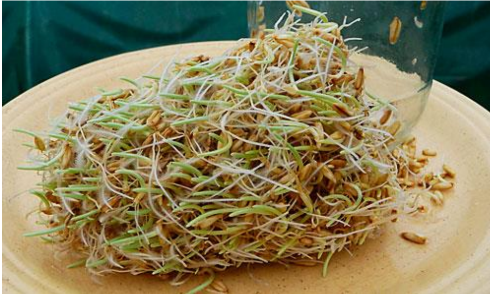
Slika 6. Ječmene sladne klice

Sladne klice se rijetko koriste u hranidbi domaćih životinja i to samo u hranidbi mladih i rasplodnih životinja. Treba ih razlikovati od pogače i sačme klica koje su preostale nakon izdvajanja ulja iz klica ( https://gospodarski.hr/rubrike/stocarstvo-peradarstvo/prilog-broja-krmiva-u-hranidbi-domacih-zivotinja/ ).