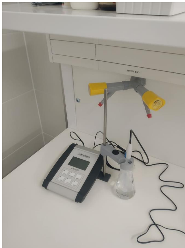
Slika 12. pH metar (17. 12. 2019.)

svjetloružičaste boje. Nakon pojave svijetlo ružičaste boje utrošak se natrijeva hidroksida pomnožio sa 1,2 čime se dobila koncentracija hlapljive kiselosti. Ukupna kiselost (g/L) bila je određena metodom titracije s 0,1 M NaOH uz indikator bromtimol plavi. Koncentracija nehlapljivih kiselina bila je dobivena razlikom koncentracija ukupne i hlapljive kiselosti. Kiselost uzoraka izražena pH-om bila je izmjerena korištenjem digitalnog pH metra. Sumporov dioksid u vinu bio je mjeren alkalimetrijski, metoda još poznata i kao metoda po Paulu. Pepeo u vinu bio je izmjereno tako što je talog koji je ostao od isparavanja uzoraka bio spaljen u mufolnoj peći te je nakon spaljivanja pepeo u g/L dobiven tako što se masa pepela pomnožila s 50.