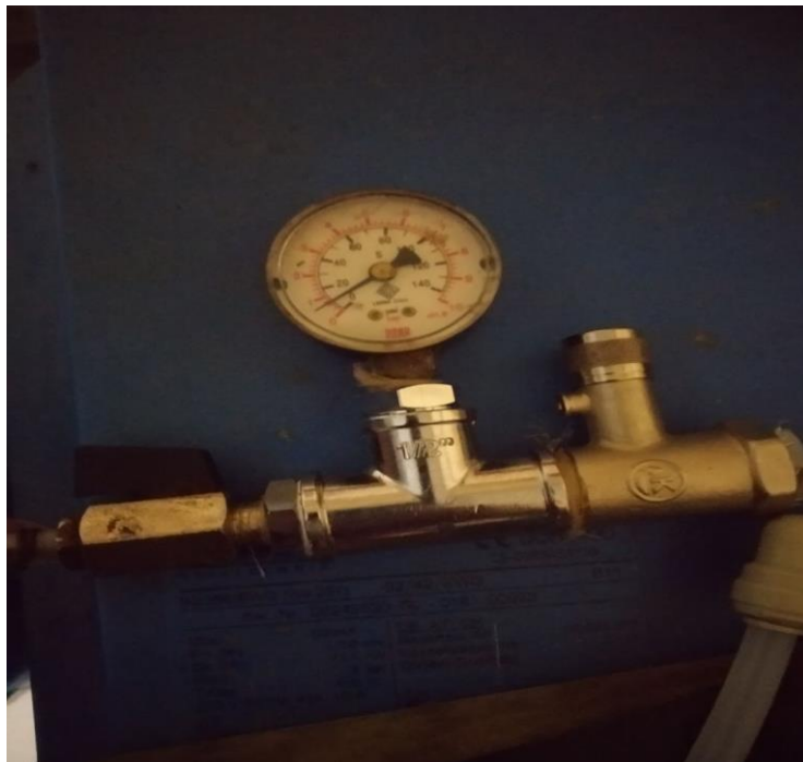
Slika 10. Priključak za ispust tlakova sa sigurnosnim ventilom (5. 10. 2019.)