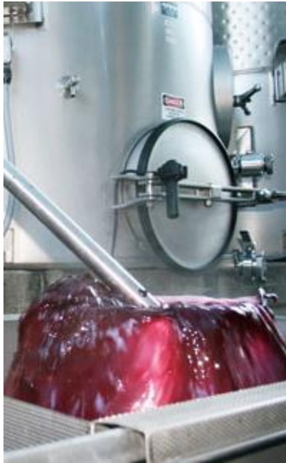
Slika 6. Delestage metoda

Metodom dozrijevanja može se dobiti izuzetno kvalitetno vino, iako je vino iz karbonske maceracije prvenstveno namijenjeno za proizvodnju mladih, svježih crnih vina.