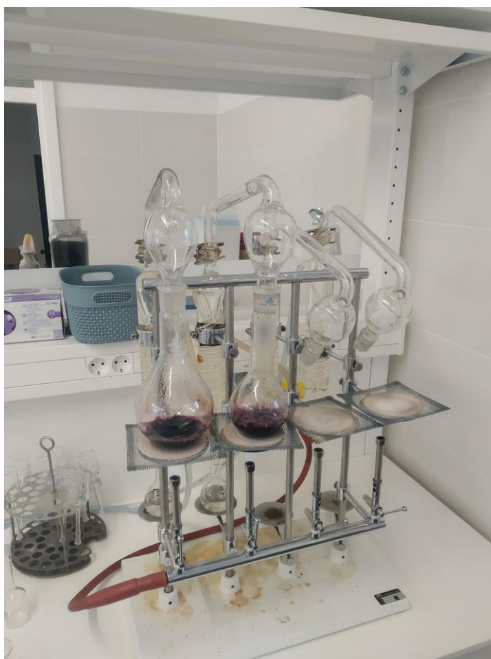
Slika 11. Destilacija vina u Kjeldahovoj tikvici (17. 12. 2019.)

Analitičko mjerenje bilo je provedeno u Laboratoriju za grožđe, mošt i vino u 7. paviljonu Agronomskog fakulteta (Svetošimunska 25, 10 000 Zagreb). Tijekom analize bila su ispitana dva uzorka: crno mlado vino 'Frankovka' proizvedeno metodom karbonske maceracije i vino proizvedeno klasičnom metodom vinifikacije. Analize uzoraka vina provedene su 17. i 18. prosinca 2019. Analize su obuhvaćale određivanje specifične težine koja je mjerena metodom piknometrije. Alkoholna jakost analizirana je metodom destilacije u Kjeldahovoj tikvici gdje se alkohol izdvojio iz vina kao destilat i usporedbom njegove specifične težine u odnosu na specifičnu težinu vode na 20°C određena je vrijednost.