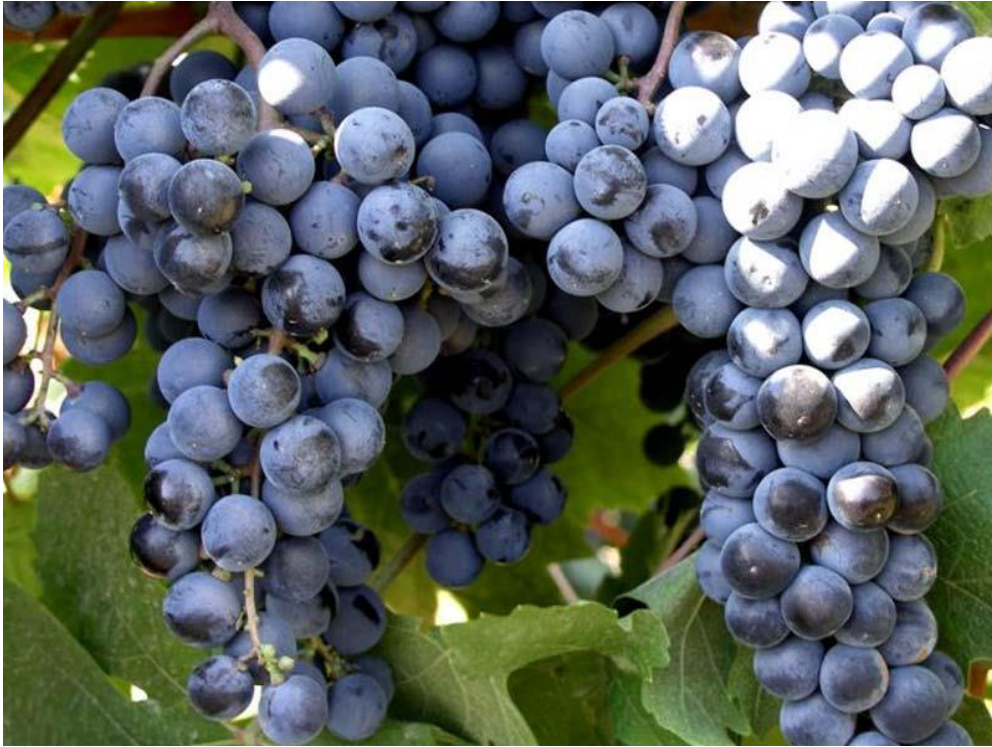
Slika 2. Sorta Muškato Hamburg

Važna stvar oko određivanja aromatske komponente jest i OAV ( Odour Aroma Value ) prema kojem su određene razlike između tipova Tempranillo vina. Tempranillo Blanco vina iz karbonske maceracije bila su najaromatičnija vina, s OAV vrijednošću 822, naspram 770 kod vina klasične vinifikacije (Ayestarán i sur. 2018.)