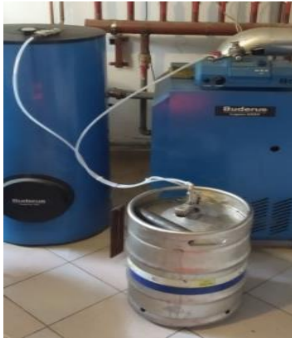
Slika 8. Konstruirani tank za provođenje karbonske maceracije (5. 10. 2019.)

Za provedbu tehnologije karbonske maceracije korišten je zatvoreni tank koji je bio samostalno konstruiran od strane provoditelja istraživanja. Materijali korišteni za konstrukciju tanka sastojali su se od hermetički zatvorene pивske bačve kako bi se spriječio ulazak kisika prilikom izvođenja same metode. Kapacitet tanka iznosio je 50 litara.