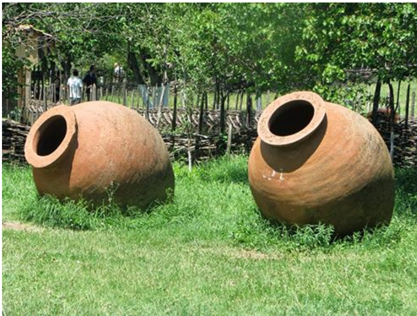
Slika 5. Kvevri

Karbonska maceracija tradicionalno se provodi u zemljama gdje je najviše zastupljena te nije došlo do potpunog razvoja neke nove slične metode u svijetu. Iako nema novih razvijenih metoda, razvile su se varijacije klasične metode poznate u svijetu kao „sub“-karbonska maceracija. Kod radova Tesniera i Flanzya (2011.) spomenuto je da je u Gruziji kod ove metode specifično što se ona ne provodi u inoks tankovima već se proizvodi u „kvevrima“ koji su specifični za gruzijsko vinarstvo. Kvevri su oblik amfora koje se pune s groždem i hermetički zatvara te ukopava duboko u zemlju gdje se zatim provodi karbonska maceracija. Najpoznatije redefinicije ove metode jesu produžena maceracija nakon što je završila fermentacija samotoka na dnu tanka, pretok samotoka nastalog iz karbonske maceracije te zamjena tog toka sa svježim moštom nastalim muljanjem i runjanjem iste sorte.