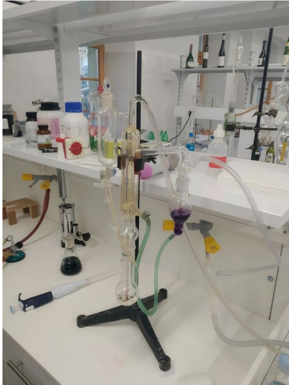
Slika 13. Metoda po Paulu (18. 12. 2019.)