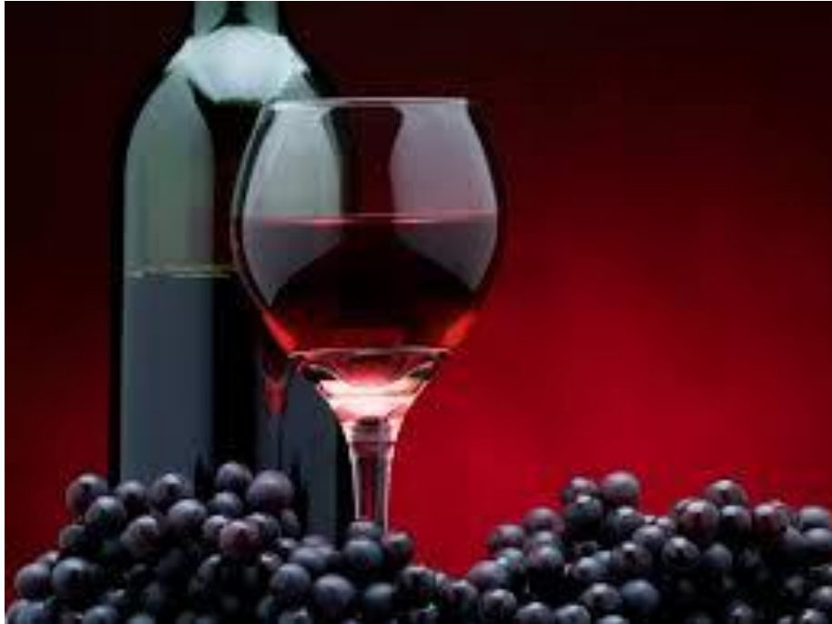
Slika 1. Crno vino

Cilj ovog istraživanja bilo je utvrditi razlike među mladim crnim vinima sorte 'Frankovka' proizvedenih klasičnom metodom proizvodnje crnih vina, sa i bez malolaktične fermentacije te karbonskom maceracijom. Početna hipoteza samog istraživanja bila je da će vino proizvedeno metodom karbonske maceracije imati izraženiji voćni aromatski karakter u odnosu na kontrolu proizvedenu klasičnom vinifikacijom kao i manje intenzivnom bojom.