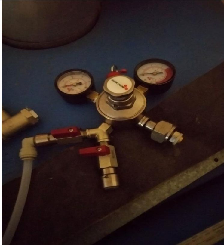
Slika 9. Priključak za unos inertnog plina (5. 10. 2019.)