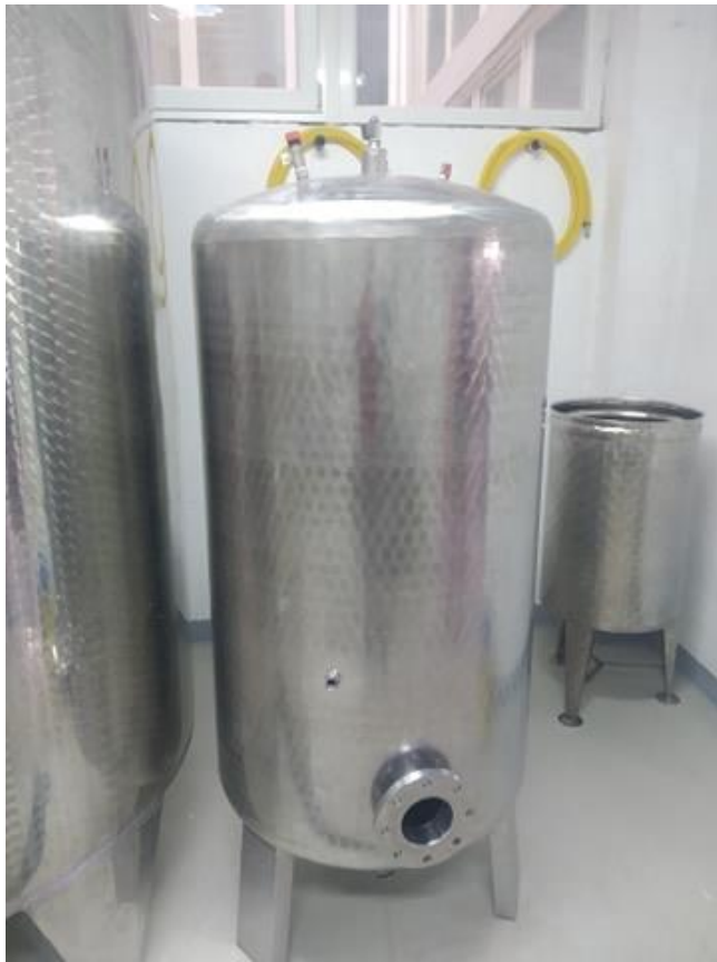
Slika 3. Inox tank za provedbu karbonske maceracije (pivovara Buzdovan 06. 9. 2019.)