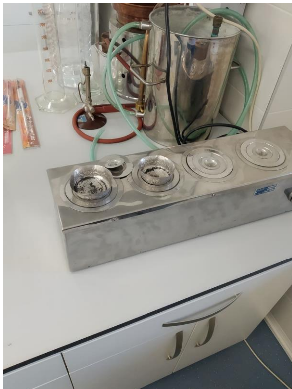
Slika 14. Pepeo vina (18. 12. 2019.)