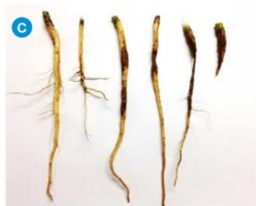
Slika 2.2.3. Štete od ličinke kupusne muhe na gorušici ( Brassica juncea )