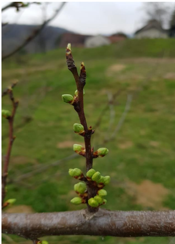
Slika 4.4.1. Kraj bubrenja lisnih pupoljaka ('Toptaste')

Snimio: Marko Cipurić (13. ožujka 2020.)