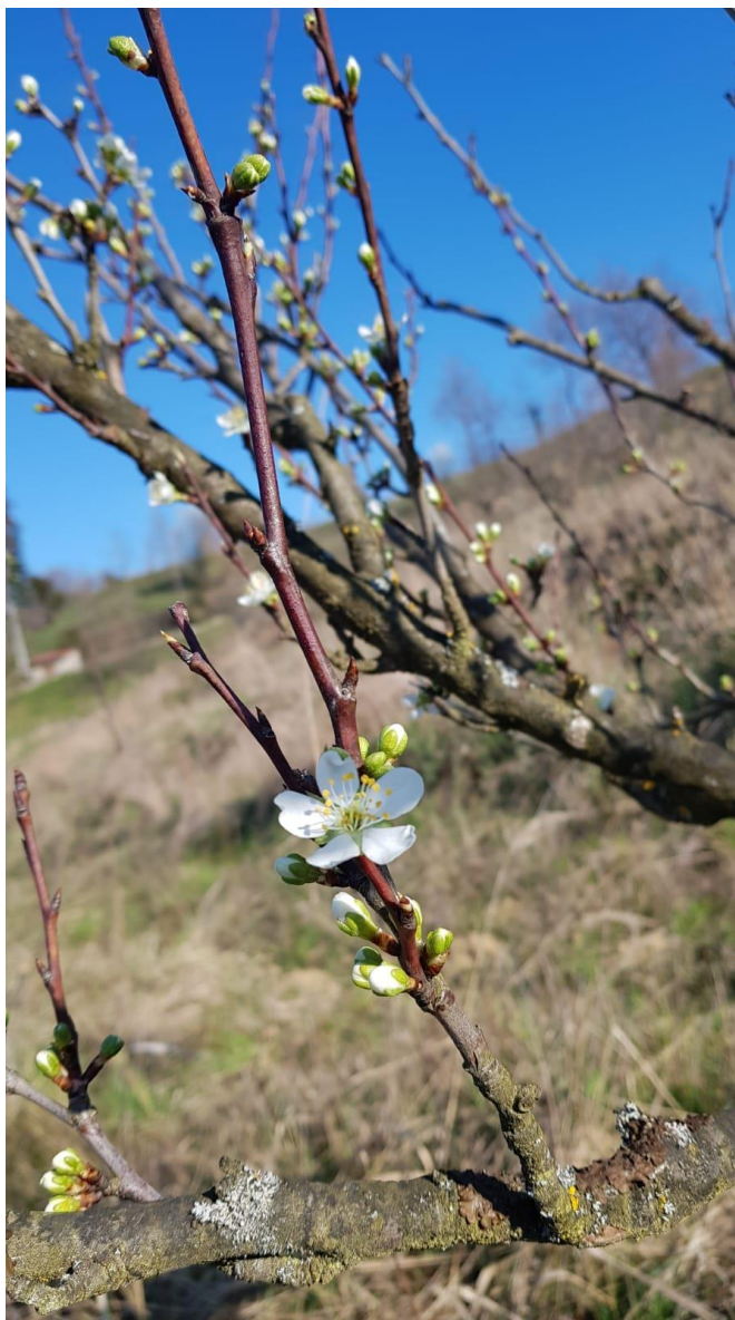
Slika 4.4.2. Otvaranje prvih cvjetova ('Toptaste')

Snimio: Marko Cipurić (16. ožujka 2020.)