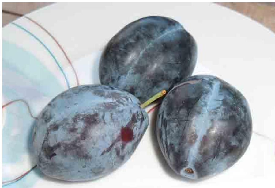
Slika 3.3.3: Jojo

Umjereno snažni rast čini sortu Jojo pozitivnim u svim rasponima, tako i za uzgoj vretena. Prirod je vrlo rani, visok i redovit . Njega i orezivanje stabla vrlo su jednostavni, pa je Jojo savršen za kućne vrtove.