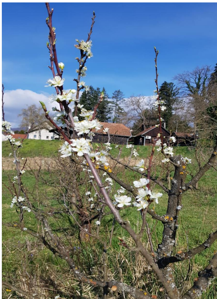
Slika 4.4.3. 10 % cvjetova otvoreno ('Topfive').