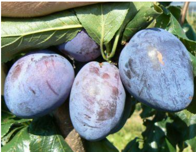
Slika 3.3.7 Toppigant

Roditelji su sorte Čačanska najbolja i President. Stablo je srednje bujnosti. Otporna sorta na bolesti, ljubičasto plave boje. Sorta koja ima značajno velike plodove (oko 60 g), okruglog oblika (Slika 3.3.7.). Nije teško uzgajati, nema posebne zahtjeve za tlo i klimatske uvjete. Tolerantna je na ogrebotine, otporna na mraz, djelomično se oprašuje. Meso je žuto i čvrsto, okus je izvrstan. Plodovi ne padaju sa stabla, mogu se dugo brati. Zrelost nastupa sredinom rujna.