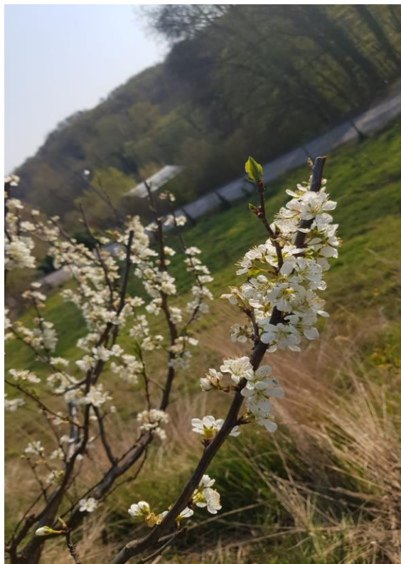
Slika 4.4.4. 40% cvjetova otvoreno ('Topgigant')

(27. Ožujak 2020.)