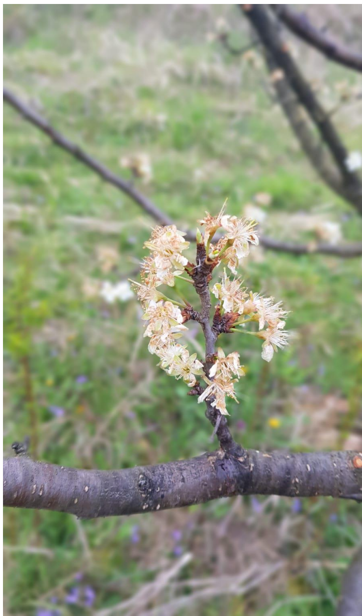
Slika 4.4.6. Štete od mraza na cvjetovima sorte 'Haganta'

Tijekom istraživanja u vrijeme pune cvatnje nastupila je vremenska nepogoda (mraz), u dva navrata. Stoga nije bilo moguće utvrditi završetak cvatnje (Slika 4.4.6. i 4.4.7.)