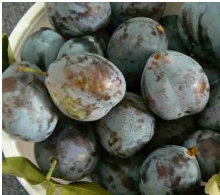
Slika 3.3.6. Elena

Sorta šljive Elena je Njemačkog podrijetla nastala križanjem sorti Stanley i Mađarske. Stablo je srednje bujnosti, rano dolazi u rod i rađa redovito i obilno. Plodovi (Slika 3.3.6.) su srednje krupnoće oko 25 - 36 g, tamnoplave s primjesom azurne boje voštane teksture. Otporna je na Moniliju. Samooplodna sorta, plodovi dozrijevaju sredinom 9 mjeseca. Plodovi se mogu koristiti u svježem stanju ili prerađivati.