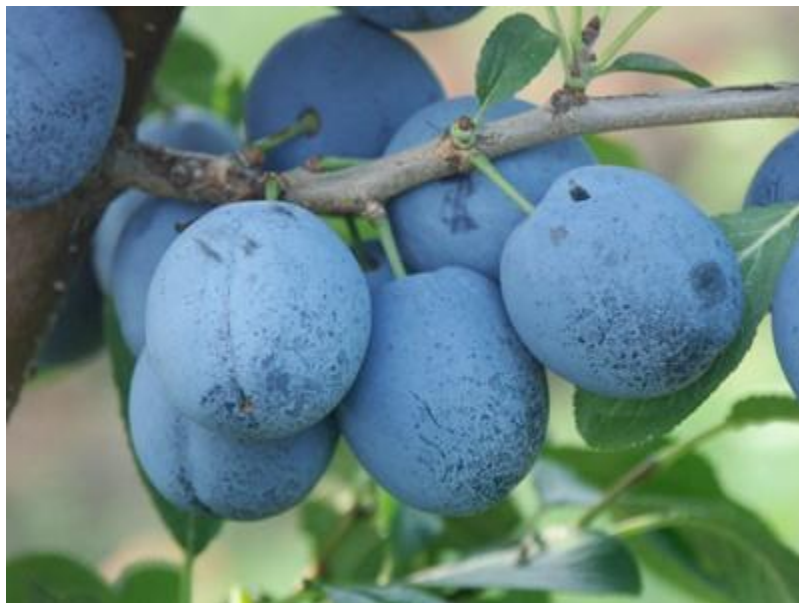
Slika 3.3.4. Topfive

Umjereno bujna sorta kojoj se lagano formira uzgojni oblik. Roditelji su Čačanska najbolja i Auerbacher. Cvate srednje kasno, a dozrijeva krajem srpnja. Samooplodna je sorta koja obilno rađa. Plod (Slika 3.3.4.) je tamno plave boje kože, izduženo okruglast. Meso je čvrsto i sočno, svijetlo žute boje te izvrsnog okusa. Meso se lako odvaja od koštice, otporna na virus šarke kao i druge bolesti. Pogodna je za svježju potrošnju i pečenje. Dobro podnosi skladištenje.