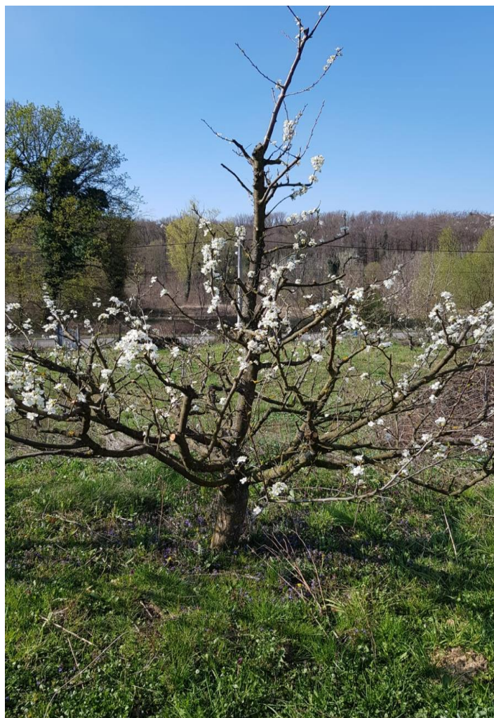
Slika 4.4.5. Puna cvatnja ('Topfirst')

Snimio: Marko Cipurić (30. Ožujak 2020.)