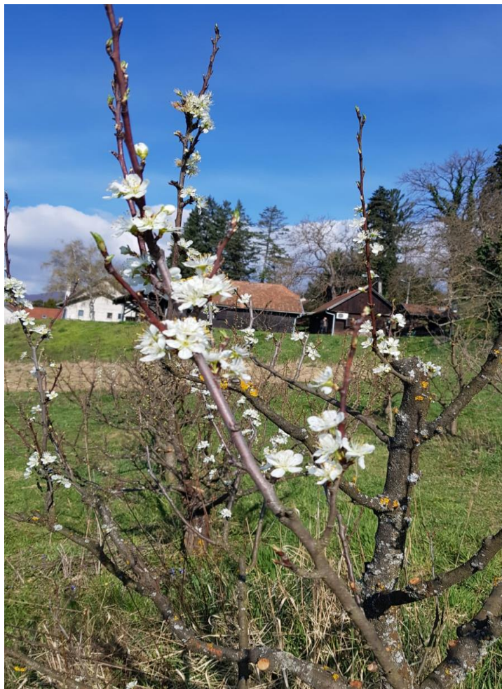
Slika 4.4.3. 10 % cvjetova otvoreno ('Topfive').

(24. ožujka 2020.)