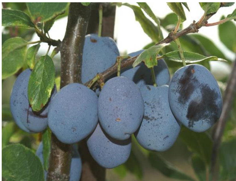
Slika 3.3.2. Topfirst

Sorta otporna na virus šarke šljive. Roditelji su Čačanska najbolja i Ruth Gerstetter. Srednje je bujna sorta koja srednje rano cvate, a dozrijeva krajem srpnja. Samooplodna je sorta, ali se preporučuje oprašivač. Rađa redovito i obilno. Plod (Slika 3.3.2.) je krupan (45 g), ljubičaste do plave boje, s prisutnim maškom na površini ploda. Meso je žute do crvene boje i sočno te se lako odvaja od koštice. Dobrog je okusa, te je pogodna za svježju potrošnju i pečenje. Prema nekim autorima najbolja stolna sorta šljive u tom vremenu dozrijevanja. Bere se oko 15 dana. Zahtjeva berbu u više navrata pošto plodovi postepeno dozrijevaju, prezreli plodovi otpadaju.