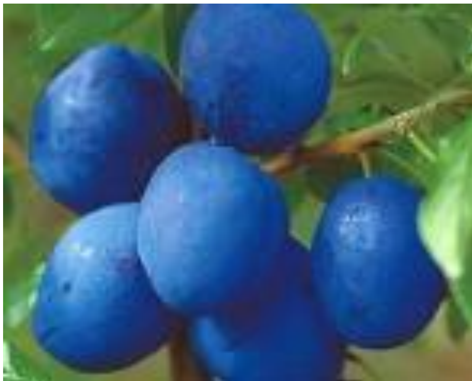
Slika 3.3.5. Haganta

Jedna od najboljih introduciranih sorata u posljednje vrijeme. Roditelji su sorte Čačanska najbolja i Valor. Srednje bujna sorta, s položenijim kutovima grananja što olakšava formiranje i održavanje uzgojnog oblika. Dozrijeva obilno krajem kolovoza, početkom rujna. Djelomično je samooplodna, a preporučeni oprašivači su Hanita, Katinka i Čačanska ljepotica. Plod (Slika 3.3.5.) je krupan do vrlo krupan (67 g ), izdužen i teži 50 do 80 g. Kožica je tamno plave boje, a meso čvrsto, sočno, žuto do zlatno žuto te se lako odvaja od koštice. Okus je slatkasti i uravnotežen.