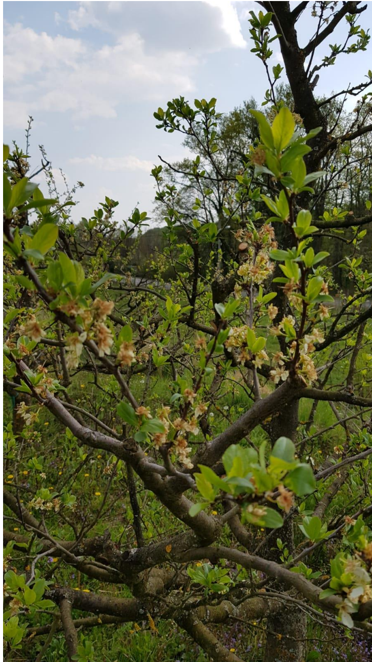
Slika 4.4.7. Štete od mraza na cvjetovima sorte 'Toptaste'

Snimio: Marko Cipurić (30. ožujak 2020.)