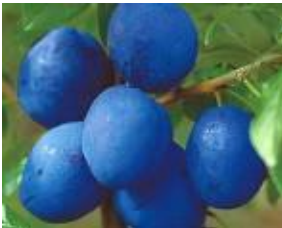
Slika 3.3.5. Haganta

Jedna od najboljih introduciranih sorata u posljednje vrijeme. Roditelji su sorte Čačanska najbolja i Valor. Srednje bujna sorta, s položenijim kutovima grananja što olakšava formiranje i održavanje uzgojnog oblika. Dozrijeva obilno krajem kolovoza, početkom rujna. Djelomično je samooplodna, a preporučeni oprašivači su Hanita, Katinka i Čačanska ljepotica. Plod (Slika 3.3.5.) je krupan do vrlo krupan (67 g ), izdužen i teži 50 do 80 g. Kožica je tamno plave boje, a meso čvrsto, sočno, žuto do zlatno žuto te se lako odvaja od koštice. Okus je slatkasti i uravnotežen.