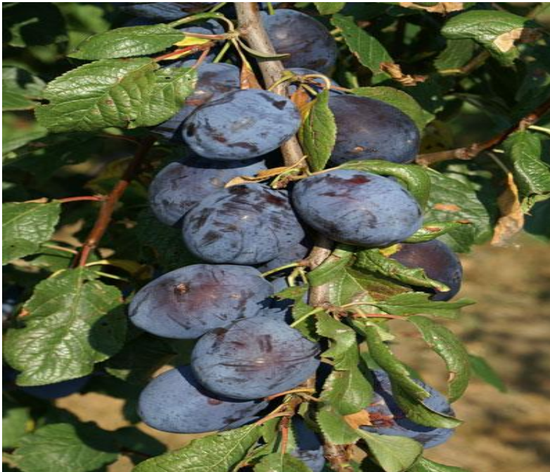
Slika 3.3.1. Toptaste

Njemačka sorta šljive srednjeg roka dozrijevanja plodova, koji su visoke kvalitete i univerzalne namjene. Prema istraživanjima najkvalitetnija sorta između svih sorata u pokusnoj varijanti u Geisesenheim-u. Dozrijeva sredinom rujna, boja je lijepa i ravnomjerna, zreli plodovi još dugo ostaju na drvetu, a onda su jako slatki, aromatični, izvanrednog okusa. Plod (Slika 3.3.1.) teži oko 40 g, zbog visoke koncentracije šećera odličan je i za rakije, a zbog otpornosti na bolesti za ekološki uzgoj, dobro podnosi mrazove.