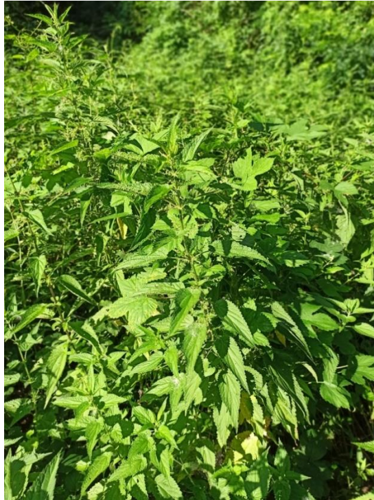
Slika 2.1.1.1 Biljka koprive