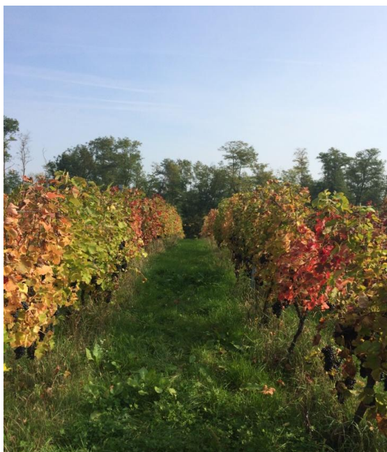
Slika 3. Mikorizirani redovi, Jazbina 2014.