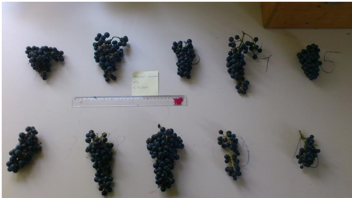
Slika 4. Mjerenje grozdova za uvometrijsku analizu grozda i bobice

Uvometrijska istraživanja se provode u fazi pune zrelosti grožđa. Uzorak ne smije biti manji od 10 grozdova i 100 bobica. Grozdovi moraju biti neoštećeni i uzimaju se na točno propisan način koji osigurava reprezentativnost uzorka.