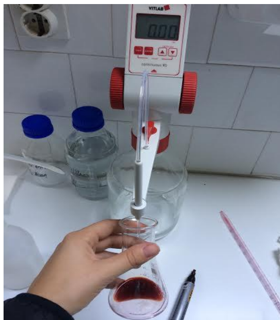
Slika 5. Metoda direktne titracije