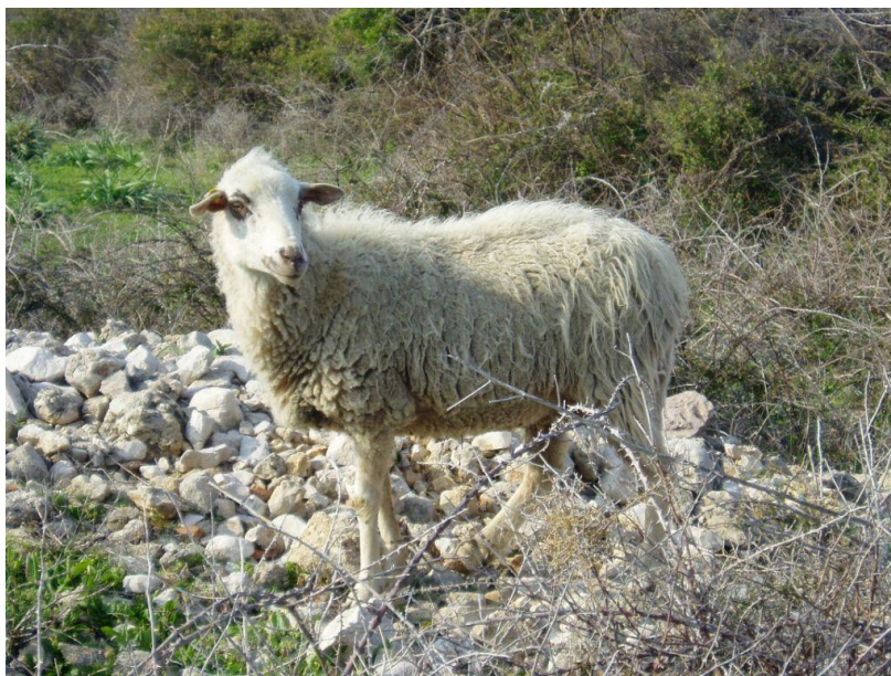
Slika 2. Paška ovca