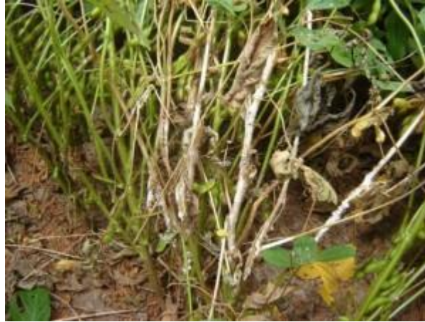
Slika 3.3 Bijela trulež korijena i stabljike