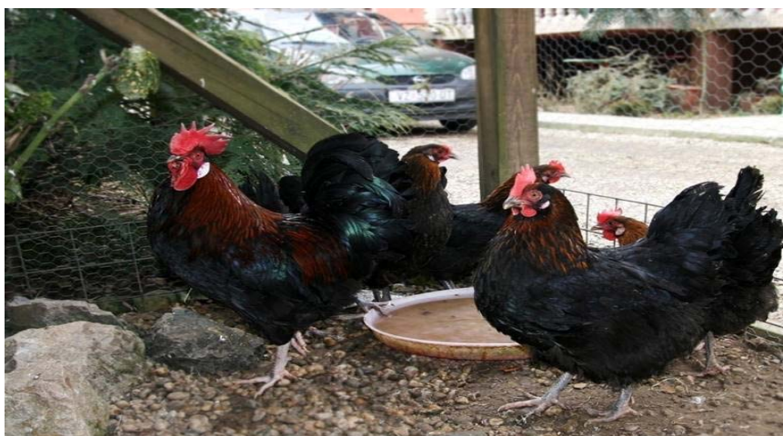
Slika 2.3.4. Crno-zlatni soj

d) Crno-zlatni soj (Slika 2.3.4.) - vrat, leđa i sedlišće im je narančasto-zlatne boje, a ostatak perja na tijelu je crne boje sa metalno zelenim sjajem. Kokoši imaju samo narančastožut vrat, ostatak perja na tijelu je crne boje metalno zelenog sjaja.