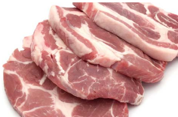
Slika 2.4.2. Svinjsko meso