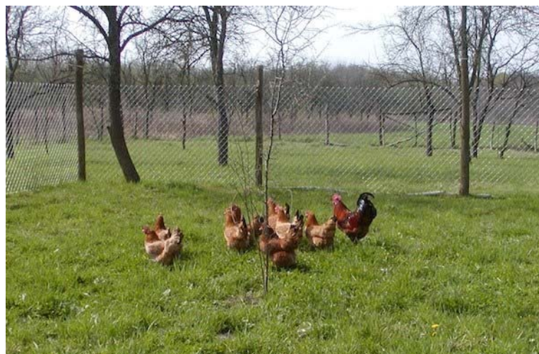
Slika 1.1. Rasplodno jato kokoši hrvaticice na ispustu

Kokoš hrvatica je izvorna hrvatska pasmina kokoši koja je dobro prilagođena takvom sustavu. Kokoš hrvatica je službeno priznata kao pasmina 1998. godine (NN 127/98). Uzgaja se odvojeno u četiri soja: crveni, jarebičasto-zlatni, crni i crno-zlatni soj. Karakteristika ove pasmine su bijeli podušnjaci te kod crvenog i jarebičasto-zlatnog soja bijele noge dok su kod crnog i crno-zlatnog soja noge sivkaste boje. Osim iznimno velike prilagodljivosti na promjenjive okolišne uvjete koji ju čine poželjnom pasminom za alternativni uzgoj, sama činjenica da se radi o izvornoj pasmini te ju smatramo kulturnim blagom Republike Hrvatske daje na važnosti njenom očuvanju te sve češćem korištenju u proizvodnji mesa i jaja.