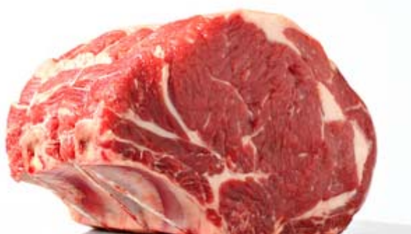
Slika 2.4.1. Goveđe meso

Izuzev što se pileće meso razlikuje po svom kemijskom sastavu i energetske vrijednosti od mesa drugih vrsta, također ima puno razlike i u senzoričkim svojstvima mesa. Razlike se mogu primijetiti na Slici 2.4.1., na kojoj je prikazano meso govedine, na Slici 2.4.2. na kojoj je prikazano meso svinjetine i na Slici 2.4.3. na kojoj je prikazano meso piletine.