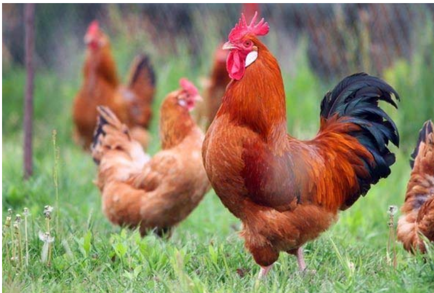
Slika 2.3.1 Crveni soj izvor: Agroportal.hr pristup 9.9.2019

a) Crveni soj (Slika 2.3.1)- osnovna boja perja je ciglasto crvena sa narančastozlatnim vratom bez crnog crteža. Također boja može varirati od svijetlociglaste do tamnocrvene. Kod pijetlova rep je crn sa metalno zelenim sjajem, dok je kod kokoši samo vrh repa obojen crno.