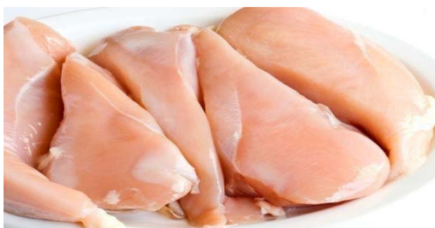
Slika 2.4.3. Pileće meso

Gledajući Sliku 2.4.1. goveđeg mesa, Sliku 2.4.2. svinjskog mesa i Sliku 2.4.3. pilećeg mesa možemo zaključiti da je meso piletine najsvjetlije boje i sadrži najmanji udio masti, u odnosu na goveđe i svinjsko meso.