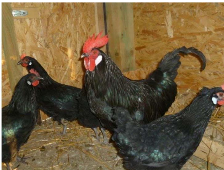
Slika 2.3.3 Crni soj Izvor: Ivan Alatrović

c) Crni soj (Slika 2.3.3) - potpuno crne boja metanog sjaja, kako kod pijetlova, tako i kod kokoši. Bijeli podušnjaci, noge sivkaste boje.