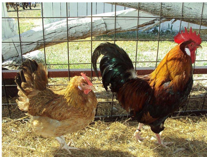
Slika 2.3.2. Jarebičasto-zlatni soj

b) Jarebičasto-zlatni soj (Slika 2.3.2.) - vrat i bočna pera sedlišta su narančasto zlatne boje, dok su tamnocrvene boje leđa, krila i letna pera. Prsa, trbuh i rep su boje metalno zelenog sjaja. Kokoši imaju isto obojen vrat kao i pijetlovi, ali je ostatak trupa prekriven okeržutom i sivosmeđom bojom. Na prsima im je perje svjetlije boje nego kod pijetlova, a vrh repa crne boje.