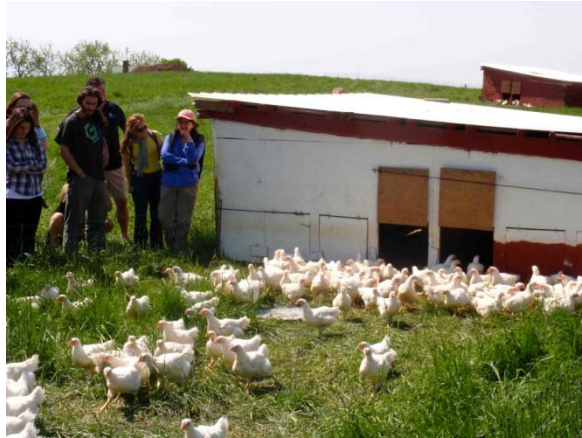
Slika 2.1.1. Slobodni sustav držanja