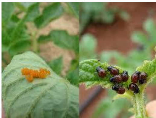
Slika 2.2. Jaja (lijevo) i ličinke (desno) krumpirove zlatice.

jaja traje od pet do 16 dana, ovisno o temperaturi te je najkraći kada je temperatura zraka iznad 25 °C. Iz odloženih jaja kroz nekoliko dana izlaze ličinke koje se presvlače tri puta (Pintar i sur., 2016). Razvoj prvog stadija ličinke traje od tri do četiri dana, drugog stadija između tri i sedam dana, trećeg od četiri do osam, a četvrtog stadija od pet do 11 dana (Maceljski, 2002). Što je ličinka višeg razvojnog stadija, veća je šteta koju uzrokuje (Pintar i sur., 2016). Ličinke se hrane na biljkama između dva i tri tjedna, nakon čega se spuštaju s biljaka i odlaze u tlo na kukuljenje (Bažok, 2013). Za razvoj kukuljice u tlu potrebno je da suma efektivnih temperatura viših od 11,5 °C dosegne 180 °C (Maceljski, 2002). Početkom srpnja iz kukuljica izlaze odrasle zlatice prve generacije koje odlaze jaja na već velike i razvijene biljke krumpira (Bažok, 2013). Nakon izlaska iz kukuljice, odrasle zlatice moraju se hraniti pet do deset dana kako bi im se krila u potpunosti razvila te nakon toga mogu letjeti na udaljenosti i do nekoliko kilometara (Weber i Ferro, 1996). Ličinke nove generacije razvijaju se tijekom srpnja, a u kolovozu se javljaju odrasli druge generacije koji se još kratko vrijeme hrane prije odlaska na prezimljenje (Bažok, 2013). Ovisno o temperaturi, razvoj krumpirove zlatice od jaja do odraslog oblika traje između 14 i 56 dana (Ferro i sur., 1985). Najbrže se razvija na temperaturama između 25 °C i 32 °C (Alyokhin i sur., 2008).