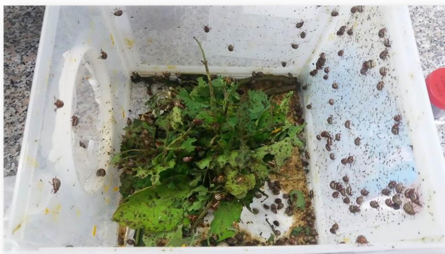
Slika 3.3. Uzgoj u entomološkim kavezima