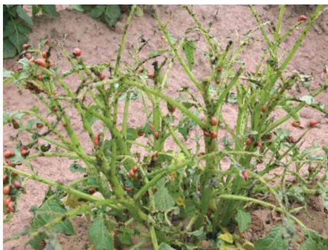
Slika 3.2. Štete koje čini krumpirova zlatica na krumpiru.

tijekom srednje faze razvoja te do 100 % u kasnijoj fazi bez značajnog gubitka prinosa (Hare, 1980). Međutim, zbog velike proždrljivosti ovog štetnika te brzog porasta populacije, razina defolijacije često prelazi preko granica koje biljka u ranijim fazama razvoja može tolerirati pa dolazi do značajnog gubitka prinosa (Alyokhin, 2009). Smatra se da uništenje cime krumpira do 20 % ne utječe na snižavanje prinosa gomolja. Kako navodi Maceljki (2002) istraživanja su pokazala da visina šteta najviše ovisi o tome u koje vrijeme, u odnosu na tuberizaciju, dođe do uništenja više od 20 % lisne mase. Primjerice, za jakog napada i potpune defolijacije u početku tuberizacije prinos gomolja je manji od količine zasađenog sjemenskog krumpira, dakle, došlo je do totalne štete. Za identično jakog napada dvadesetak dana prije završetka vegetacije, gubitak prinosa iznosio je samo 30 %, pa se može zaključiti da se napad prije cvatnje odražava na visinu prinosa od dva do pet puta više od napada nakon cvatnje (Maceljki, 2002). Bez kontrole i suzbijanja, ovaj štetnik može potpuno uništiti usjeve krumpira (Harcourt, 1971).