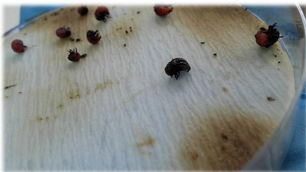
Slika 3.6. Očitavanje pokusa

Očitavanje pokusa provedeno je tri uzastopna dana, odnosno 24, 48 i 72 sata nakon postavljanja pokusa. Pri svakom očitavanju pregledavane su sve ličinke u svakoj petrijevoj posudici te je utvrđeno djelovanje pojedinog insekticida. Ličinke su bile klasificirane kao unaffected (žive su i normalno reagiraju na podražaje dodirrom) i dead or affected (mrtve su ili ne reagiraju normalno na podražaj dodirrom, odnosno grče se, trzaju, imaju nekoordinirane kretnje ili su nenormalno razvijene i deformirane) (slika 3.6.). Nakon svakog očitavanja mrtve ličinke uklonjene su iz petrijeve posudice, a u slučaju da su ličinke pojele čitav list krumpira, dodan je novi list podjednake veličine i to od rezervnih biljaka tretiranih varijanti pri postavljanju pokusa.