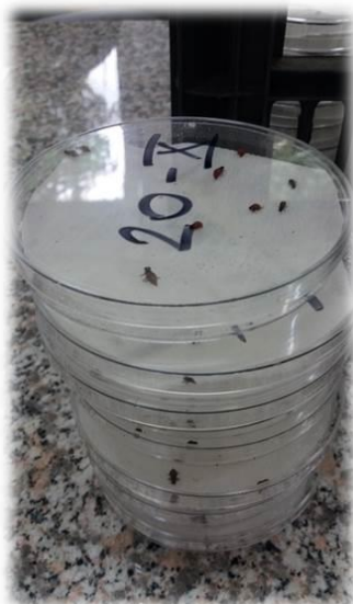
Slika 3.5. Postavljanje ličinki u petrijeve posudice