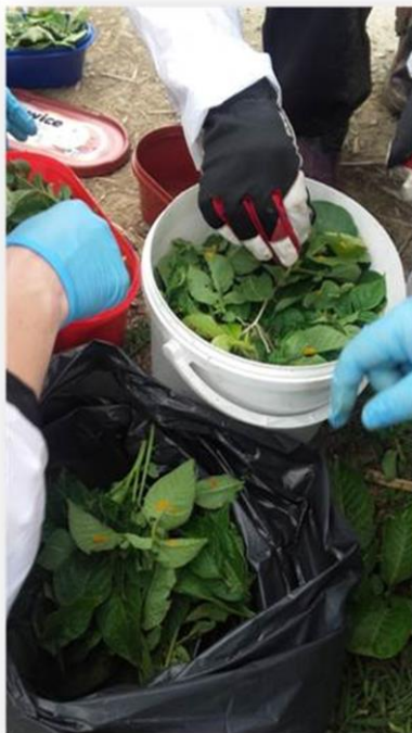
Slika 3.2. Sakupljanje jaja i ličinki za provedbu pokusa