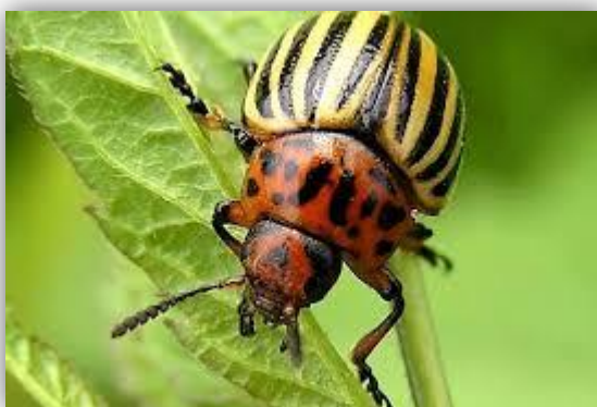
Slika 2.1. Odrasla krumpirova zlatica (Izvor: 034portal, 2019).

Krumpirova zlatica ( Leptinotarsa decemlineata Say) najznačajniji je štetnik krumpira u Hrvatskoj i svijetu (Bažok, 2013). Podrijetlom je iz Sjeverne Amerike, a Europom se počela širiti početkom 20. stoljeća te je danas, osim na području Velike Britanije, Irske i skandinavskih zemalja, rasprostranjena širom Europe (Pintar i sur., 2016). Osim u Europi, krumpirova zlatica raširena je i diljem Sjeverne Amerike, Male Azije, središnje Azije te zapadne Kine (Weber, 2003). Na ovim prostorima otkrivena je prvi puta 1946. godine u Sloveniji kraj Krškog, a na području Hrvatske otkrivena je prvi puta 1947. godine na području Zaprešića. Nekoliko godina kasnije, redovitim širenjem kroz Europu, prešla je granice u Istri i Međimurju te je danas rasprostranjena po cijeloj državi, osim na nekim otocima (Maceljki, 2002).