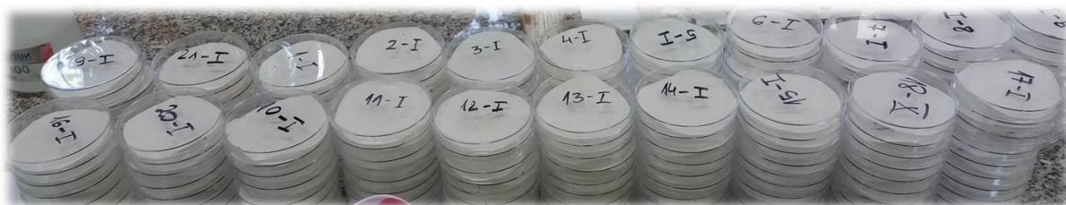
Slika 3.4. Priprema i označavanje petrijevih posudica

Za provedbu pokusa bilo je potrebno pripremiti 130 petrijevih posudica za svaku lokaciju, a u svaku je postavljen navlaženi filter papir kako bi se očuvala vlažnost listova. Petrijeve posudice označene su vodootpornim markerom na poklopcu navodeći oznaku lokacije, oznaku varijante (1 – 13) i oznaku ponavljanja (I – X) (slika 3.4.). U svaku petrijevku postavljen je po jedan veći list krumpira na dno, otkinut s busena iz odgovarajuće varijante pokusa. Pri tome je važno bilo paziti da su listovi slične veličine. Ostatak tretiranih biljaka čuvao se u optimalnim uvjetima kao rezerva hrane za ličinke tijekom perioda očitavanja pokusa. U svaku od označenih petrijevih posudica stavljeno je po 10 ličinki krumpirove zlatice odgovarajućeg razvojnog stadija (slika 3.5.).