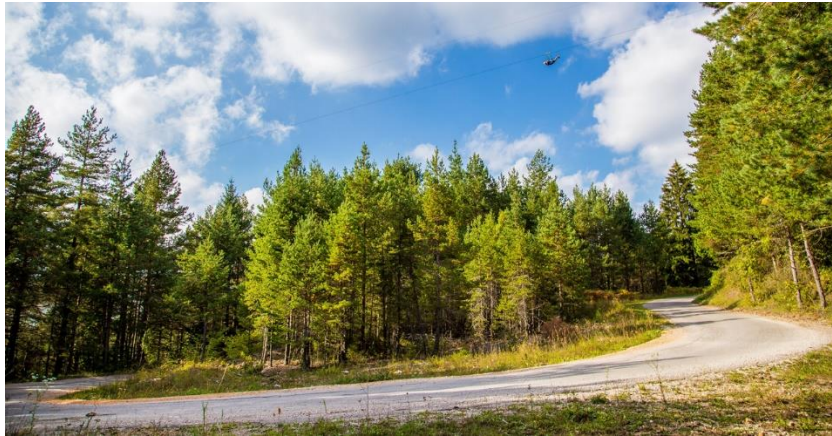
Slika 11. Zip line „Mali medo“

prilagođena i djeci od 5 godina i “ozbiljnim” penjačima, tako da svatko može naći nešto za sebe. Također u sklopu centra Bijeli vrh je u ponudi i Disc Golf, sport koji objedinjuje dva poznata sporta, golf i disk – frizbi. Disc Golf je namijenjen svima, rekreativcima i profesionalcima. Uz navedeno, u sklopu SRC Bijeli Vrh može se iznajmiti bicikl i istraživati oko 150 km označenih staza po poljima netaknute prirode Like i kroz gustu šumu Male Kapele ( http://tzo-vrhovine.hr/atrakcije/ ).