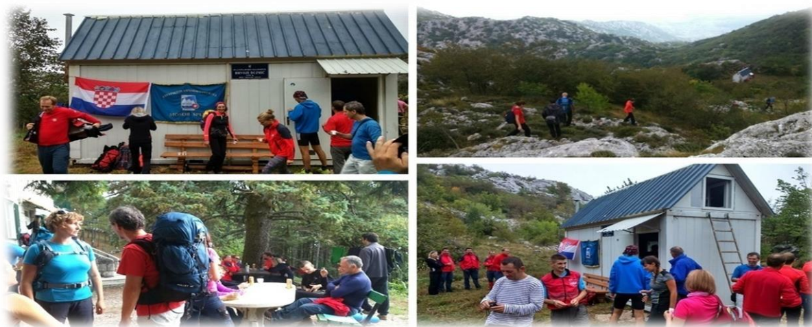
Slika 4.3.4. Planinarsko sklonište "Hrvoje Dujmić" Mosor

Planinarsko sklonište Hrvoje Dujmić nalazi se na teško pristupačnom visinskom području Jabukovca, na sjevernoj strani Mosora, ispod vrha Veliki Kabal. Sklonište je zapravo metalni kontejner, uređen za planinarske potrebe. Nalazi se na rubu slikovite travnate zaravni, uz put koji se iz Kotlenica mimo špilje Vranjače uspinje prema Velikom Kablu. Na području Jabukovca ima mnogo zanimljivih speleoloških objekata. Sklonište je nazvano po iznenadno preminulom splitskom planinaru i gorskom spašavatelju. Otvoreno je stalno. Broj kapaciteta je 10 kreveta.