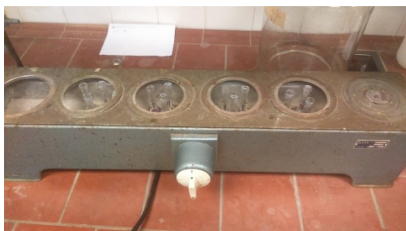
Slika 7. Zagrijavanje uzoraka u vodenoj kupelji