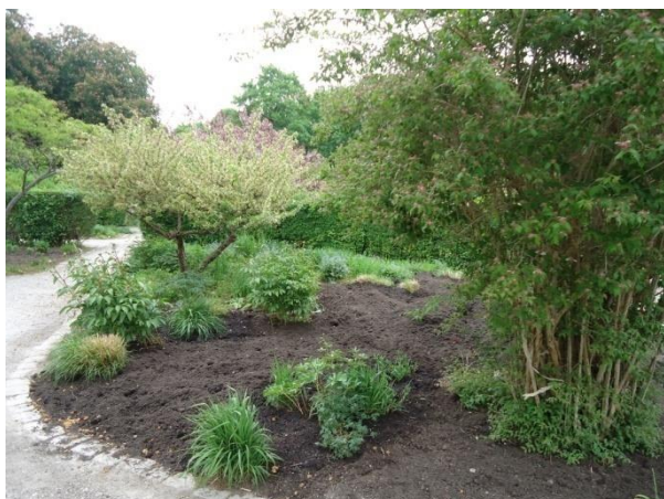
Slika 32. 'Nedovršena' gredica s trajnicama (Westpark)

U oba parka su primijećene pozitivne korelacije u odnosu na njihovo održavanje. Osim dvije gredice na području Westparka koje su ostale 'nedovršene', točnije na njima je uz pokoju vrstu uočeno i golo tlo, prikazano na slici 32. Što se tiče zaštite od korova, samo na jednoj gredici u Westparku uočena je nezanemariva količina korova koja uništava sveukupnu estetsku sliku parka, prikazano na slici 33.