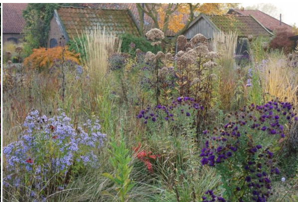
Slika 5. Upotrebljavanje matrice (vanjski dio - trave, unutarnji dio - perunike, žednjaci)