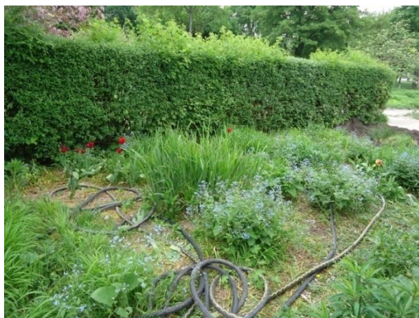
Slika 31. Sistem za ručno zalijevanje trajnica (Westpark) (Božić, G. 2018.)

U oba parka su primijećene pozitivne korelacije u odnosu na njihovo održavanje. Osim dvije gredice na području Westparka koje su ostale 'nedovršene', točnije na njima je uz pokoju vrstu uočeno i golo tlo, prikazano na slici 32. Što se tiče zaštite od korova, samo na jednoj gredici u Westparku uočena je nezanemariva količina korova koja uništava sveukupnu estetsku sliku parka, prikazano na slici 33.