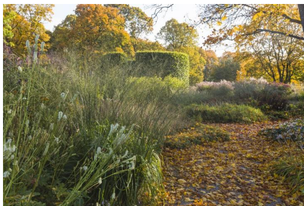
Slika 8. Jesenske smeđe boje u vrtu

Noel Kingsbury je engleski vrtni dizajner, pisac je mnogobrojnih djela o vrtlarenju, biljnim znanostima i srodnim temama. Među mnogobrojnim djelima svakako treba istaknuti knjigu izdanu 1996. 'New Perennial Garden', s kojom je unaprijedio naturalistički dizajn sadnje u vrtovima i dizajniranim pejzažima. Ono što Noel navodi kao jezgru teme je biljna ekologija i kako može biti primijenjena na vrtnu situaciju, ne samo u smislu stvaranja prirodno inspirirane sadnje, nego i razumijevanje kako biljke funkcioniraju i preživljavaju, što je ključno za bilo kojeg vrtlara ( www.noelkingsbury.com ).