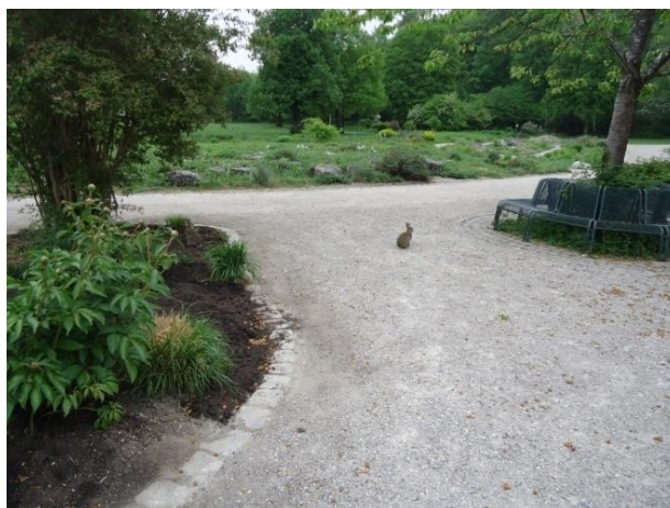
Slika 30. Prisutnost divljih životinja u Westparku (Božić, G. 2018.)

Kako bi omogućili i divljim životinjama život u područjima parkova, ne treba stvarati barijere ili granice nego se treba okrenuti holističkom pristupu i ujediniti područja divljine kroz park.