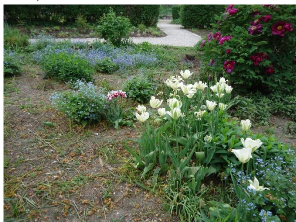
Slika 22. Kombinacija Tulipa sp. i Brunnera macrophylla (Božić, G. 2018.)

26, 27 i 28. Na jednoj gredici u području četvrti Donji Grad, kombinirana je sadnja sa sezonskim cvijećem (slika 29).