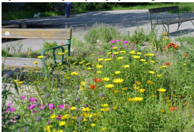
Slika 16. Trajnice za sunčana staništa na gredici (Hugo Wolf Park, Beč) (Han Dovedan, I. 2003.)

Na temelju Hansenove podjele trajnica prema staništima, područje istraživanja je obuhvaćalo trajnice za sunčana staništa na gredicama te kamenjare prikazane na slikama 16 i 17. Utvrđeno je da je brojčano više trajnica primijenjeno na gredicama nego na kamenjarama.