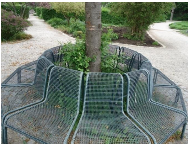
Slika 35. Klupe prisutne u Westparku

Oba istraživana parka Srednje Europe (Westpark i Hugo Wolf Park), idealan su prikaz pasivnog rekreativnog područja jednog grada. Kroz istraživanje uočen je veliki broj ljudi koji dolaze upravo u ove parkove zbog rekreacije, opuštanja, tišine i mirnog razmišljanja. Prisutne klupe u oba parka dodatno doprinose povećanju posjetitelja, prikazano na slici 35 i 36.