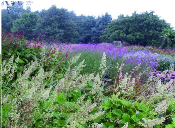
Slika 7. Zamagljenje rubova - misterioznost među pomiješanim biljkama