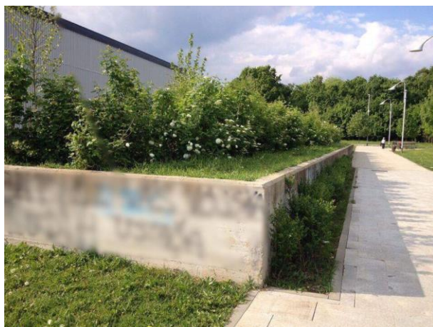
Slika 15. Uočeni vandalizam na gredicama u četvrti Sesvete, Novi Jelkovec (Božić, G. 2017.)

Najčešće primijenjene biljne vrste na području grada Zagreba (Trg Josipa Jurja Strossmayera, Donji Grad) prikazane su u tablici 1.