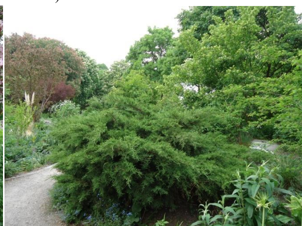
Slika 26. Juniperus sp.