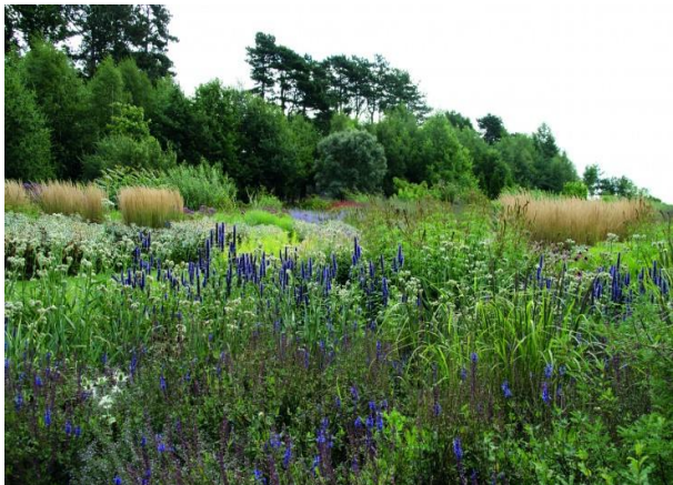
Slika 6. Sadnja biljnih vrsta u slojevima (zimzeleno grmlje u prvom planu, trajnice u pozadini)