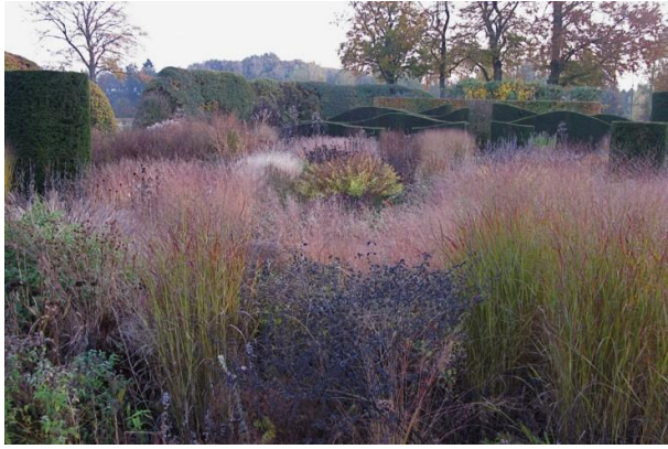
Slika 2. Stvoreni okvir oko horizonta pomoću mnoštva trava