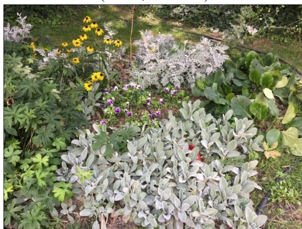
Slika 29. Trajnice ( Rudbeckia hirta , Bergenia crassifolia ) u kombinaciji sa sezonskim cvijećem ( Viola )