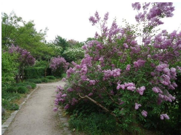
Slika 27. Syringa vulgaris