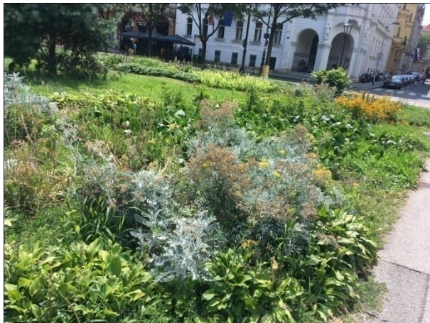
Slika 13. Gredica u četvrti Donji Grad (Trg Josipa Jurja Strossmayera) (Božić, G. 2018.)

Područje istraživanja u četvrti Sesvete, Novi Jelkovec je obuhvaćalo 6 povišenih gredica s trajnicama, dok je u četvrti Donji Grad obuhvaćalo svega 2 gredice. Analizirane gredice su prikazane na slikama 13 i 14.