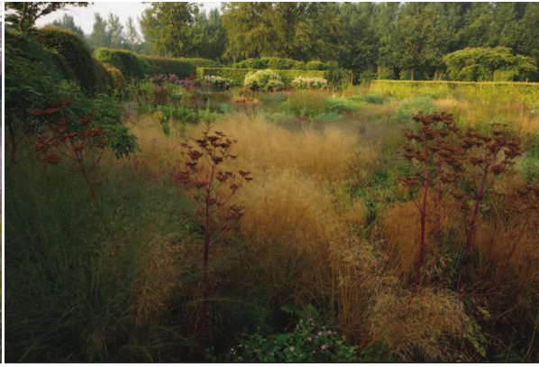
Slika 3. Poznata Oudolfova tehnika miješanja trava i trajnica