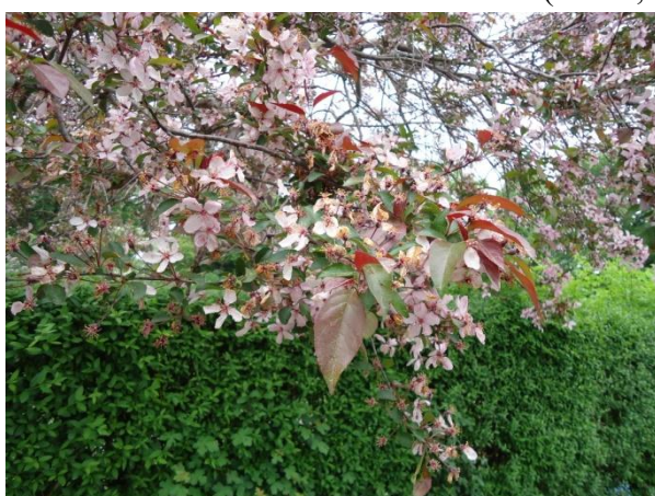
Slika 25. Prunus sp.