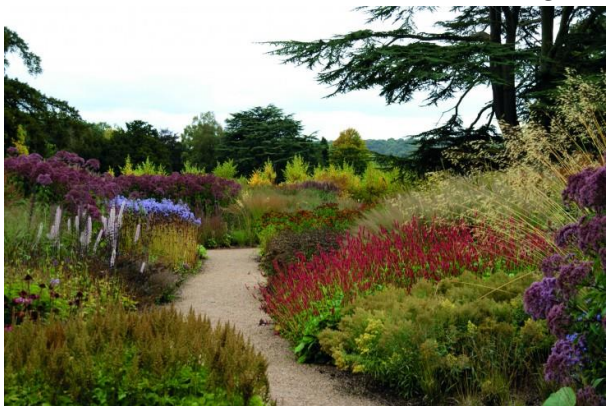
Slika 4. Ponavljanje biljaka - ritam i varijacija