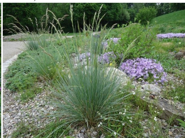
Slika 24. Kombinacija Juncus patens i Phlox subulata 'Emerald Blue'