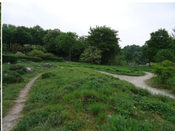
Slika 33. Gredica s korovima (Westpark)