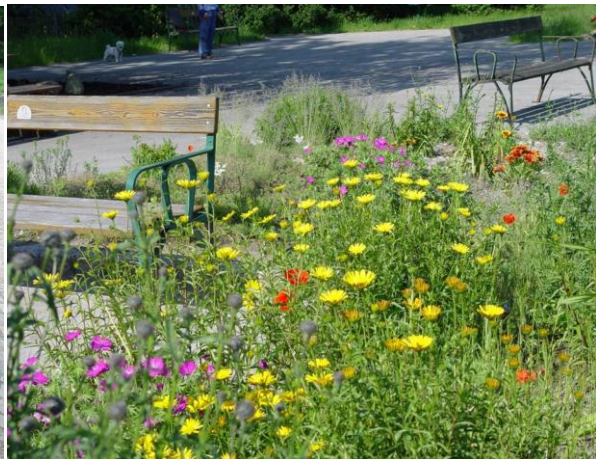
Slika 36. Klupe prisutne u Hugo Wolf Parku (Božić, G. 2018.)