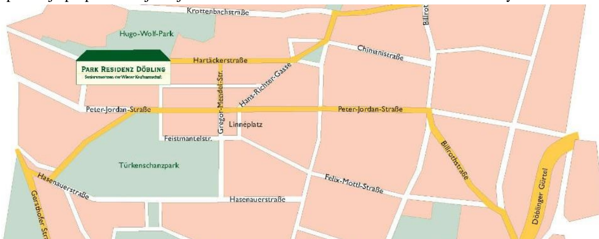
Slika 11. Smještaj Hugo Wolf Park-a, Beč na karti

park ( www.wien.gv.at ). Istraživanje je obuhvaćalo srpanj 2003. godine. Napravljena je analiza biljnog materijala primijenjenog na gredicama i estetski izgled gredica. Analiza biljnog materijala napravljena je kao i za Zagreb; pomoću enciklopedije '400 vrtnih biljaka', mobilne aplikacije prepoznavanja biljaka 'Plantnet' te internetske stranice 'Plant taxonomy index'.