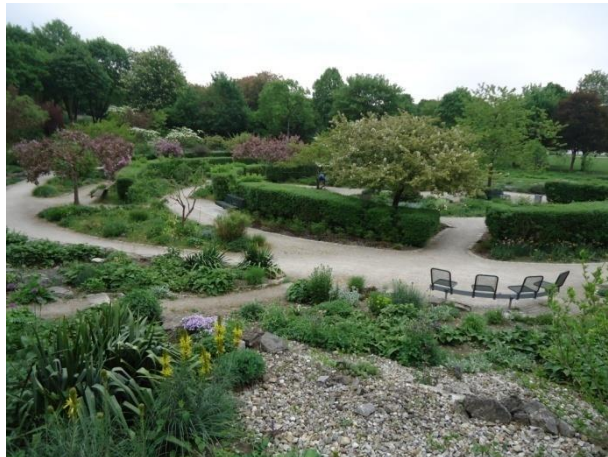
Slika 34. Živa ograda kao uloga estetike i zaštite od vjetrova (Westpark) (Božić, G. 2018.)

Primjenom autohtonih trajnica i njihovim doprinosom ova dva parka Srednje Europe se ističu svojom estetikom. Prirodan izgled staništa koje trajnice pružaju parkovima pokazao se izuzetnim ekonomskim dobitkom. Osim prije navedenih ritmičkih izmjenjivanja u razdoblju cvatnje primijenjenih vrsta, u Westparku je uočena i živa ograda koja dodatno doprinosi estetici gredica, prikazano na slici 34.