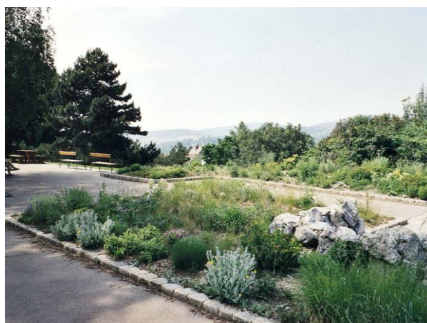
Slika 17. Trajnice za kamenjaru (Hugo Wolf Park, Beč) (Han Dovedan, I. 2003.)