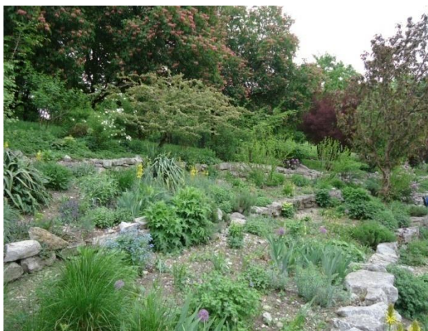
Slika 20. Terasa kamenjara (Westpark) (Božić, G. 2018.)