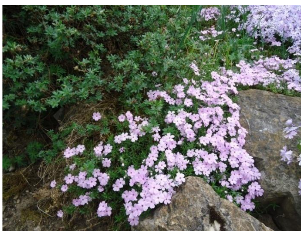
Slika 19. Trajnice za kamenjaru (Westpark) (Božić, G. 2018.)