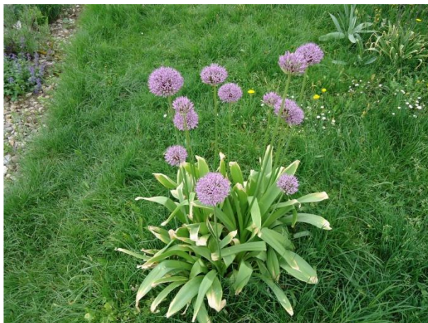
Slika 18. Trajnice za sunčana staništa (Westpark) (Božić, G. 2018.)

Kao i područje Hugo Wolf Parka, područje istraživanja Westparka je obuhvaćalo trajnice za sunčana staništa na gredicama, uključujući još i trajnice za sjenovita staništa te kamenjare, prikazano na slikama 18, 19, 20 i 21.