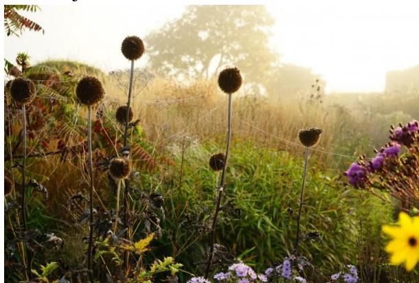
Slika 1. Oudolfov vrt Hummelo tijekom zimskih dana

Naturalistički stil u Nizozemskoj, poznat pod nazivom 'dutch wave' a kasnije 'new wave', činila su četiri dizajnera: filozof Rob Leopold; umjetnik i vrtlar Ton ter Linden; vrtlari i dizajneri Henk Gerritsen i Piet Oudolf, koji su poslije i surađivali (Mullet, 2016). 'New wave' pokret je bio spoj ideja o naturalističkoj sadnji, dizajnu, umjetnosti, filozofiji i hortikulturi. Pokrenut je 1980-ih godina tijekom okupljanja 'otvorenih dana' koje su vodili Anja i Piet Oudolf, u prostorima svojeg vrta Hummelo, Nizozemska (Spencer, 2015). Vrt Hummelo tijekom zimskih dana prikazan je na slici 1.