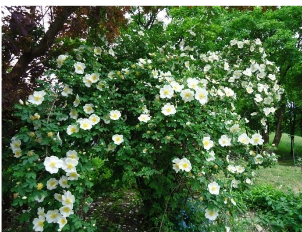
Slika 28. Rosa sp.