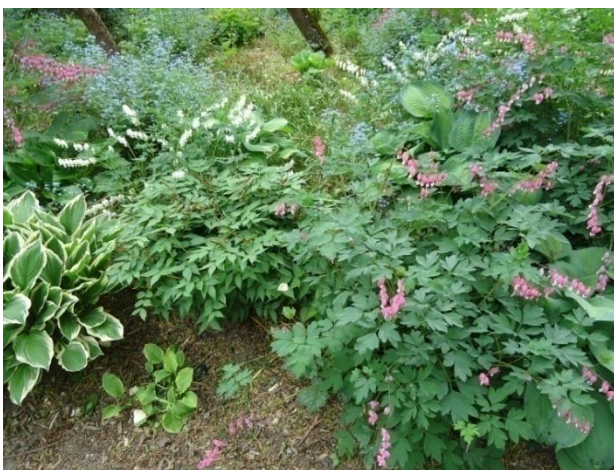
Slika 21. Trajnice za sjenovita staništa (Westpark) (Božić, G. 2018.)