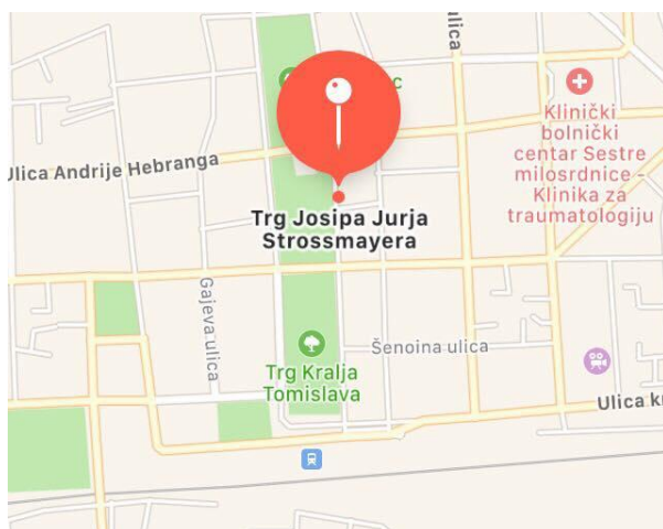
Slika 9. Prikaz četvrti Donji Grad (Trg Josipa Jurja Strossmayera) (Google Maps)

Grad Zagreb se nalazi u kontinentalnoj središnjoj Hrvatskoj, na južnim obroncima Medvednice te na obalama rijeke Save. Nalazi se na nadmorskoj visini od 122 m, a prostire se na površini od 641 km 2 . Klima u Zagrebu je umjereno kontinentalna. Ljeta su vruća i suha s prosječnim temperaturama od 20°C, dok su zime hladne s prosječnim temperaturama od 1°C. Prosječna vrijednost oborina je oko 880 mm godišnje ( www.wikipedia.hr ). Zagreb se administrativno sastoji od 17 četvrti: Brezovica, Čnomerec, Donja Dubrava, Donji grad, Gornja Dubrava, Gornji grad - Medveščak, Maksimir, Novi Zagreb - istok, Novi Zagreb - zapad, Peščenica - Žitnjak, Podsljeme, Podsused - Vrapče, Sesvete, Stenjevec, Trešnjevka - jug, Trešnjevka - sjever i Trnje. Područje istraživanja obuhvaćalo je četvrti Donji Grad i Sesvete, prikazano na slici 9 i 10. Gredice su bile promatrane u razdobljima: lipanj 2017. godine - gredica u Sesvetama i srpanj 2018. godine - gredica u Donjem Gradu. Metode koje su se koristile tijekom ovog istraživanja uključivale su: analizu biljnog materijala na cvjetnim gredicama s obzirom na prikladnost izbora vrsta u odnosu na ekološke uvjete te estetski izgled gredica. Analiza biljnog materijala napravljena je pomoću enciklopedije '400 vrtnih biljaka', mobilne aplikacije prepoznavanja biljaka 'Plantnet' te internetske stranice 'Plant taxonomy index'.