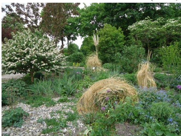
Slika 23. Kombinacija Cortaderia selloana i Brunnera macrophylla