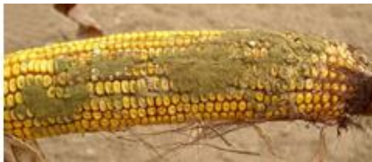
Slika 2.1.3.1. Prikaz Aspergilloso klipa kukuruza

Plijesni iz roda Aspergillus proširene su po cijelom svijetu, ali najčešće se nalaze u krajevima sa toplim klimatskim uvjetima. Visoke temperature okoliša (iznad 25 °C) te suše dovode do stanja stresa kod Aspergillus flavus-a zbog čega u tim uvjetima proizvodi aflatoksine (Bankole i Adebajo 2003.). Aflatoksini, od svih mikotoksina, najbolje su proučeni te je otkriveno da imaju kancerogen učinak na ljude i životinje. Kukuruz i ostale žitarice sadrže, uglavnom više različitih mikotoksina, koje patološki djeluju na organizam životinja (Rupić 2009.).