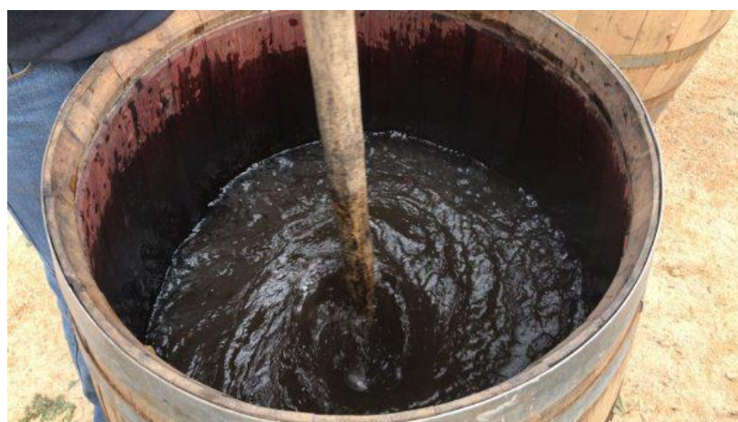
Slika 2.3.2.a Dinamiziranje biodinamičkih pripravaka

Dinamiziranje biodinamičkih pripravaka je postupak njihovog razrjeđivanja s vodom i intenzivnog miješanja. Svrha miješanja jest stvoriti efekt vira kojim se u sredini posude dobiva vertikalni krater, odnosno, vrtlog. Jednom ili dva puta u minuti mijenja se smjer miješanja kako bi se vrtlog slomio i stvorio novi (Waldin, 2016). Slika 2.3.2.a prikazuje način dinamiziranja. Masson (2011) spominje kako bi stvoreni vir trebao biti što ravniji i dublji, odnosno, trebao bi se protezati do dna posude.